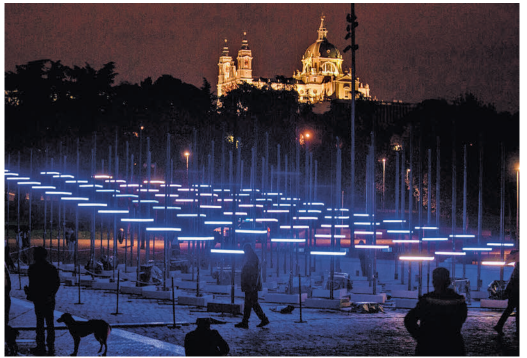
Una de las creaciones de la primera edición, celebrada en la capital en el año 2021