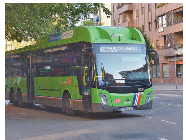
Autobús de la línea 422

Aguado señaló el grave problema de movilidad que sufren en el centro, sobre todo después de que el anterior Gobierno socialista "suprimiera 400 plazas de aparcamiento y creara una zona de bajas emisiones que cubriría todo el centro sin ningún tipo de estudios". "Así no se hacen las cosas. Hay que poner soluciones para la movilidad de los vecinos y por eso creemos que la construcción del aparcamiento es fundamental", añadió.