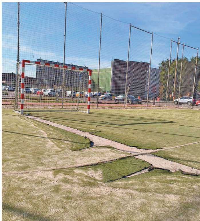
Instalaciones del Francisco Javier Castillejo

Según el PP, el agua corriente de los aseos interiores del pabellón "no es ni transparente ni insípida". "El agua tiene un color marrón y un sabor extraño que invita a pensar en una mala canalización de tuberías", han manifestado, tras asegurar que el agua "no ofrece ninguna garantía de ser potable". Además, los populares han reclamado que se suministre a esta zona deportiva, utilizada por miles de deportistas, agua del