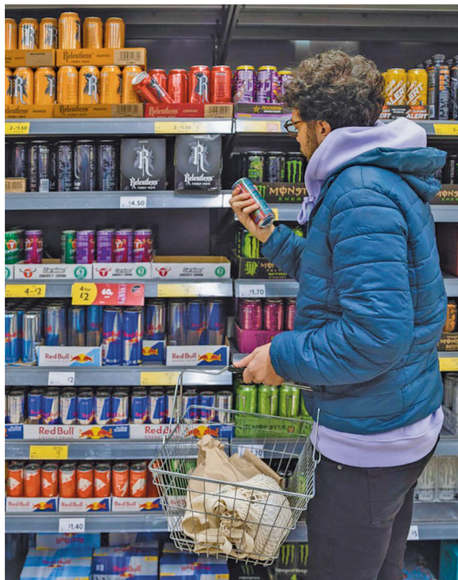
Un joven compra bebidas energéticas

Además, resalta que este tipo de bebidas "no deben combinarse con bebidas alcohólicas" ya que "el consumo de alcohol mezclado o en combinación con bebidas energéticas conduce a estados subjetivos alterados que, en-