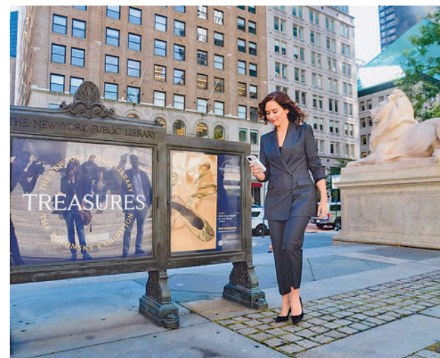
Díaz Ayuso, durante su visita a Nueva York