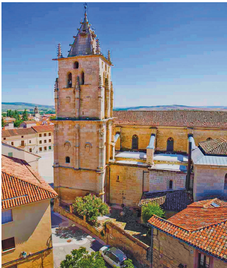
Los pueblos son un reclamo para muchos madrileños