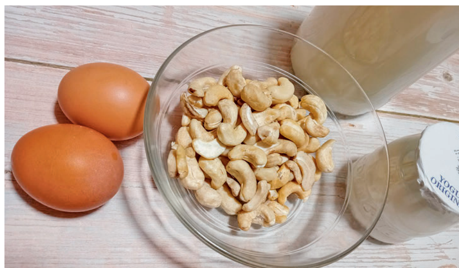
Comida recomendada GENTE

mente, también en esta época del año. Ésta aporta las vitaminas que el cuerpo necesita, puesto que el organismo no es capaz de producir la mayoría de ellas. Por eso, se ingieren a través de la co-