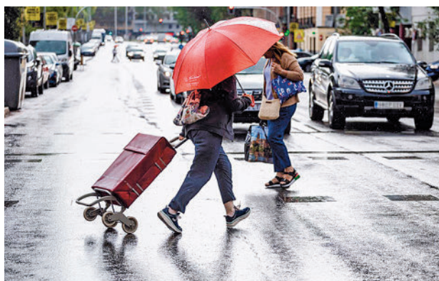
La lluvia podría hacer acto de presencia en Madrid