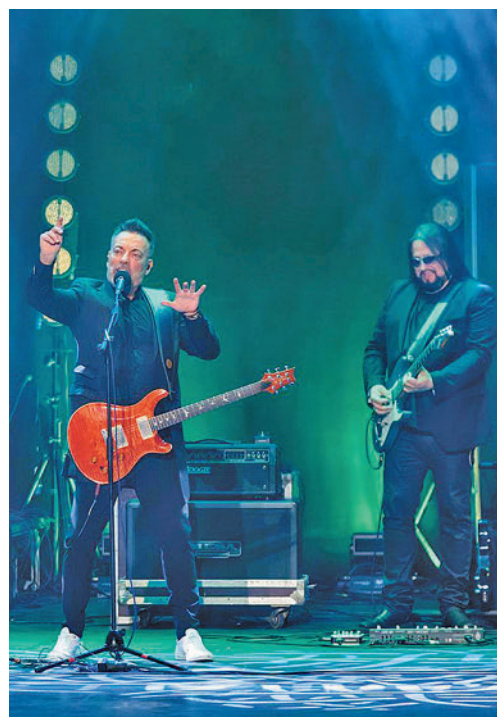
Café Quijano, en concierto

Al día siguiente, los más pequeños de la casa serán también protagonistas de estos festejos, gracias al Día de la Infancia en La Vaguada, donde habrá juegos, rocódromo, futbolines o karts, de 11:30 a 14:30 y de 16:30 a 19 horas.