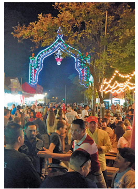
El recinto ferial del parque de La Vaguada

Además, el mismo día (de 8 a 14 h.) se desarrollará la XVIII edición del Certamen de Pintura Rápida en la plaza de Salvador Dalí.