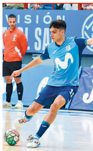
Cita en el Jorge Garbajosa

triunfo de prestigio en la cancha del Palma Futsal. El arranque liguero del Inter Movistar ha dejado resultados de lo más variado, una