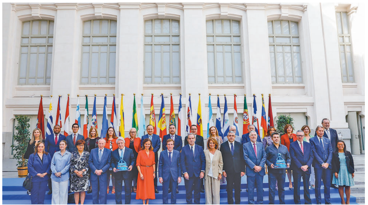
Foto de familia de los asistentes al acto conmemorativo de la Fiesta Nacional en la Galería de Cristal de Cibeles

Para ello, este espacio organizará actividades para todos los públicos con el objetivo de poner en valor el carácter intergeneracional de su obra y la permanencia de los personajes y las historias que han ilustrado y divertido a varias generaciones.