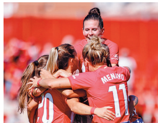
El Atlético recibirá al Barça

garán como visitantes. El Real Madrid jugará en el campo del Granada (sábado, 18:30 horas) con el objetivo de meter presión a Barça y Atlético, mientras que el Madrid CFF, que es cuarto en la clasificación (sólo ha perdido con el Barça) parte como favorito en su partido de este domingo (12 horas) en el campo del Sporting de Huelva.