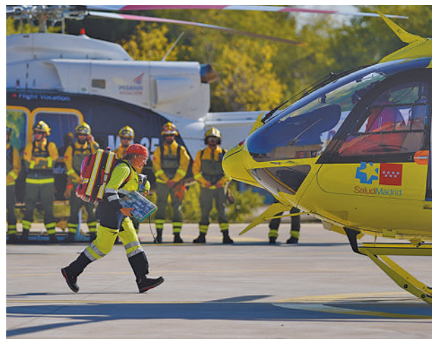
Medios del Parque de Bomberos de Las Rozas

Las cifras también bajan en los nueve primeros meses de 2023 con un total de 185 fuegos en la región, que suponen el 2,67% de los 6.918 registrados en el territorio nacional.