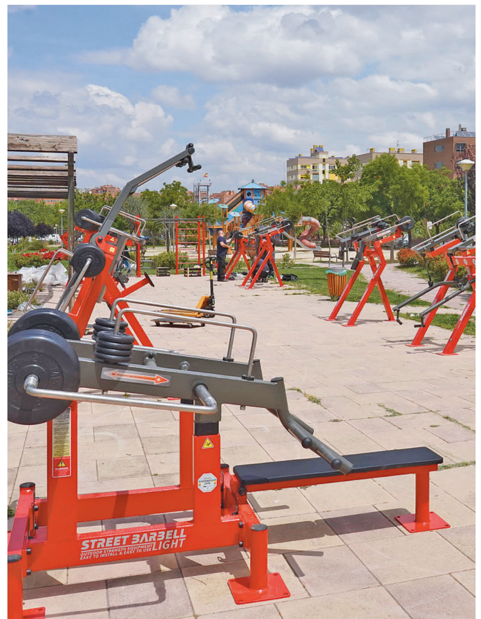
Uno de los gimnasios de musculación al aire libre que hay en la región AYUNTAMIENTO ALCORCÓN

Algo especialmente importante para combatir la apatía y el estrés es, sin duda, la práctica regular de ejercicio. Por eso, aunque el clima en ocasiones sea menos favorable, no hay que descuidar este hábito y realizarlo en gimna-