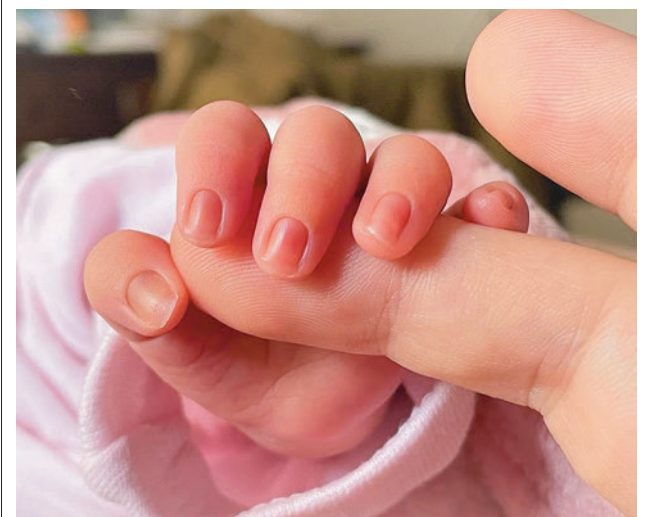
Bebé nacido en la Comunidad de Madrid

"Será un centro pionero y referencia en Europa", explicó Ayuso, que añadió que "se prestará atención a familiares o cuidadores ofreciendo información, asesoramiento y acompañamiento". En el caso de los niños y adolescentes, el tratamiento ambulatorio será en un horario compatible con la escolarización.