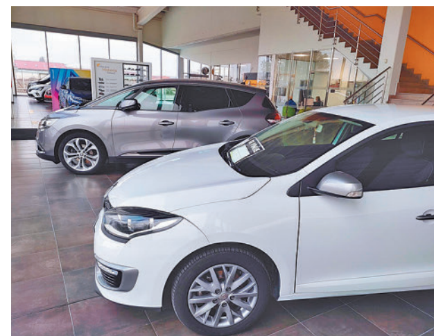
Vehículos a la venta en Madrid

También ha comentado que si se comparan los actuales precios de los vehículos de ocasión con los anteriores a la pandemia de covid-19, los de 2019, el incremento a nivel nacional es de un 3,7%, "muy moderado si se considera que en este periodo el IPC se ha disparado un 15,4%".