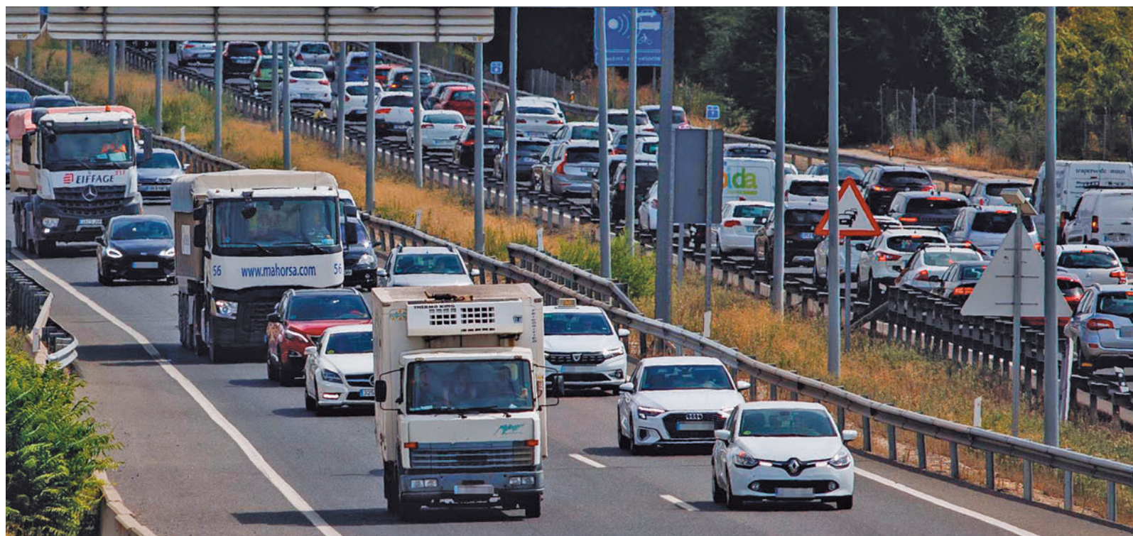
Carretera de la Comunidad de Madrid durante un dispositivo especial

La DGT ha previsto medidas de regulación del tráfico, como la instalación de carriles reversibles y adicionales con conos en las horas de mayor afluencia circulatoria y el establecimiento de itinerarios alternativos.