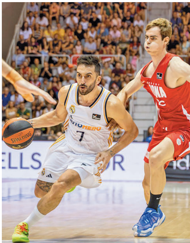
El Real Madrid, único invicto en la Liga Endesa

Al margen de los compromisos madridistas, otra de las