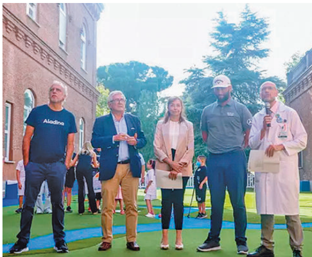
Foto de familia de la inauguración

"Con esta iniciativa se podrán entretener todos los niños que de verdad están luchando por algo importante cada día de su vida", explicó el golfista vasco Jon Rham.