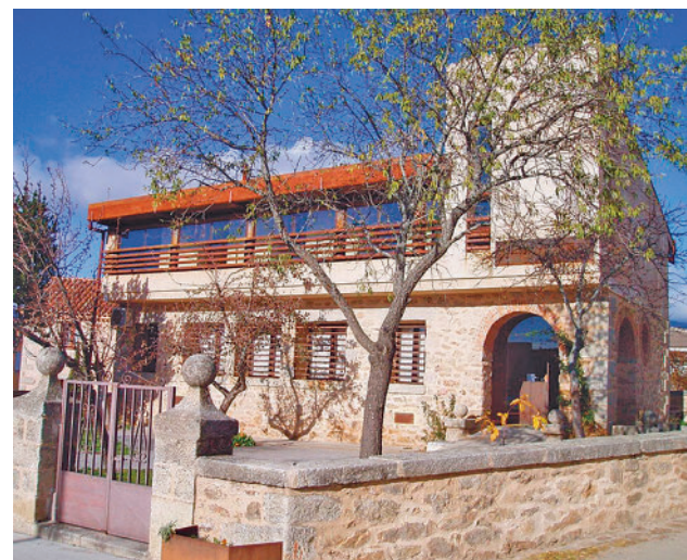
Los pueblos se han convertido en una alternativa