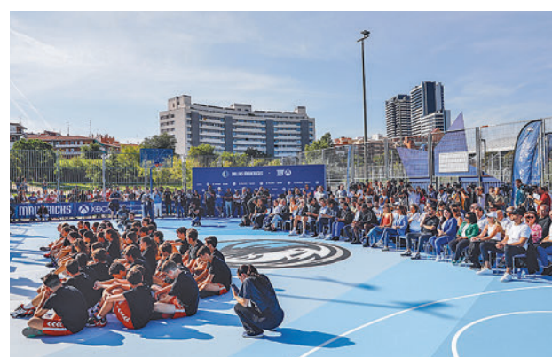
Los asistentes a la inauguración de las instalaciones

Los aficionados al baloncesto de Tetuán pueden utilizar ya dos pistas rehabilitadas en la Instalación Deportiva Básica (IDB) Rodríguez Sahagún II 'Los Pinos', una actuación que ha sido posible gracias al acuerdo de colaboración