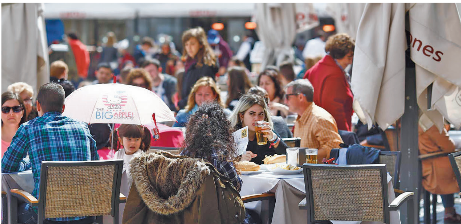
Terrazas en la plaza Mayor de Madrid