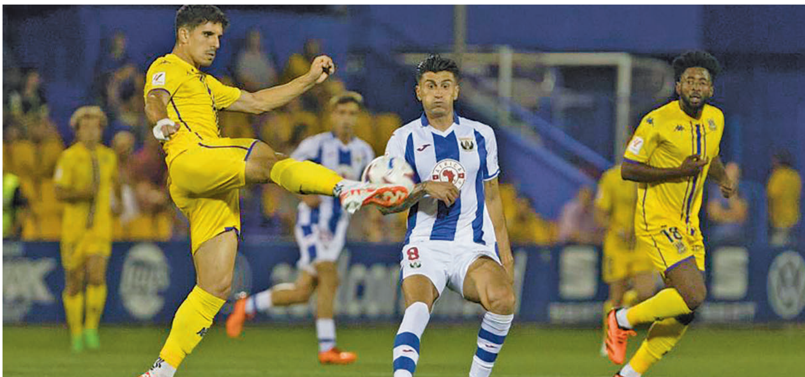
Un momento del derbi que Alcorcón y Leganés protagonizaron en la segunda jornada LALIGA.COM