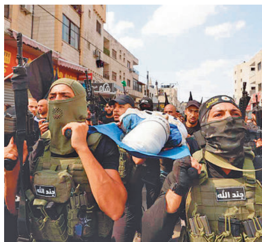
El conflicto en Palestina se recrudece

EL PERIÓDICO GENTE NO SE RESPONSABILIZA NI SE IDENTIFICA CON LAS OPINIONES QUE SUS LECTORES Y COLABORADORES EXPONGAN EN SUS CARTAS Y ARTÍCULOS