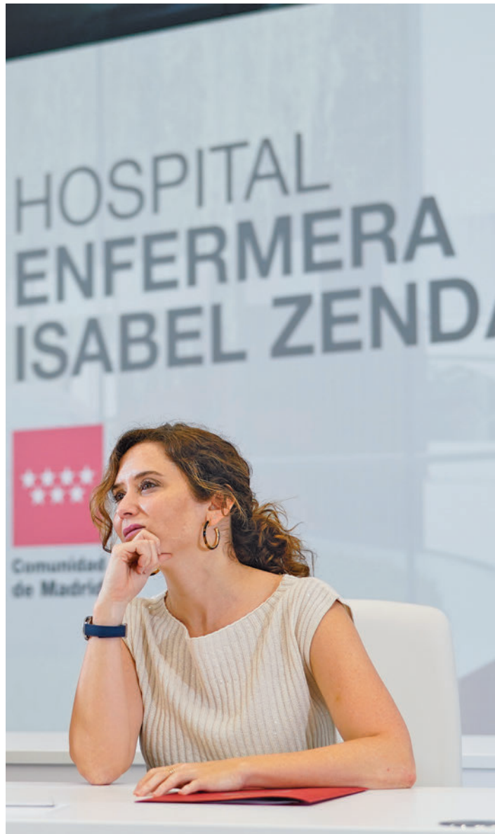
Isabel Díaz Ayuso, en la presentación del proyecto

Se complementará, además, con nuevos espacios ubicados en los pabellones 2 y 3 del Zendal con una quinena de quirófanos, UCI, unidades de recuperación y zonas de diagnóstico, de modo que el hospital conservará su naturaleza como centro de emergencias.