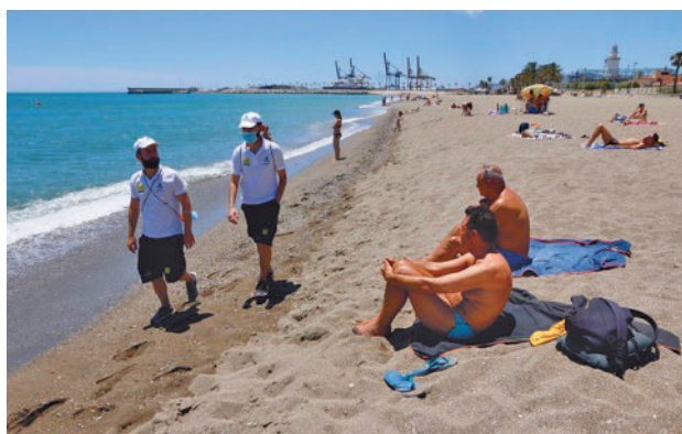
El turismo español está teniendo un buen año

El país registró otro verano exitoso con la llegada en el mes de agosto de un total 10,1 millones de turistas interna-