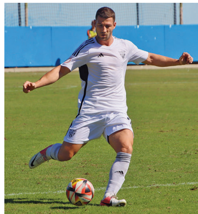
Empate del Canillas M. BLANCO / CD CANILLAS

El Club Unión Zona Norte aspira a emular esos pasos en lo que sería una auténtica hazaña para un equipo (en categoría senior) que empezó a competir en 2017 en Tercera Aficionados y que ahora mismo es duodécimo en el Grupo 1 de Preferente.