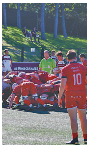
Partido del Alcobendas

tantes madrileños. El Complutense Cisneros acababa hincando la rodilla por 32-39 ante el Barça Rugby, mientras que el Silicius Alcobendas