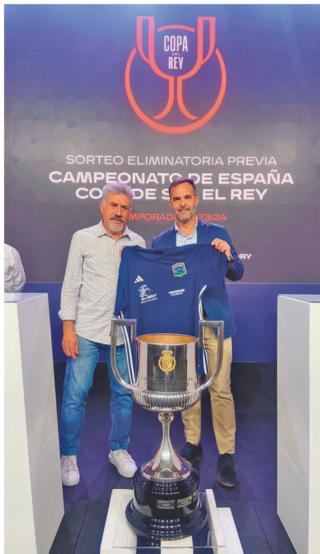
Representantes del club, en el sorteo celebrado en Las Rozas

competición organizada por la Federación Madrileña y que aglutinó a ocho candidatos. Dos de ellos, la Escuela Deportiva Moratalaz y el propio Club Unión Zona Norte terminaron la fase de grupos como líderes, lo que les clasificaba directamente para