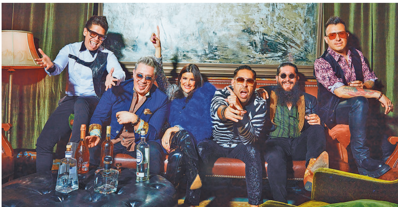
El gusto por la música de los años 80 fue el punto de unión del grupo

» T. Adolfo Marsillach. Sábado 7, 20 horas. Precio: 18 euros