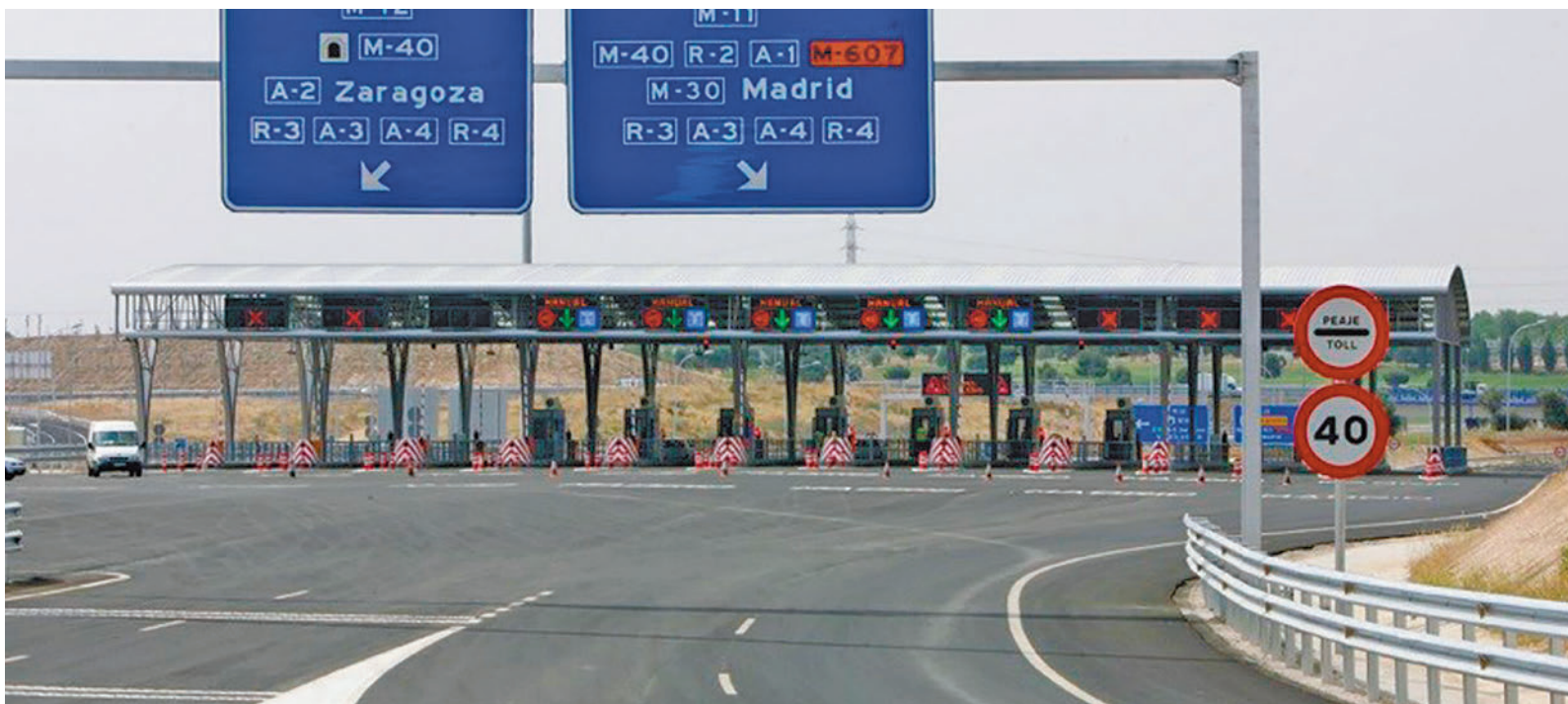
Las autopistas españolas no tendrán peajes obligatorios a partir del año que viene