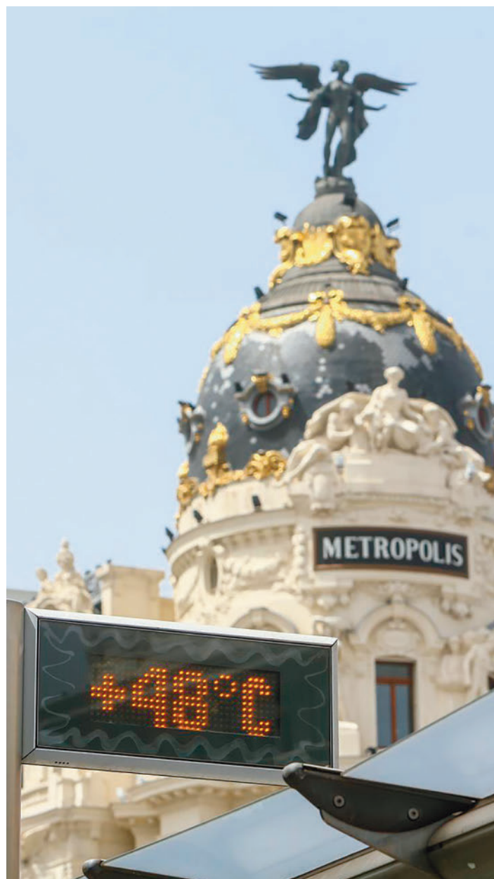
Episodios de calor extremo en Madrid capital

Ecologistas en Acción considera que este fenómeno "debe abordarse como un problema sanitario de primer orden, que causa cada año en torno a 2.500 muertes en España, según la Agencia Europea de Medio Ambiente, afectando a niños, mayores, mujeres embarazadas y personas con enfermedades cardiorrespiratorias". Durante el verano de 2023, el Instituto