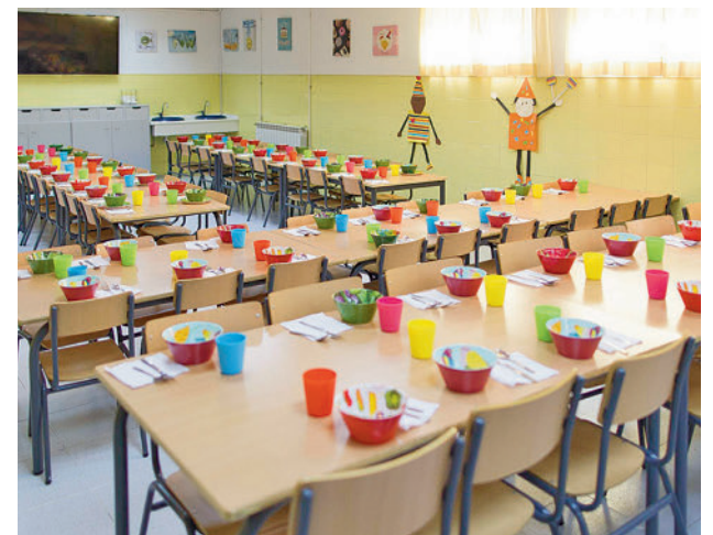
Comedor escolar en Madrid

No hay fecha de publicación de los beneficiarios.