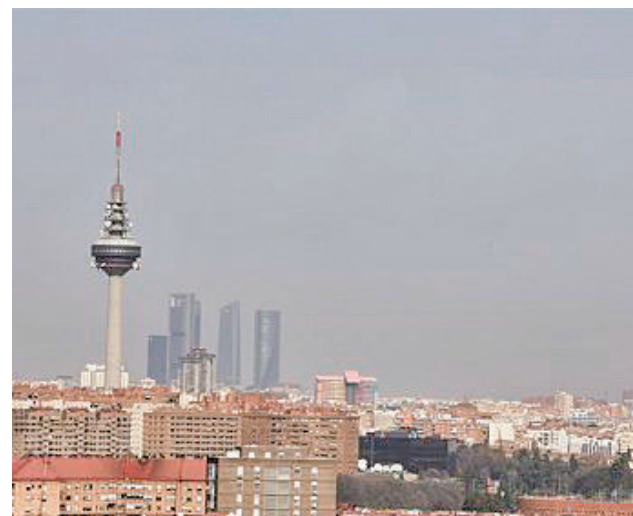
Preocupación por la contaminación en la región