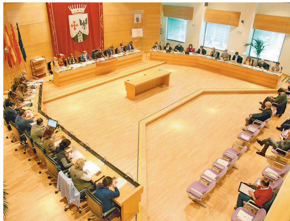
Imagen de archivo de un Pleno de Alcobendas

Las personas elegidas serán parte activa de las asambleas de distrito y del Consejo Social de la Ciudad • La primera de las asambleas se celebrará el día 9 para el Distrito Urbanizaciones