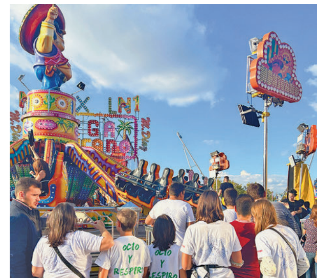
Día sin Ruido en el Recinto Ferial

El último evento se celebrará tres días después de la finalización de las fiestas. Será el domingo 15 de octubre, cuando se dispute la 44ª edición de la Carrera Popular de San Nicasio, un clásico del deporte local.