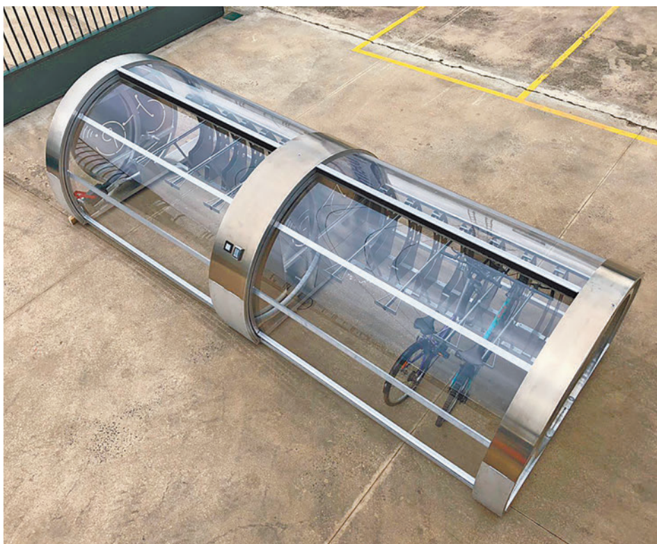
Aparcamiento para bicicletas en Leganés

gentedigital.es Toda la actualidad de Leganés, en nuestra página web