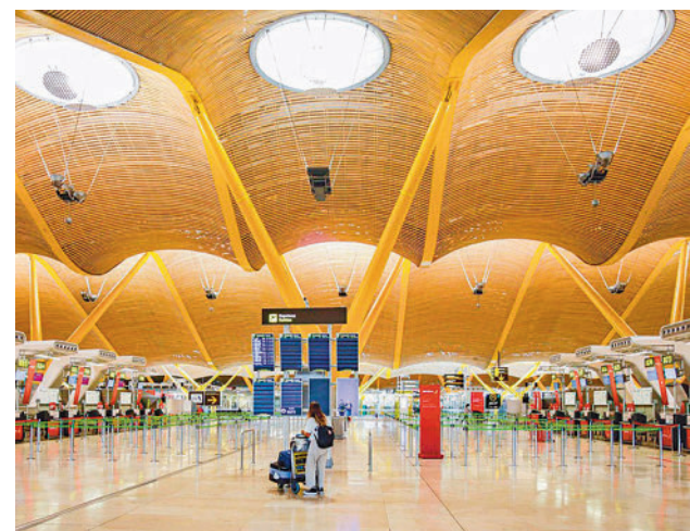
Los españoles valoran sus aeropuertos

En España, son los aeropuertos las infraestructuras mejor valoradas, con un 75%, seguidos por el suministro de agua (66%), la infraestructuras digitales (65%), las autopistas (65%) y el entramado ferroviario (56%). Las peor valoradas son las de las inundaciones (23%).