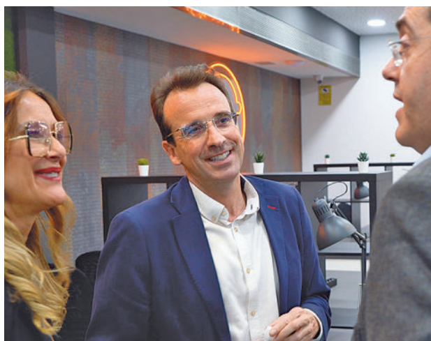
El alcalde, en la inauguración

Se trata de un espacio de trabajo con capacidad para 30 puestos y 4 despachos, además de sala de reuniones y office. Está situado en la calle Puerto de la Morcuera 13, dentro del Polígono industrial Prado Overa. Es el quinto coworking de La Guarida Creativa en la Comunidad de Madrid y ya cuenta con los primeros usuarios de Leganés.