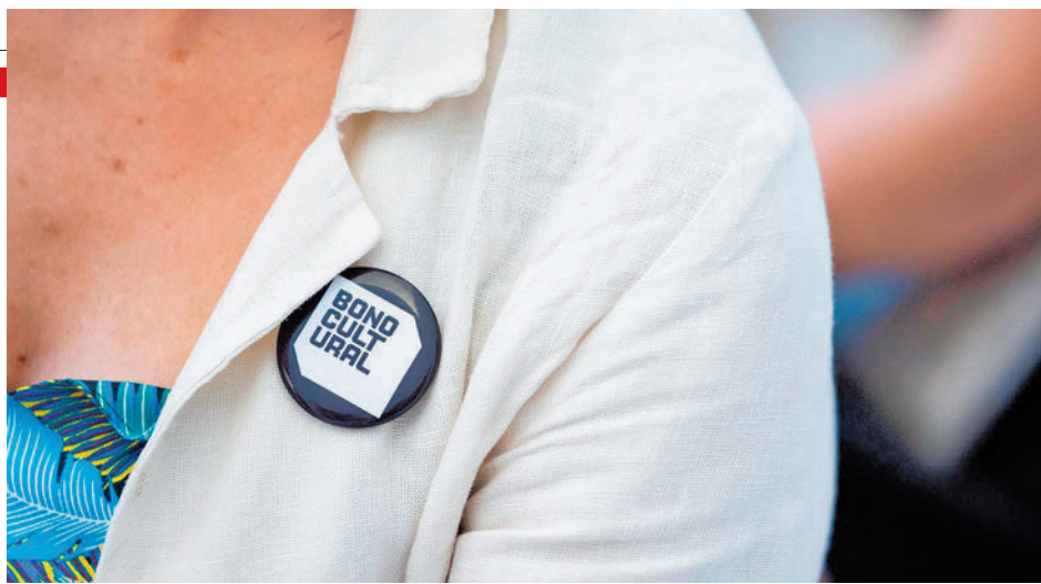
Chapa promocional del Bono Cultural Joven

canal de comunicación entre profesorado, alumnado, titulados, centros, empresas y administraciones públicas vinculadas a la Formación Profesional. Con esta plataforma virtual se quiere crear una gran red nacional e internacional en la que promover la formación, mejorar la empleabilidad, impulsar proyectos conjuntos e intercambiar buenas prácticas.