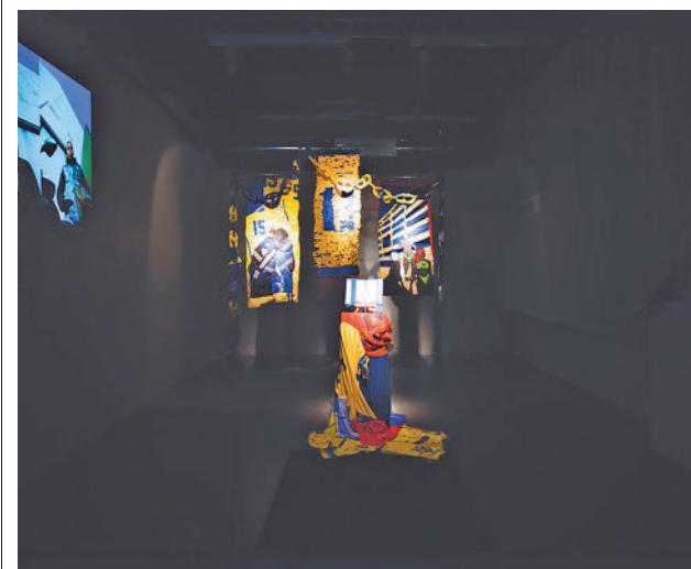
Obra de una de las profesoras de los talleres