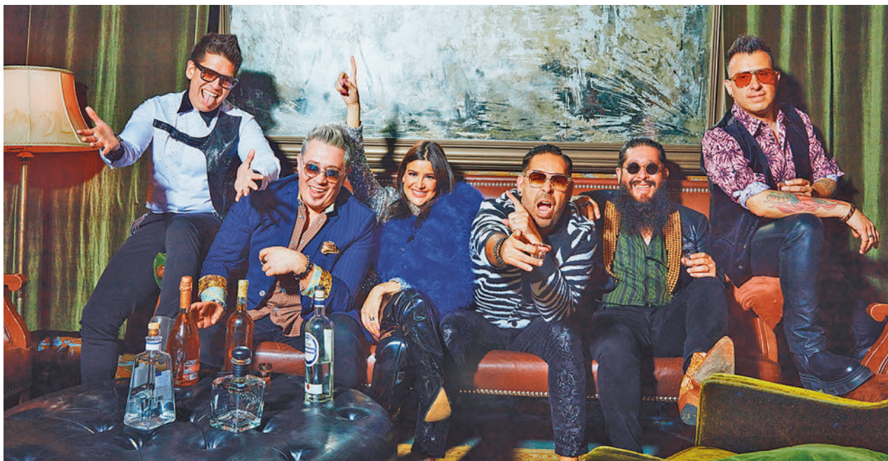
El gusto por la música de los años 80 fue el punto de unión del grupo

» T. Adolfo Marsillach. Sábado 7, 20 horas. Precio: 18 euros