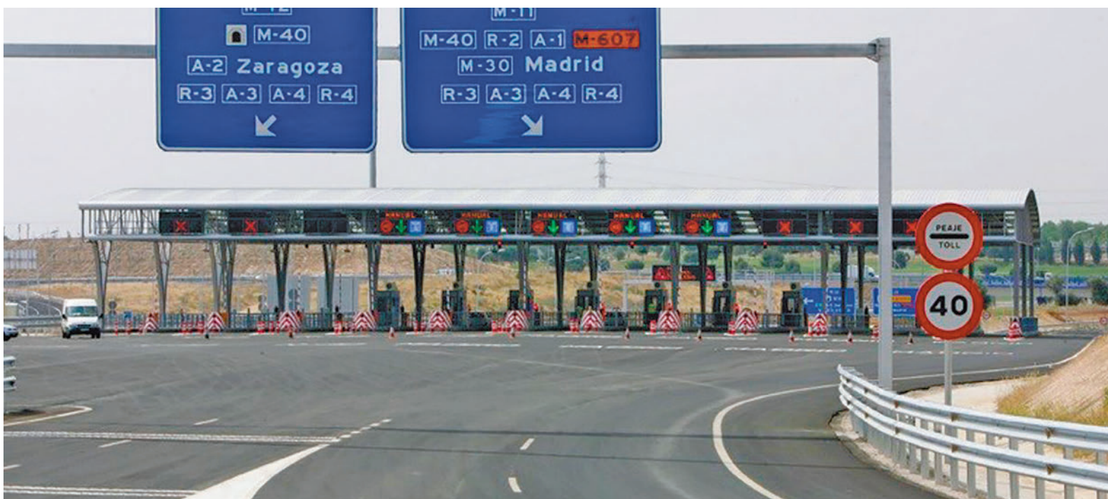
Las autopistas españolas no tendrán peajes obligatorios a partir del año que viene