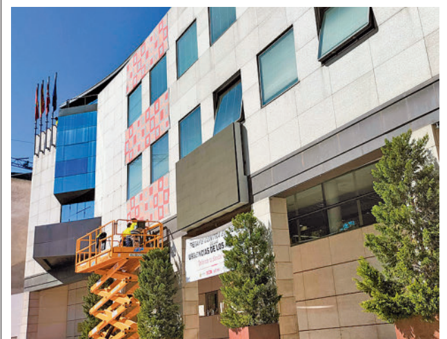
Operarios colocando los tapices