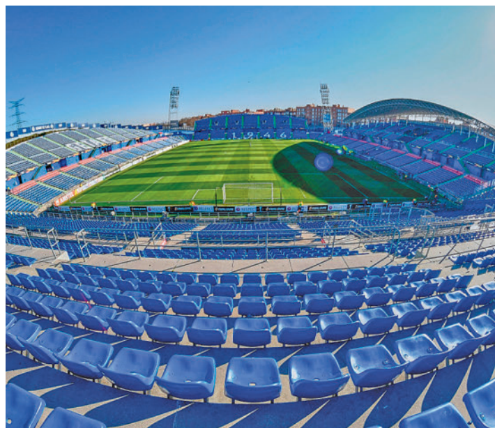
Foto del interior del estadio GETAFE CF

Las declaraciones del exfutbolista sobre el fútbol femenino no han gustado en Getafe, por lo que la infraestructura deportiva pasará a conocerse solo por el nombre de Coliseum