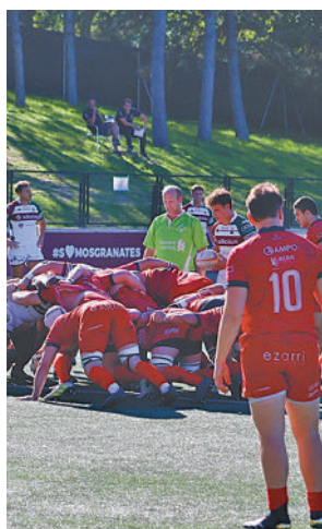
Partido del Alcobendas

tantes madrileños. El Complutense Cisneros acababa hincando la rodilla por 32-39 ante el Barça Rugby, mientras que el Silicius Alcobendas