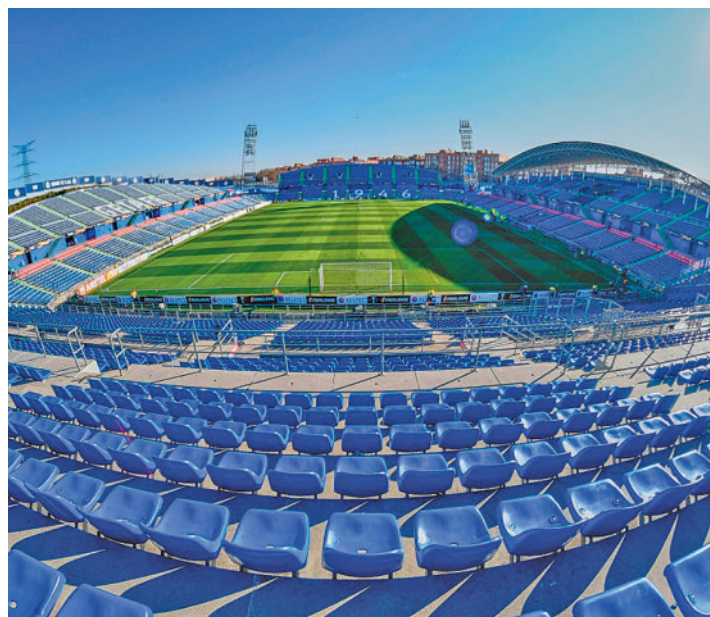
Foto del interior del estadio GETAFE CF

Frases como "deben tener los pies en el suelo y saber que no se pueden equiparar en ningún sentido con un futbolista hombre" o "obligaría a las jugadoras de la selección a besar la bandera de España", son las que recogía el diario El Mundo en una