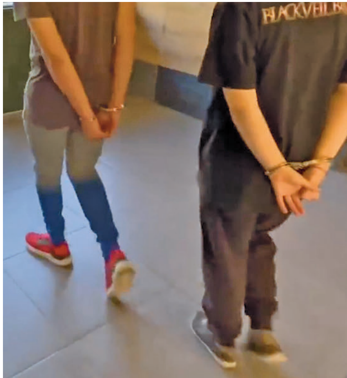
Momento de la detención de los padres de la menor

Las pesquisas se iniciaron hace poco más de un año, cuando agentes de la Unidad Central de Cibercriminología, detectaron a una persona que compartía imágenes sobre explotación sexual a menores de corta edad a través