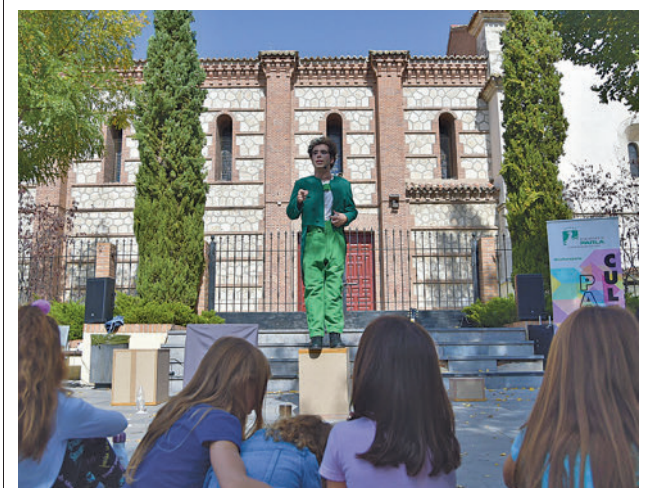
Pasada edición del FITEC en Parla

Entre las actuaciones previstas figuran la creación de nuevas aulas en el Centro de Actividades Educativas y la climatización del edificio en el que se ubican, así como la sustitución de los equipos de climatización del Teatro Municipal. También se arreglará el templete del parque del Cristo de la Salud.