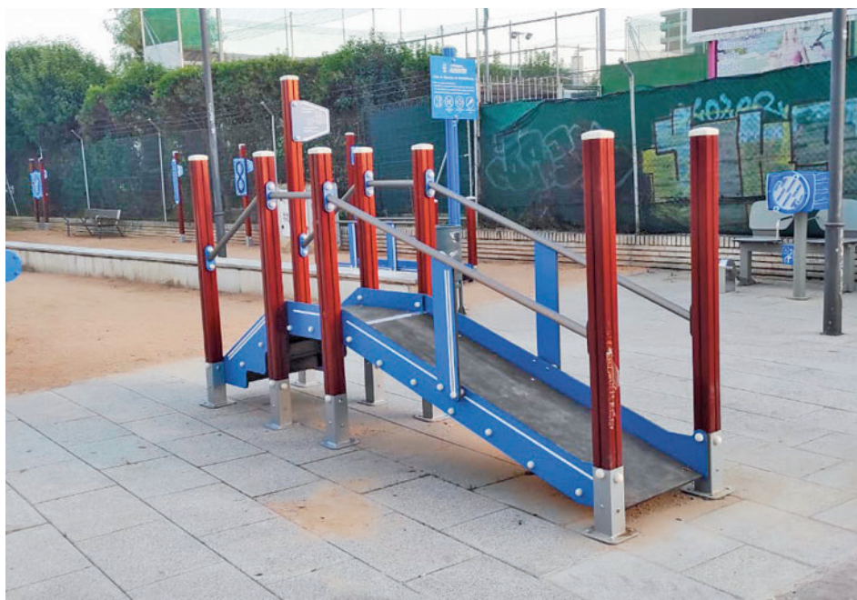
Una de las áreas biosaludables disponibles GENTE

Esto hace que, después de que los servicios municipales hayan allanado la zona para facilitar así la accesibilidad, los vecinos puedan acudir, por primera vez, a cualquiera de las once nuevas áreas biosaludables, "más modernas y eficientes". Éstas se encuentran, entre otros, en los parques del Cementerio Vie-