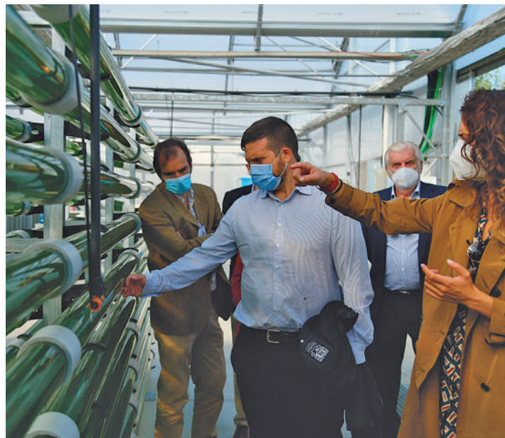
El presidente de Esmasa, durante la visita al nuevo centro AYO ALCORCÓN

La nueva sede de Esmasa será el primer edificio en España con fotobiorreactores que reciclen el aire y el agua reduciendo las emisiones ● También tendrá paneles fotovoltaicos