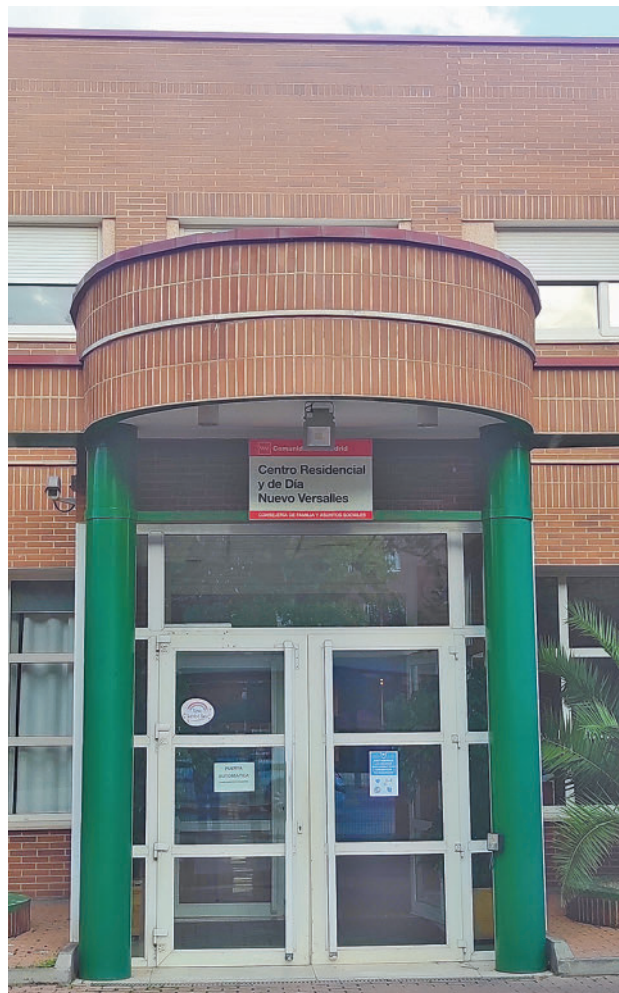
Centro Residencial y Centro de Día Nuevo Versalles GENTE

En concreto, el equipamiento social del Nuevo Versalles, de 7.300 metros cuadrados, incluye alojamiento,