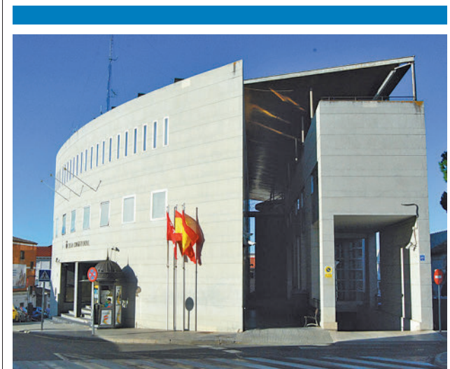
Ayuntamiento de Parla

Se celebrará en el Centro Cultural Casa de la Cadena y estará dirigido por un monitor que enseñará a confeccionar el traje de época. El Consistorio pondrá a disposición de los integrantes las telas necesarias, mientras que los alumnos aportarán los materiales básicos de costura, como tijeras, hilos y agujas. Las sesiones serán los lunes, entre el 2 de octubre y el 18 de diciembre, en cuatro grupos de mañana y tarde. Las inscripciones se pueden llevar a cabo en el Centro Cultural Casa de la Cadena de lunes a viernes de 12 a 18 horas hasta completar el aforo.