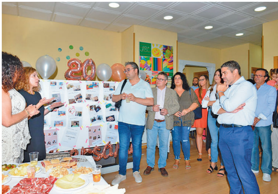
Acto de inauguración del nuevo centro

El objetivo es potenciar su evolución personal, emocional, cognitiva, motora, del lenguaje y social, una labor integral y coordinada con el ámbito escolar. Los tres profesionales que se harán cargo de este servicio ofrecerán apoyo y asesoramiento a las