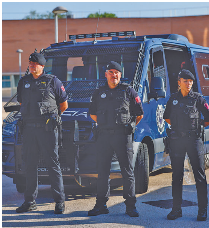
Varios agentes de la capital, con la nueva indumentaria

Además, los nuevos uniformes disponen de la certificación específica que garantiza unos exigentes niveles de protección frente al frío y la lluvia, garantizan unos niveles óptimos de transpirabilidad, protección antibacteriana y descarga de electricidad estática, así como de resistencia ante la abrasión y