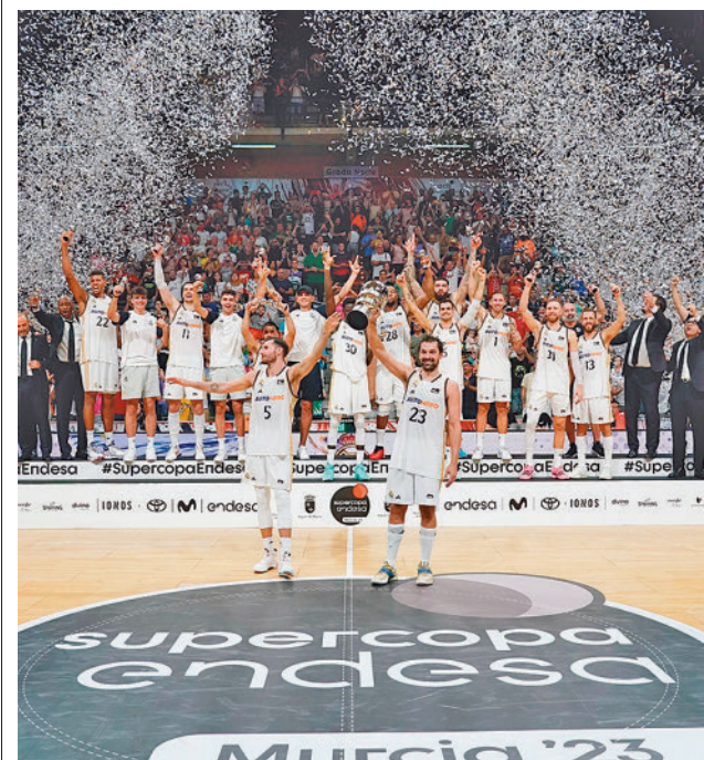
Los blancos conquistaron una nueva Supercopa