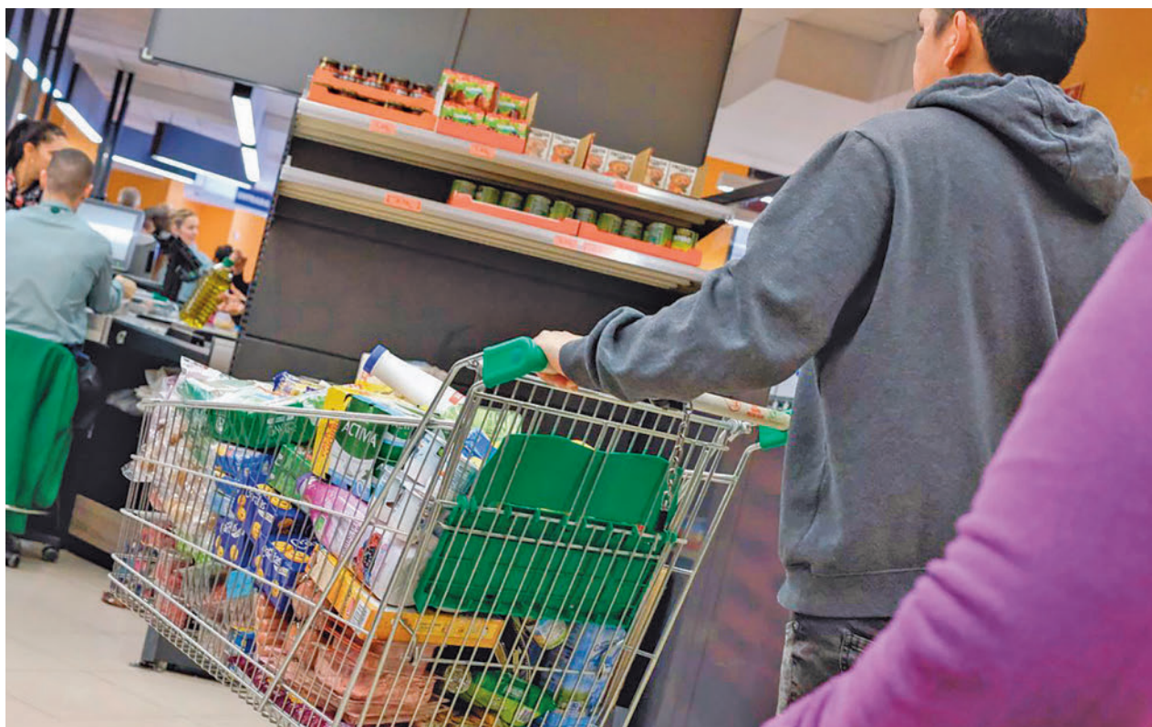
Los supermercados cuentan con sus propias líneas de productos