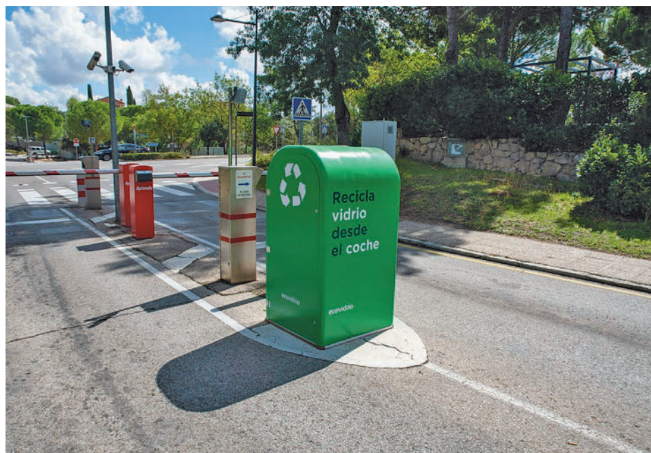
Uno de los nuevos contenedores de reciclaje

Recipientes adicionales Los cuatro recipientes son complementarios a los ya existentes y cuentan con sensores de llenado que permiti-