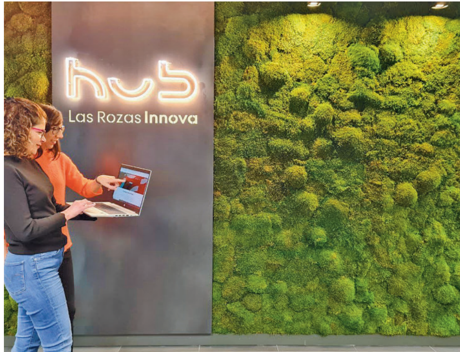
Acto de presentación en el hub de Las Rozas Innova

"Gracias a Las Rozas Innova continuamos dinamizando el tejido económico de la ciudad, poniendo a disposición de pymes y autónomos las herramientas necesarias para impulsar su transformación digital en aras de alcanzar un tejido empresarial más competitivo", ha señalado José de la Uz, alcalde de Las Rozas y presidente de la entidad. Las Rozas Innova se suma así a la ampliación del plazo por