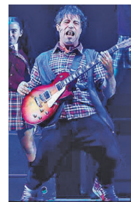
El actor, durante la obra

cal me flipa, porque de una manera egoísta salir de hacer una obra musical es como haber hecho un ironman: sales como nuevo de cabeza y de corazón", asevera, aunque ello conlleva más esfuerzo físico, "tienes que estar bien todos los