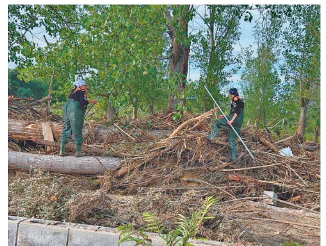
Efectos de la DANA en Villamanta