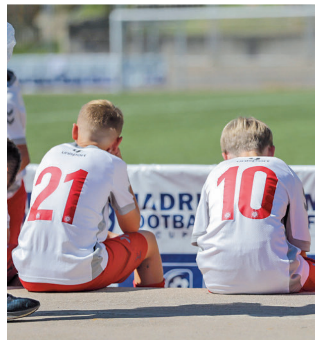
Imagen de la pasada edición

Hay que recordar que el cuadro pepinero ha firmado unos resultados muy similares en los dos años previos, cerrando sendos campeonatos con la undécima posición en la fase regular.