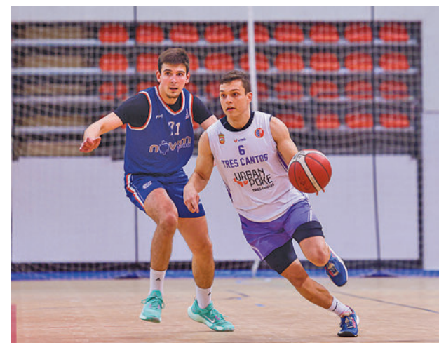
Imagen de un partido de la pasada temporada

Además de recordar al malogrado Javier Varona, este torneo servirá al CB Tres Cantos para ir afinando su preparación de cara al arranque de temporada de la Liga VIPS, fijado el 1 de octubre.