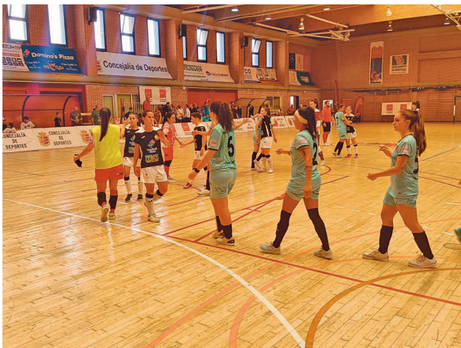
Imagen del partido entre el Móstoles y el Navalcarnero en la Copa de la Comunidad