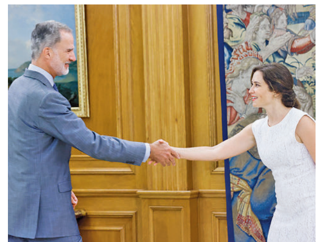
Felipe VI e Isabel Díaz Ayuso

Esta ha sido la tercera vez que Ayuso ha acudido a Zarzuela para un encuentro de este tipo. Ya estuvo tras las elecciones de 2019 y después de las de 2021.