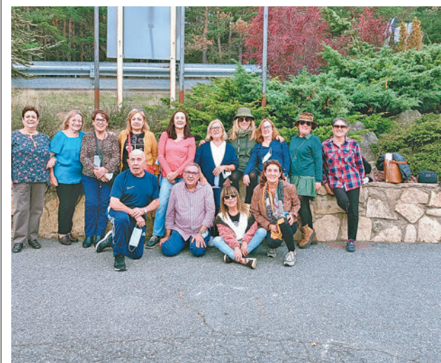
Presentación de los cursos

Toda la información de Leganés, en nuestra página web