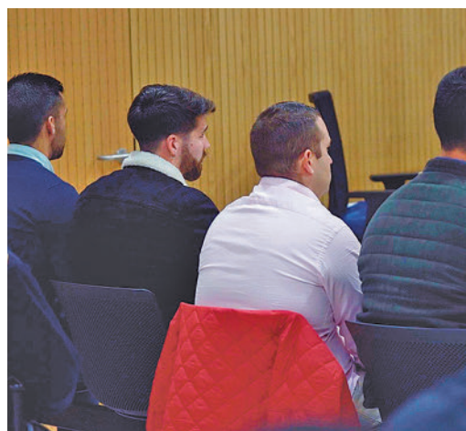
Uno de los juicios a 'La Manada'

EL PERIÓDICO GENTE NO SE RESPONSABILIZA NI SE IDENTIFICA CON LAS OPINIONES QUE SUS LECTORES Y COLABORADORES EXPONGAN EN SUS CARTAS Y ARTÍCULOS