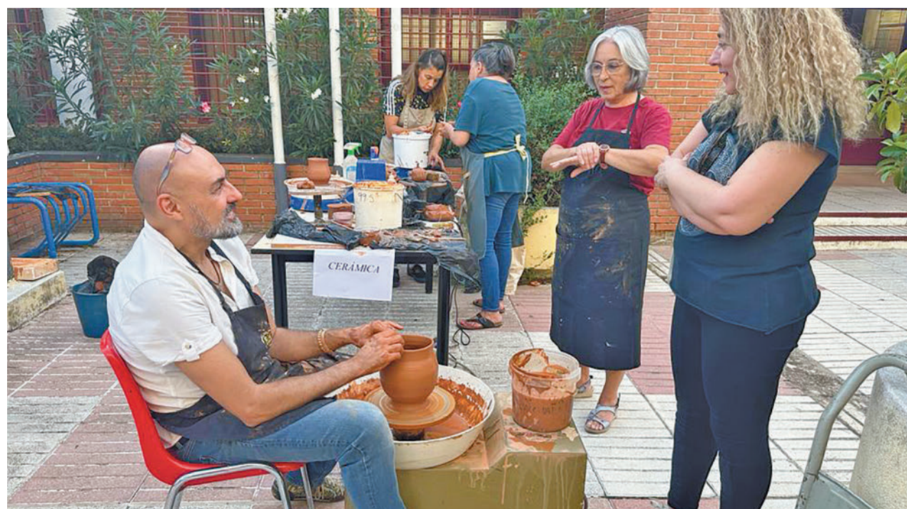
La pasada semana hubo una jornada para conocer los diferentes cursos y talleres

Una vez terminada la formación, los voluntarios de la UPL pasan a formar parte del programa de animación sociocultural, donde se realizan diversas actividades.