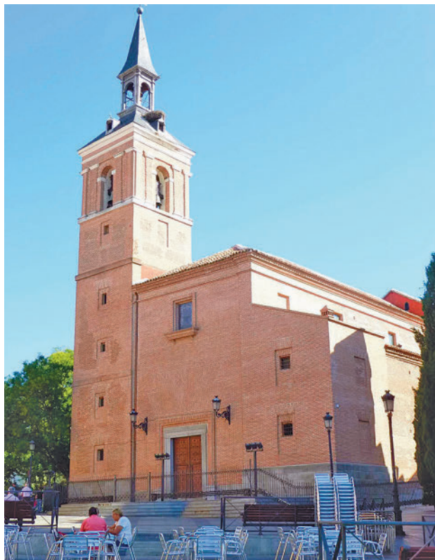
Aspecto exterior del templo