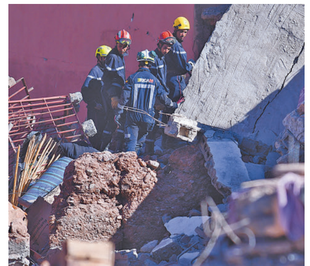
Bomberos madrileños en Marruecos

Albares señaló que habían contactado con aerolíneas como Iberia y Binter para que lleven aeronaves con mayor capacidad en sus vuelos con Marruecos, de modo que puedan acoger a todos los españoles que quieran abandonar el país en estos días.