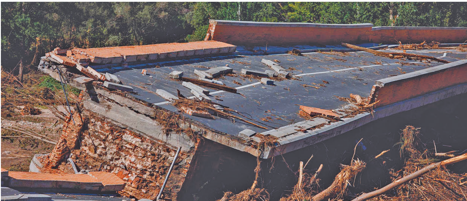
Una de las carreteras destruidas por la DANA en la Comunidad de Madrid