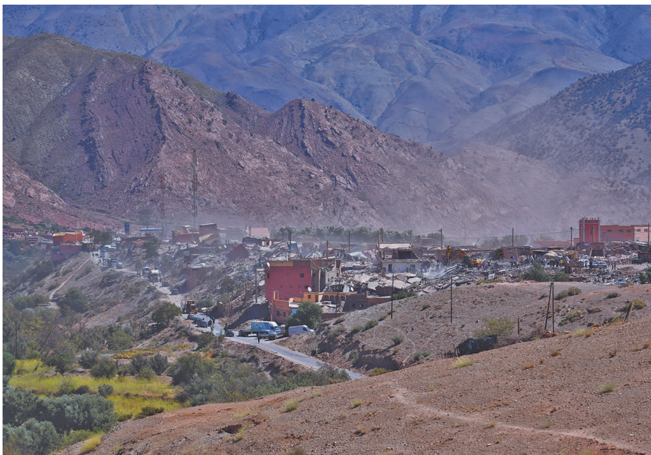
Una de las poblaciones marroquíes afectadas por el terremoto