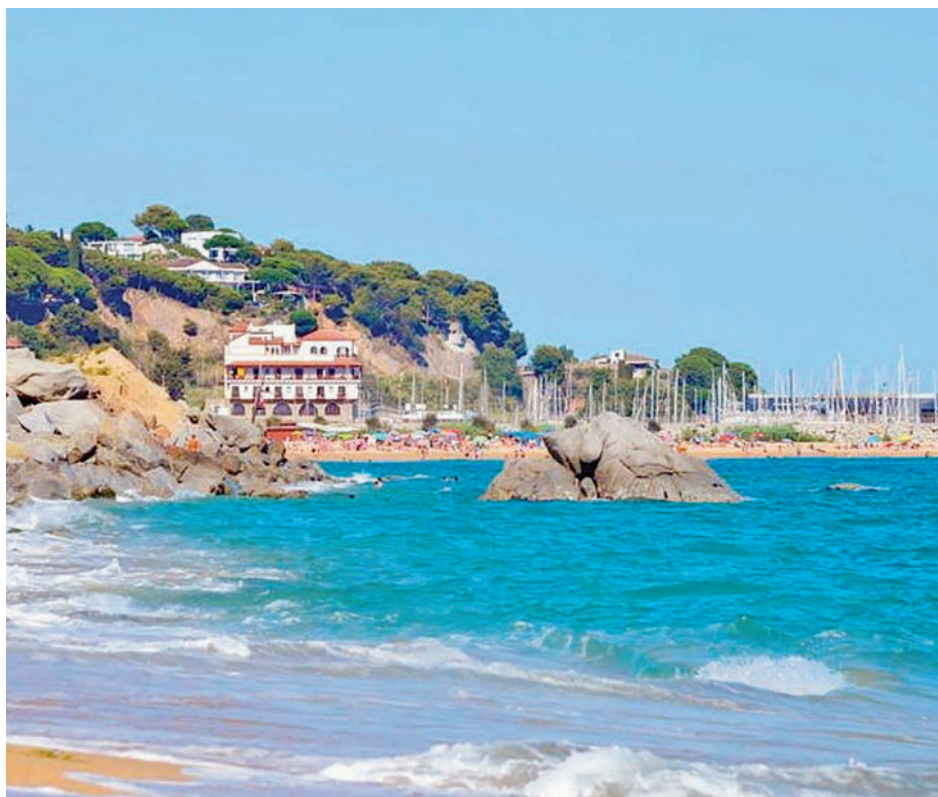
El mar ha tenido su verano más caliente desde que hay registros

Tanto las boyas situadas en el mar Mediterráneo como las del Cantábrico llegaron a registros nunca vistos con anterioridad • Esta circunstancia está relacionada con fenómenos meteorológicos como las tormentas o DANA