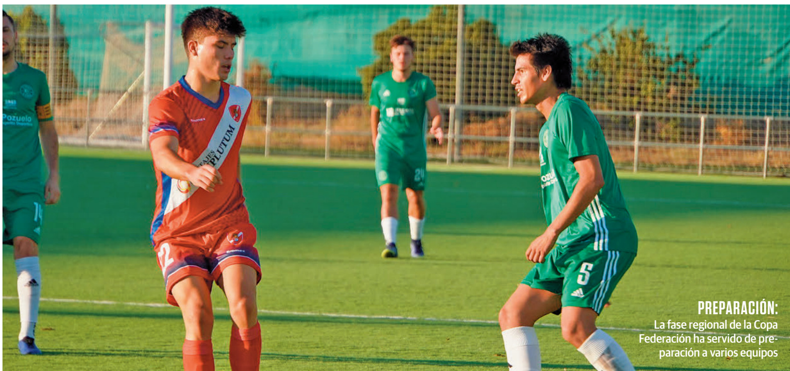
PREPARACIÓN: La fase regional de la Copa Federación ha servido de preparación a varios equipos