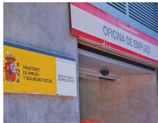
Oficina de los servicios públicos de empleo

El paro bajó en agosto en la agricultura, con 2.874 desempleados menos que en julio (-2,7%), y en el colectivo sin empleo anterior, donde disminuyó en 2.672 personas (-1,1%). En cambio, subió en los