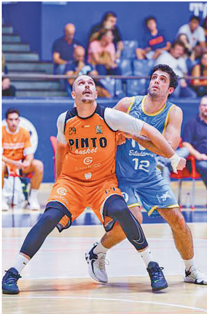
Imagen de un partido de la pasada edición FBM

En esta ocasión serán 13 de los 14 conjuntos integrados en esa competición, después de que el CB Majadahonda declinara la invitación de la FBM. Este contratiempo ha dejado un poco cojo uno de los cuatro grupos, el C, que contará sólo con dos equipos, el Uros de Rivas y el CB Zentro, quienes se jugarán el