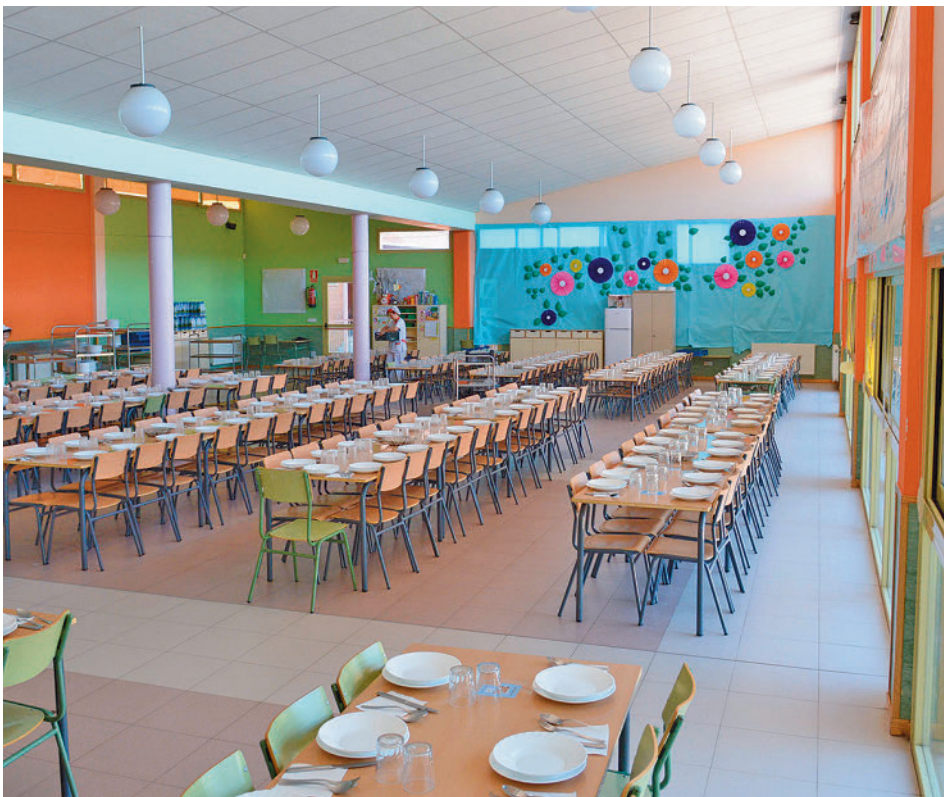
Uno de los comedores escolares de la localidad