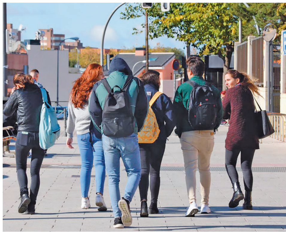
Un estudio ha recogido las sensaciones de los universitarios españoles

Preguntados por distintos aspectos de los estudios, la mayor valoración se da a la formación teórica (6,6), seguida por la facilidad de contacto con el profesorado (6,7), la formación en cultura general (6,3), la atención personal de los profesores (6,2), la oferta de becas y ayudas (6) y la forma-