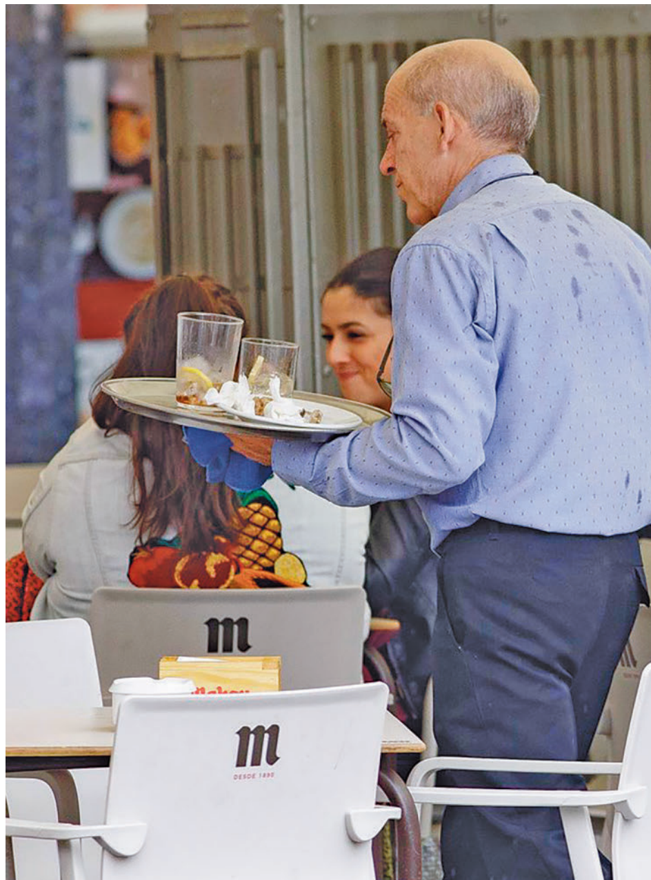
Los españoles consideran que el salario que cobran es insuficiente

bajo y no piensan cambiar de empleo. Un 19,57%, pese a estar bien, busca otro trabajo porque las condiciones que tiene no son las deseadas, un 16,49% se quiere marchar ya de su actual empleo porque no está contento y un 14,19% quiere buscarlo dentro de un