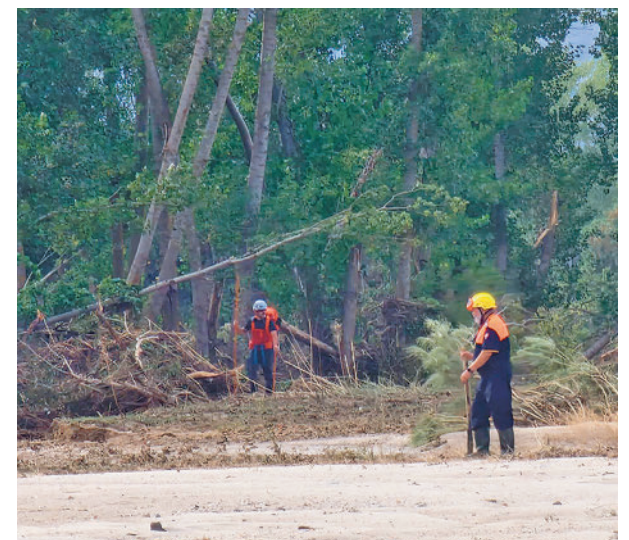
La búsqueda continúa en el río Alberche

Uno de los desaparecidos en la región es un hombre que viajaba en su coche con su mujer y sus dos hijos cuando fue arrastrado por el río Alberche en Aldea del Fresno. La mujer y la niña salieron ilesas y el niño pasó la noche encaramado a un árbol. El otro es un varón de 83 años, al que se llevó la corriente en Villamanta.