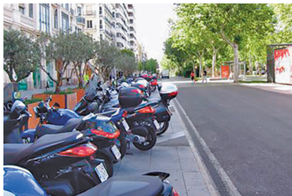
Los moteros no están satisfechos

ha hecho siempre y hay que buscar la fórmula para mejorar, volver a incentivar a los conductores y, además, que la Administración mejore las carreteras y, sobre todo, estar al pie del cañón", ha subrayado el presidente de la Asociación DIA de