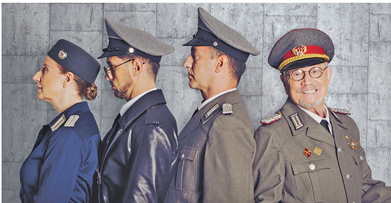
Parte del reparto de la obra

» Teatro Adolfo Marsillach. Miércoles 13, 19 horas. Gratuito.