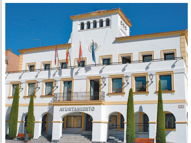
Ayuntamiento de San Sebastián de los Reyes

En concreto, la tercera edición de esta Caminata por el Autismo Alcobendas-San Sebastián de los Reyes recogerá fondos para becas de terapia y actividades para personas con TEA y sus familias. Las inscripciones de los dorsales podrán realizarse a través de la página web de Fundación ConectaTEA y los dorsales y camisetas se podrán recoger en su local de San Sebastián de los Reyes (calle José Hierro, 10, local 2) en horario de 10 a 14 y de 16 a 20 horas de lunes a viernes y en la zona de salida.