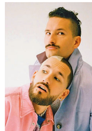
Mau y Ricky

Obtuvieron dos nominaciones a los Premios Grammy Latinos de 2017 en las categorías de Mejor Artista Nuevo y Canción del Año. Dos años después, fueron elegidos por YouTube Music como el único grupo latino en ser parte de