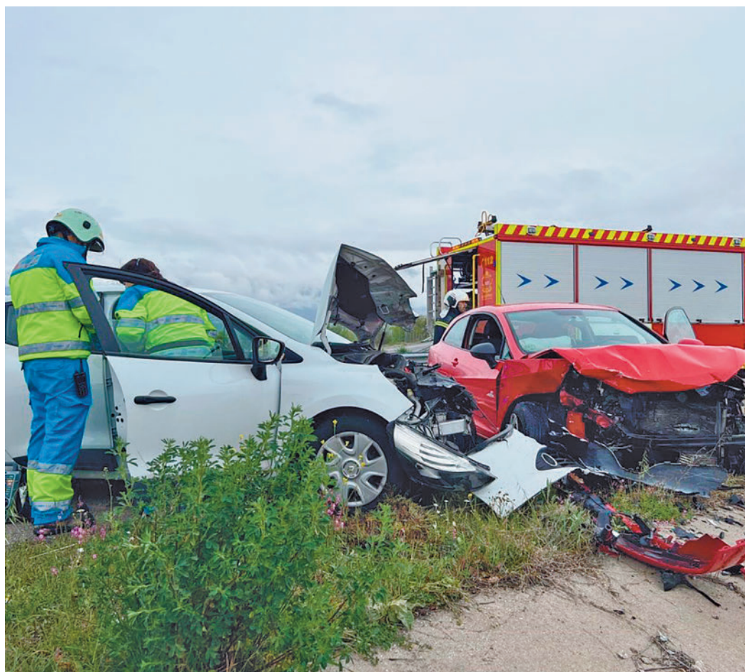
El balance de víctimas mortales ha superado al del año pasado

También han muerto 12 ciclistas, cuatro más que hace un año, y 57 motoristas, tres menos que en 2022. El perfil del motorista fallecido sigue siendo un varón con expe-