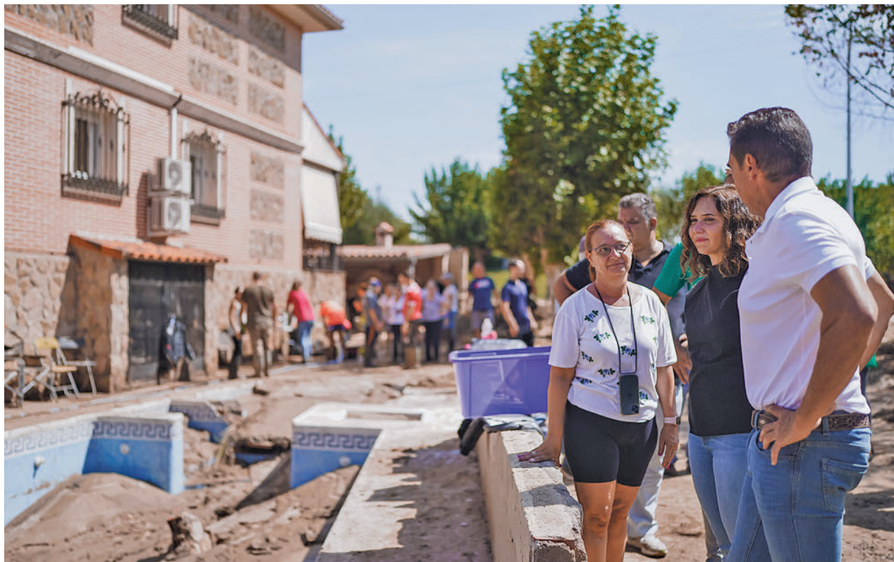
La presidenta regional, Isabel Díaz Ayuso, visitó las zonas afectadas

A la espera de lo que suceda con esta solicitud, la Comunidad de Madrid ha empezado a tomar decisiones. La primera ha sido la de habilitar una partida de 10 millones de euros con cargo al Fondo de Reserva supramunicipal del Programa de Inversión Regional (PIR) que permite paliar situaciones de emergencias. Los trabajos financiados con estos fondos serán para recuperar los servicios públicos esenciales, así como de limpieza y saneamiento en la vía pública. “En definitiva, para poner lo antes po-