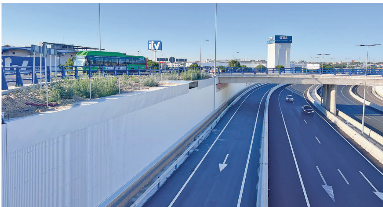
Nueva rotonda de acceso al Parque Leganés Tecnológico