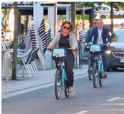
La ministra Teresa Ribera

EL PERIÓDICO GENTE EN MADRID NO SE RESPONSABILIZA NI SE IDENTIFICA CON LAS OPINIONES QUE SUS LECTORES Y COLABORADORES EXPONGAN EN SUS CARTAS Y ARTÍCULOS