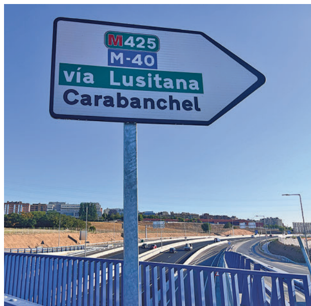
Señalización de la nueva rotonda

La obra ha implicado además la ejecución de nuevas vías de servicio que permiti-