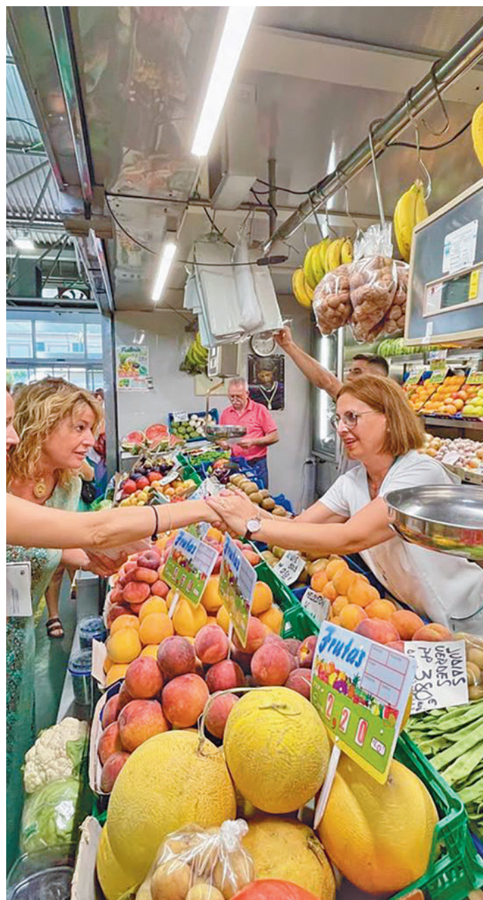
Los precios están moderando su subida