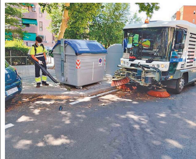
Tareas de limpieza en Zarzaquemada

gentedigital.es Toda la actualidad de Leganés, en nuestra página web