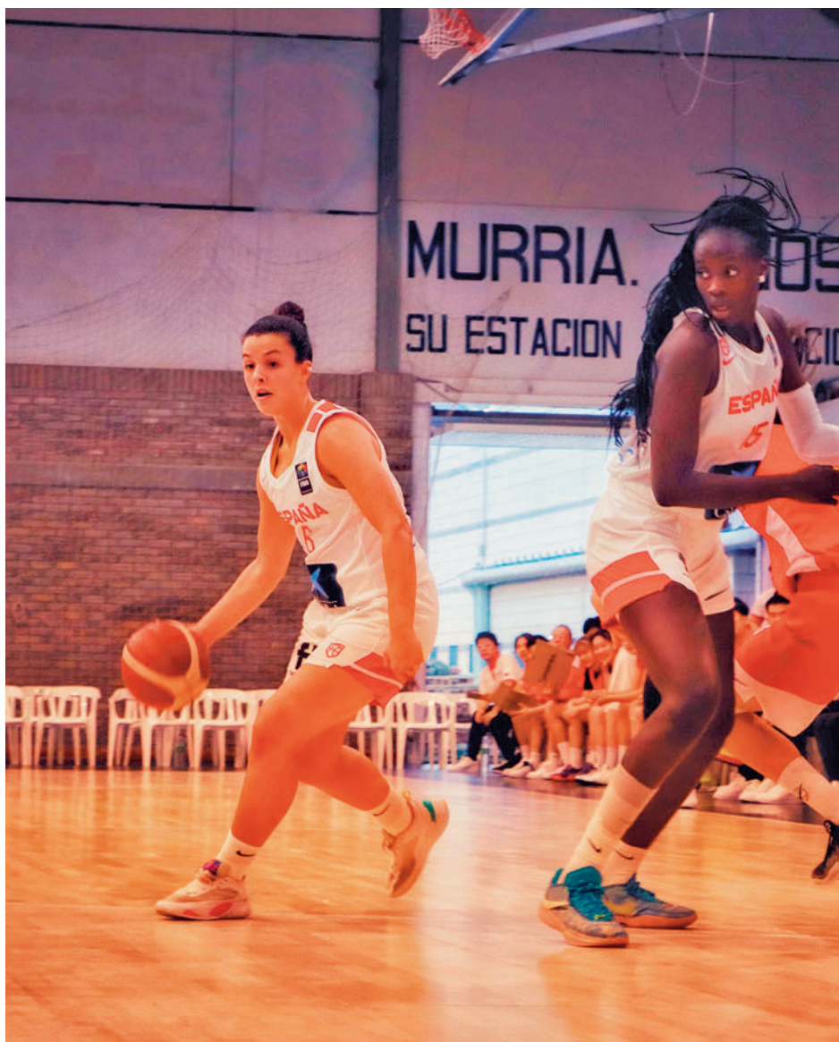
Uno de los partidos de preparación jugados en Alcañiz

Es importante destacar que los partidos de cuartos de final, que se disputarán de forma íntegra el viernes 21, tendrán como escenario el WiZink Center, recinto que también será la sede de los partidos de semifinales (sábado 22) y la gran final (domingo 23). De un modo u otro, los