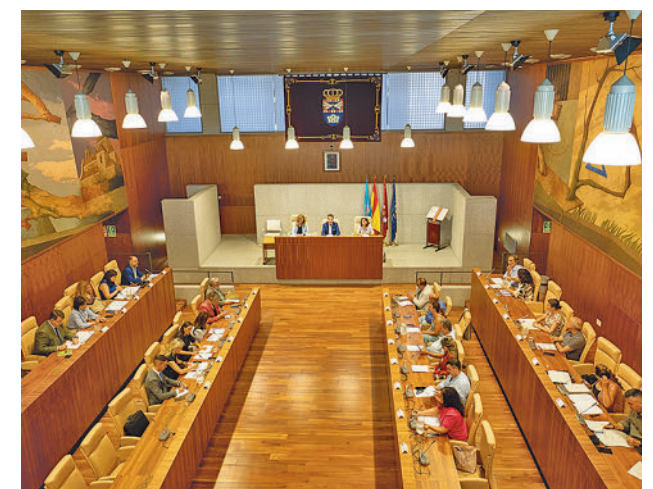
Un momento del pleno

Para desarrollar este sistema se han realizado pruebas y test con alumnado de varios centros de Educación Secundaria de la Comunidad de Madrid en el campus de la Universidad Carlos III situado en Leganés.