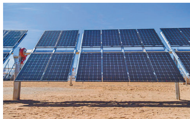
Las energías renovables piden paso

Así lo ha anunciado este miércoles en rueda de prensa en el consejo informal de ministros de Energía de la Unión Europea que se celebra en Valladolid la comisaria de