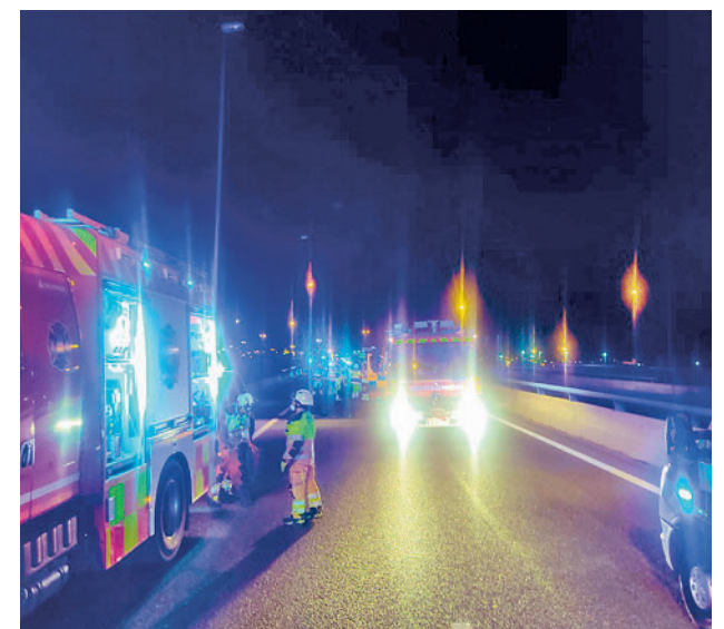
Un momento de la intervención PROTECCIÓN CIVIL ALCORCÓN

Junto al fallecido viajaban su mujer de 39 años y su hijo