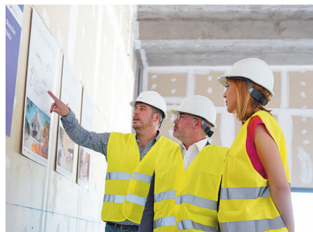
Un momento de la visita

Cada dispositivo de entrenamiento tiene una instrucción de ejercicio detallada con una ilustración, así como indicadores de funcionamiento muy sencillos. Los usuarios podrán escanear el código QR y ver el tutorial de entrenamiento en sus dispositivos móviles.