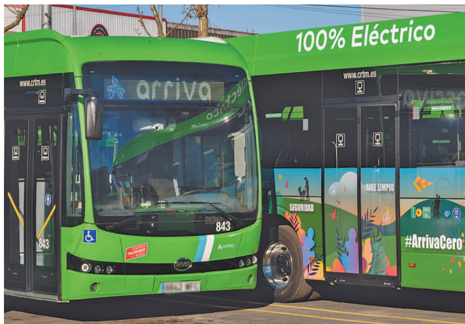
Autobuses eléctricos ARRIVA SPAIN

A finales de febrero se pusieron en servicio las primeras unidades, y su correspondiente infraestructura de carga, y tras un mes de funcionamiento se había conseguido reducir “más de 65 toneladas de CO2”, según apuntaron. Los 15 vehículos adquiridos