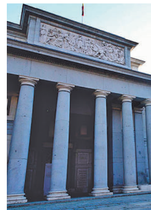
Museo del Prado

Dicha cifra registrada en julio, según señala el Museo del Prado, ha sido el número más alto desde su inicio en marzo. La pinacoteca, a modo de clausura y agradecimiento por la acogida de la acción, ha obsequiado a cada visitante con una publicación del Museo. La gran exposición dedicada a Guido Reni, re-