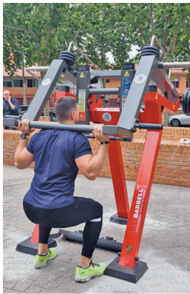
Uno de los gimnasios

Cada gimnasio al aire libre cuenta con 11 máquinas de ejercicio específicamente diseñadas para el fortalecimiento con patrones de mo-