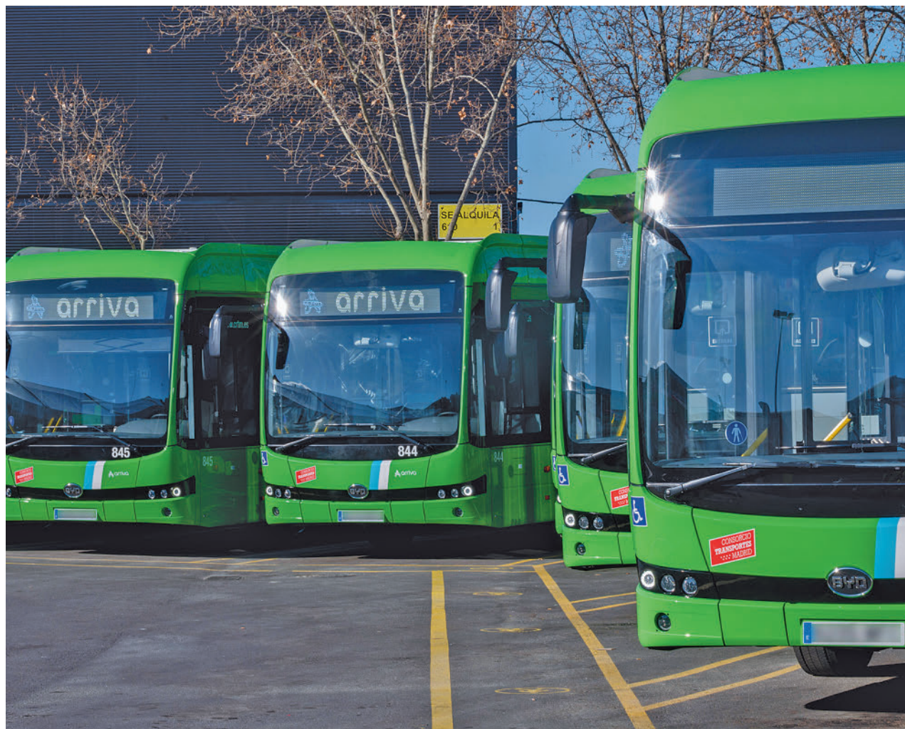
GRUPO ARRIVA SPAIN