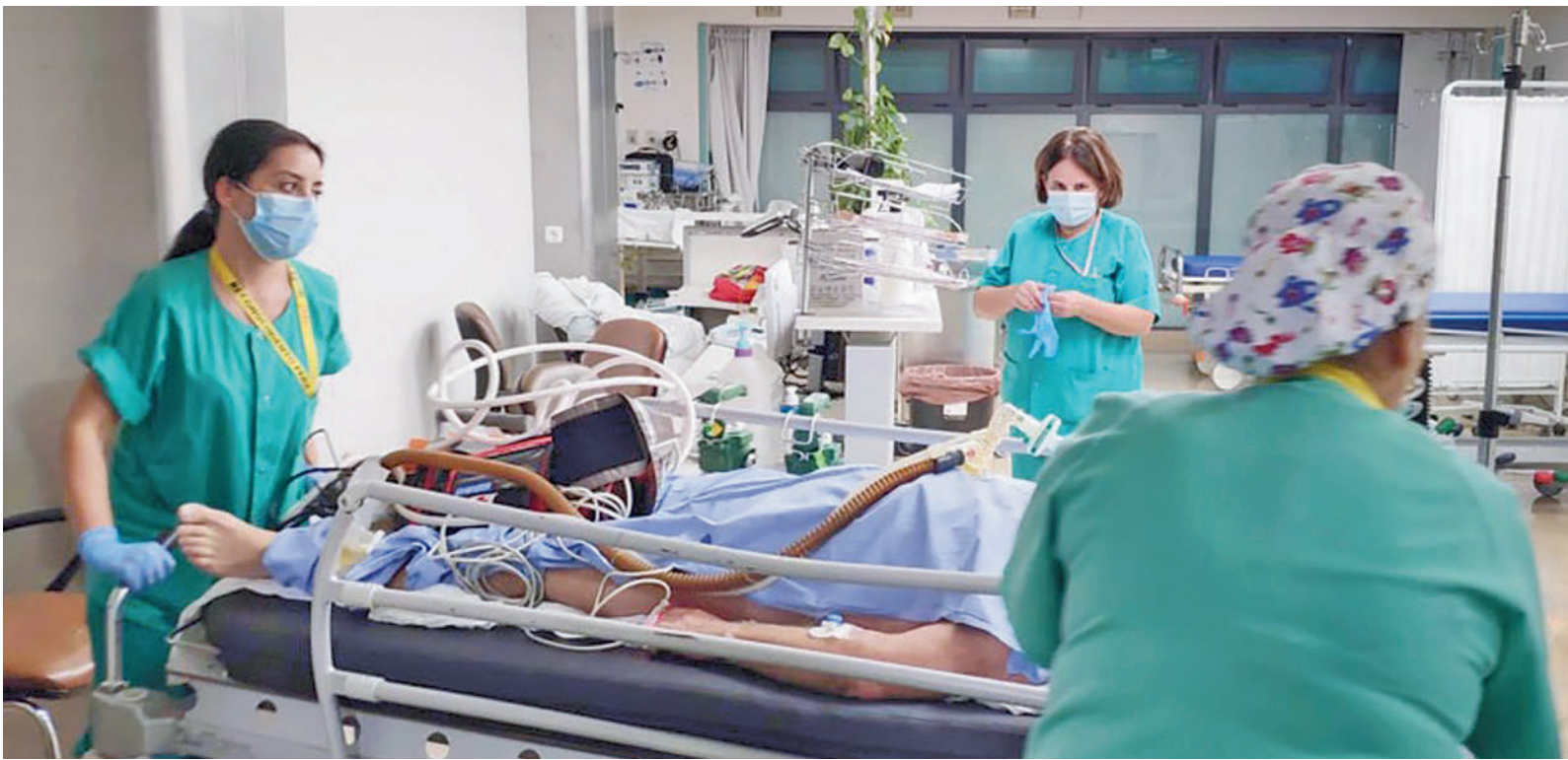
Las mascarillas dejarán de ser obligatorias en los hospitales la próxima semana