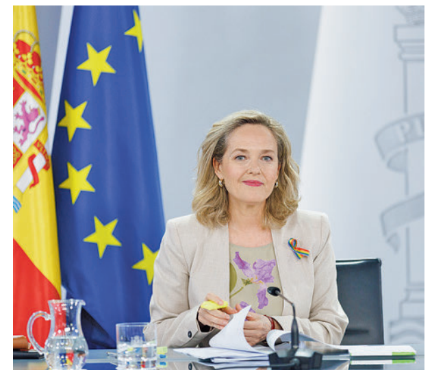
Rueda de prensa tras el Consejo de Ministros

También se ha aprobado una nueva deducción en el Impuesto sobre la Renta de las Personas Físicas (IRPF) del 15% tanto para la compra de un vehículo eléctrico como para la instalación de sistemas de recarga, con un máximo de 20.000 euros. Se trata de “consolidar las inversiones en marcha en España” para la modernización de la industria automovilística”.