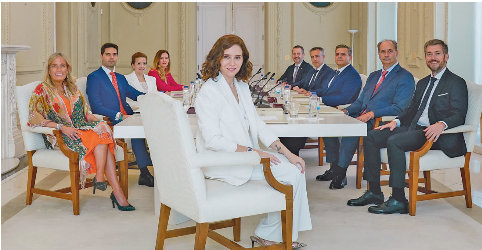
Primera reunión del nuevo Consejo de Gobierno de la Comunidad de Madrid