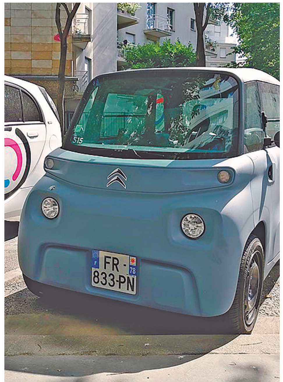
Un ejemplo del modelo Citroën Ami

Para usar un coche eléctrico de este tipo hace falta un