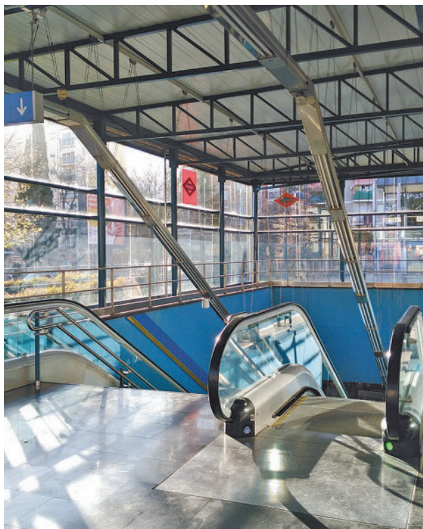
La nueva línea de autobús conectará con MetroSur

Según estas mismas fuentes, se trata de un medio de transporte público que "se convertirá en el autobús del