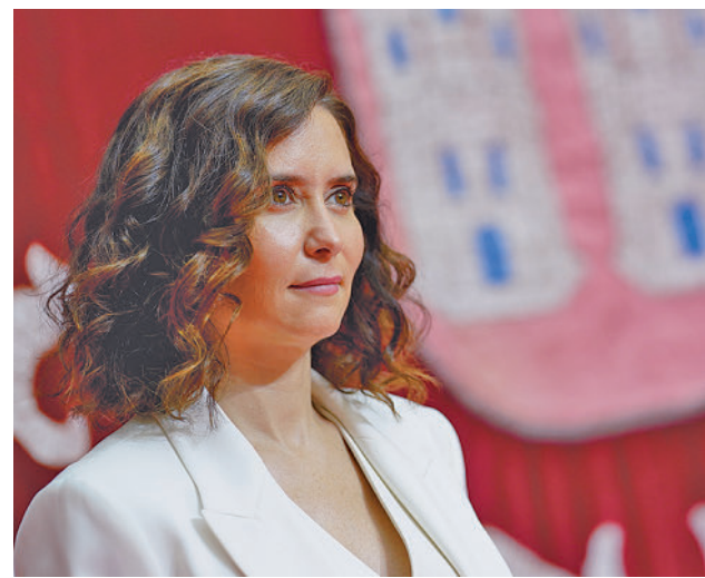
Isabel Díaz Ayuso