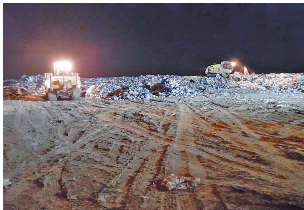
Vertedero de la Mancomunidad de Residuos del Sur

Se trata de la sustitución, adaptación y mejora de las instalaciones de tratamiento de fracción resto para convertir las instalaciones de tratamiento de la fracción orgánica de recogida selectiva, mediante proceso de compostaje y afinado.