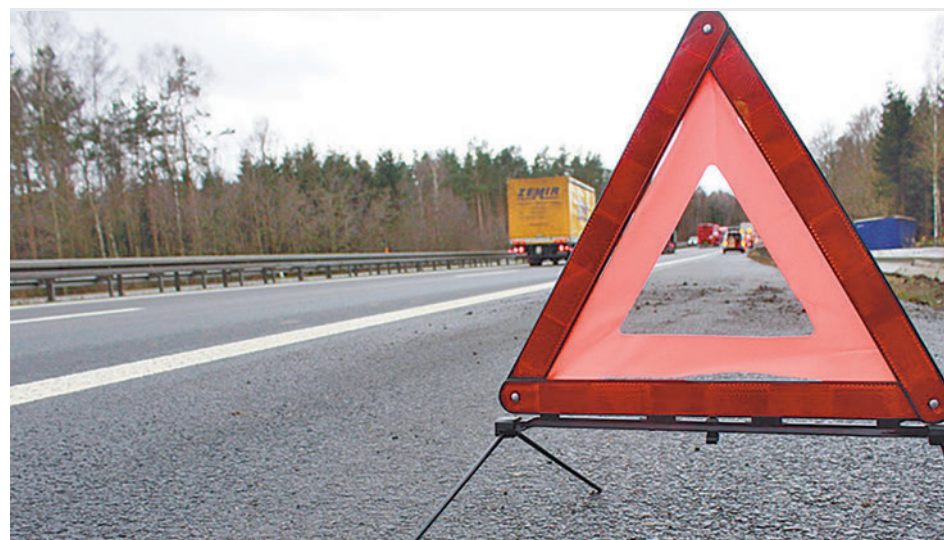
Triángulo de emergencia en una carretera

topistas y autovías este verano “para evitar atropellos”. “Para este verano estamos estudiando a ver si podemos jurídicamente hacerlo”, ha dicho Navarro, que recuerda que la alternativa a esta opción que evita salir del vehículo, la señal V16, no será obligatoria hasta el 1 de enero de 2026. En este sentido, ha explicado que, de momento, es obligatorio colocar los