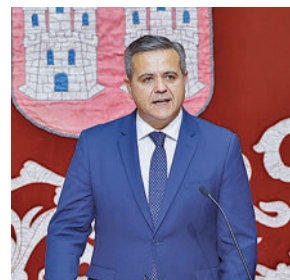
Jorge Rodrigo TRANSPORTES, VIVIENDAS E INFRAESTRUCTURAS