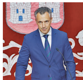
Carlos Novillo MEDIO AMBIENTE, ORDENACIÓN TERRITORIO E INTERIOR