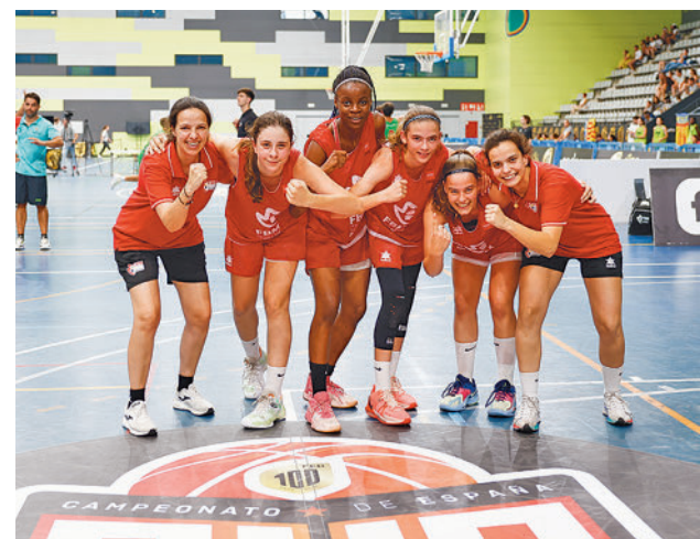
Imagen de las campeonas

Por su parte, el combinado masculino U13 firmó un notable quinto puesto.