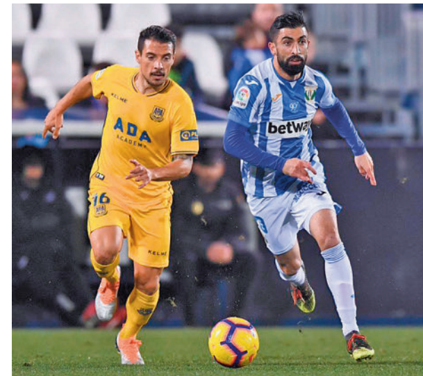
Un derbi de temporadas anteriores

El encuentro de vuelta ha quedado fijado para la jornada 27, concretamente el fin de semana del 18 de febrero de 2024.