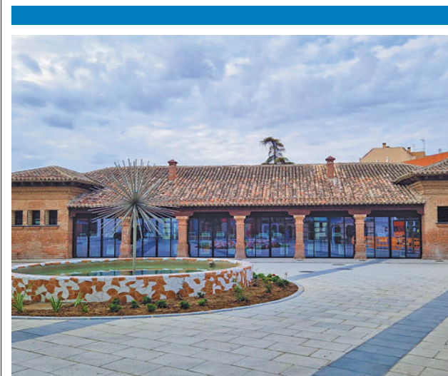
Nuevo aspecto de la plaza de la Guardia Civil

En concreto, este centro educativo ha visto reconocido el trabajo de los alumnos de 1º de Educación Primaria por su trabajo 'Aprendemos (juntos) a cruzar la calle', que une la inclusión con la educación vial para que todos los niños sean capaces de cruzar la calle con seguridad. Esta edición ha recibido 187 cortometrajes realizados por 922 alumnos, un trabajo que han realizado junto a sus profesores en las aulas.