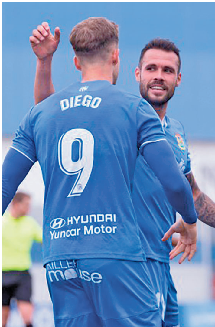
El Fuenlabrada ya conoce a sus rivales para este curso

De este modo, el Fuenlabrada y el Rayo Majadahonda continúan en el Grupo 1, junto a Arenteiro, Lugo, Deportivo, Celta B, Ponferradina, Cultural Leonesa, Unionistas, Real Sociedad B, Real Unión de Irún, Sestao River, SD Logroñés, Tarazona, Teruel, Osasuna B, Nástic de Ta-