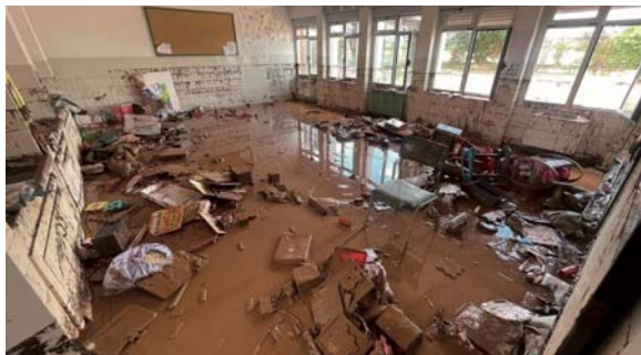
La escuela de Huércanos, con una lengua de barro.

Los servicios de emergencia localizaron ilesos a dos vecinos, de Sotés y Huércanos, que se encontraban en paradero desconocido en el momento en que