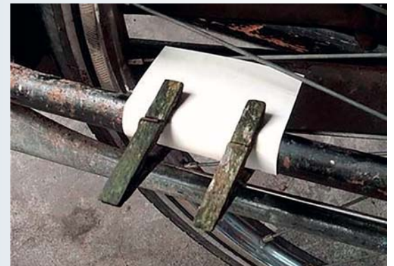
Artilugio para la bicicleta.

van a disfrutar de muchas cosas que disfrutamos nosotros cuando éramos niños y estábamos todo el día en la calle, aunque soy consciente de que cada tiempo tiene su forma de vivir y de disfrutar. Salías del colegio, ibas corriendo a casa a por el bocadillo de la merienda y te bajabas otra vez corriendo a la calle a jugar con tus amigos del barrio. Como no había muchas cosas para jugar, con cualquiera nos entreteníamos. Recuerdo unos aviones que elaborábamos de cartón, con dos pinzas en sus alas para simular los motores, y que atados a una cuerda les hacíamos volar a nuestro alrededor. O ponerle un cartón con dos pinzas a los radios de una bicicleta para que hiciera ruido como si fuese una moto. En fin, historias del siglo pasado.