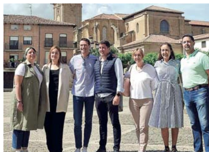
PP con Riano de primer edil, y Por La Rioja, unidos en Santo Domingo.