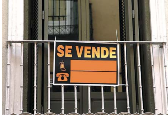
Una vivienda en venta.

En el ámbito nacional, la cantidad de ahorros que hay que aportar para convertirse en propietario de una vivienda creció un 21% en los últimos cuatro años. El importe medio de una entrada para un inmueble de dos dormitorios en España pasó de los 34.906 euros de mayo de 2019 a situarse en 42.293 euros en mayo de 2023.