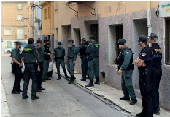
La redada de Calahorra.