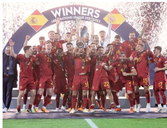
Jordi Alba levanta el título de la Nations League.