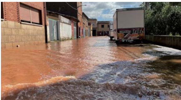
Uruñuela, totalmente anegada.

más arreciaba la lluvia. Se registraron más de 120 incidencias, con viviendas y cultivos anegados (en Tricio, Alesón y las dos Arenzanas, de Arriba y de Abajo, se estiman daños del 80% en los viñedos), las crecidas del Yalde y el Alhama, campings desalojados y colegios cerrados, como los de Huércanos y Uruñuela.