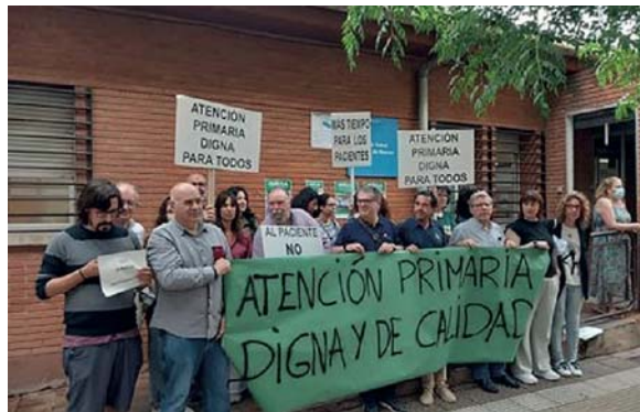
Concentración de médicos riojanos en huelga.

La Rioja vivió la primera huelga de médicos y pediatras de Atención Primaria, convocada únicamente por el sindicato CSIF, aunque con un lema que comparten el resto de representantes de estos profesionales: reclamar "un trabajo digno y de calidad". CSIF sorprendió hace semanas al planear este paro, y afirmó que no se celebraría hasta después de las elecciones autonómicas para no darle un cariz político. Sin embargo, y curiosamente, protestó frente a una Administración, socialista, que cesará en breve y será reemplazada por dirigentes populares. El Ejecutivo de Concha Andreu acusó a CSIF de hacer "clara ostentación de sus preferencias políticas y, en su dejación, no programar servicios mínimos".