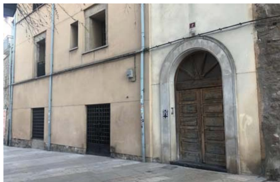
La Puerta Gótica, casa okupada en Logroño que pretende fomentar la cultura.

Aunque la estadística proporcionada no distingue entre allanamientos de morada (cuando se ocupa una vivienda habitual, ya sea primera o segunda residencia) y usurpaciones (inmuebles propiedad de bancos o casas