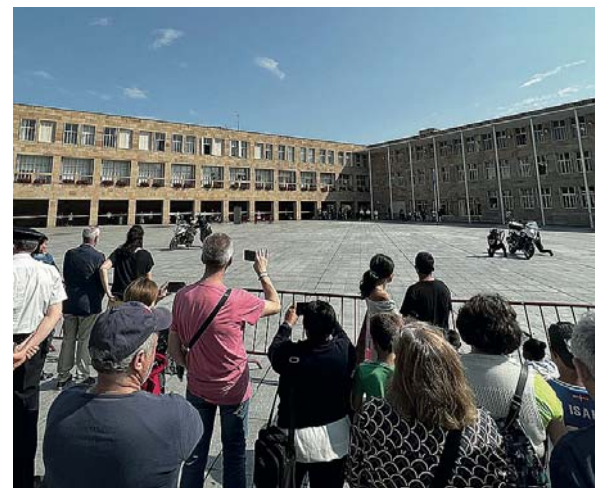
La exhibición en la Plaza del Ayuntamiento de Logroño.

demonstraciones, siendo la protagonista la Unidad de Desactivación de Explosivos TEDAX-NRBQ (Nuclear, Radiológica, Bacteriológica y Química). También participaron la Unidad de Prevención y Reacción, Guías Caninos, el Servicio de Medios Aéreos (un helicóptero y drones) y agentes del Grupo de Operativos Especiales de Seguridad.