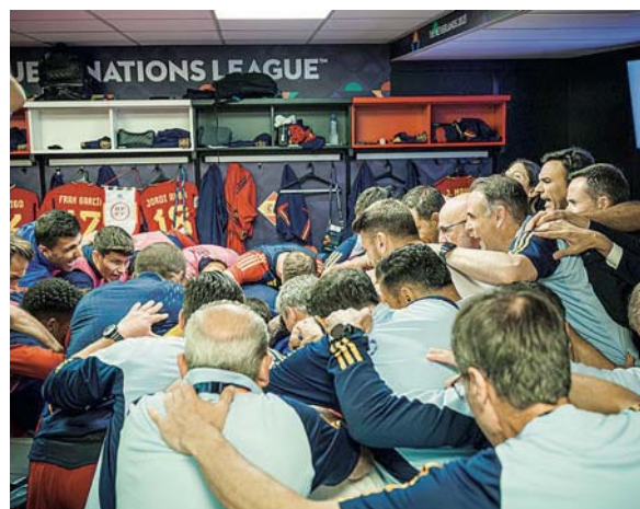
Piña de futbolistas y cuerpo técnico en el vestuario.