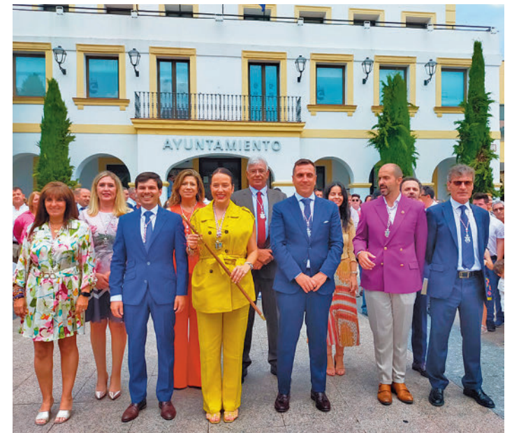
La alcaldesa de Sanse, junto a su Ejecutivo

Una vez acabada la votación, la nueva alcaldesa puso en valor que "San Sebastián de los Reyes se encuentra en-