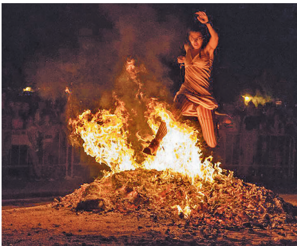
Un joven saltando la hoguera en años anteriores

NO FALTARÁN OTROS EVENTOS, COMO LA QUEIMADA O LOS CONJUROS