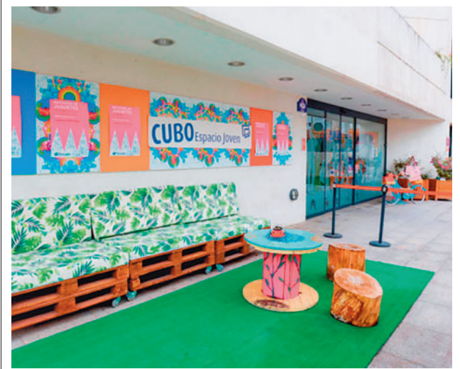
Algunas de las propuestas de anteriores ediciones

La actualidad de los municipios del Noroeste, en nuestra web