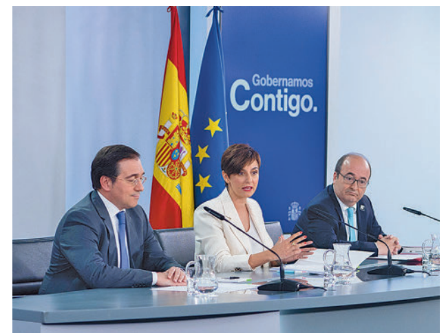
Rueda de prensa del Consejo de Ministros

lo que ha ocurrido con la crisis motivada por la guerra de Ucrania es un episodio que se podrá repetir en el futuro, ya que el peso marginal de los combustibles fósiles va a ser decreciente pero se van a producir fenómenos geopolíticos que provocarán estas crisis de precios, por lo que está nueva medida, uno de los compromisos también del Gobierno con la Comisión Europea cuando se recibió el visto bueno a la aplicación de la denominada 'excepción ibérica' para España y Portugal, tiene todo el sentido.