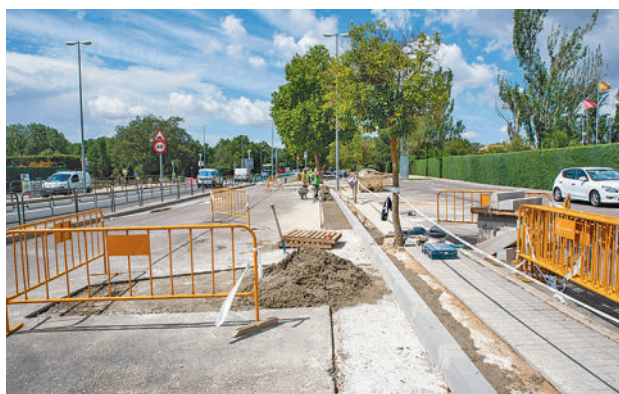
Estado de las obras

nicipal Ángel Nieto. El objetivo del Gobierno local con la realización de estos trabajos que los autobuses urbanos e interurbanos que pasan por allí puedan acceder al centro deportivo y parar sin obstaculizar el tráfico rodado en la vía. Además, se están ampliando las plazas de aparca-