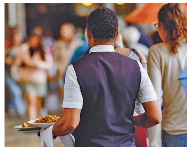
Cada vez hay menos camareros en España

En concreto, del empleo generado en el primero de los sectores, son los alojamientos turísticos y otros de corta estancia los que experimentan la mayor ganancia, mientras que el personal de campings y otros alojamientos pierde unidades. En la restauración, son los establecimientos de bebidas y los restaurantes los que pierden empleo, mientras el servicio de catering y otros servicios de comidas incrementa su fuer-