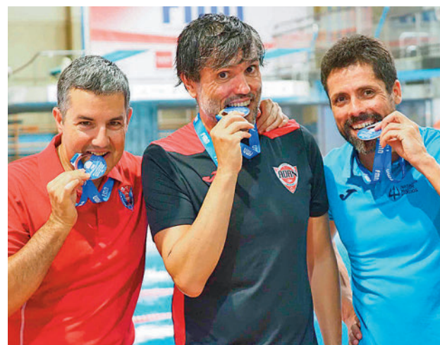
Las pruebas se celebraron en la M-86