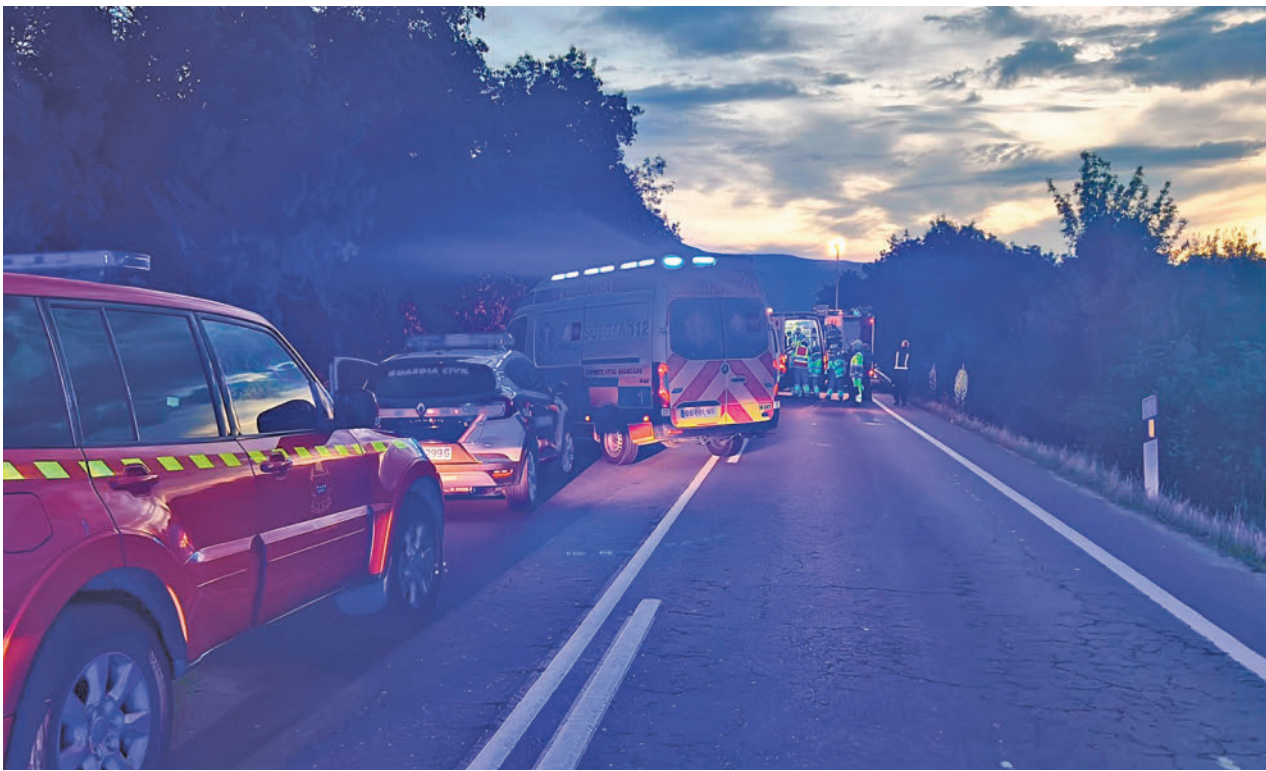
Los servicios de Emergencias acudieron al punto en el que se produjo el accidente