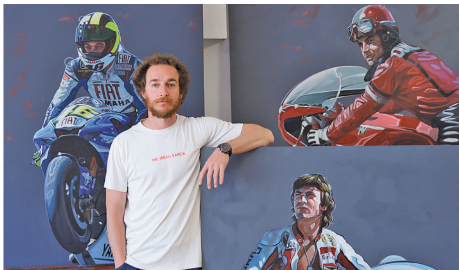
Sus obras cuentan con una gran comunidad de seguidores en Instagram: @manucampart

Así, "de una forma modesta", Campa comenzó a abrirse paso a través