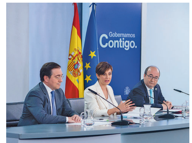
Rueda de prensa del Consejo de Ministros

lo que ha ocurrido con la crisis motivada por la guerra de Ucrania es un episodio que se podrá repetir en el futuro, ya que el peso marginal de los combustibles fósiles va a ser decreciente pero se van a producir fenómenos geopolíticos que provocarán estas crisis de precios, por lo que está nueva medida, uno de los compromisos también del Gobierno con la Comisión Europea cuando se recibió el visto bueno a la aplicación de la denominada 'excepción ibérica' para España y Portugal, tiene todo el sentido.