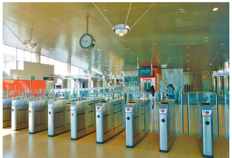
Entrada de la actual estación de Cercanías de Parla

La estación dispondrá de dos andenes de 210 metros de