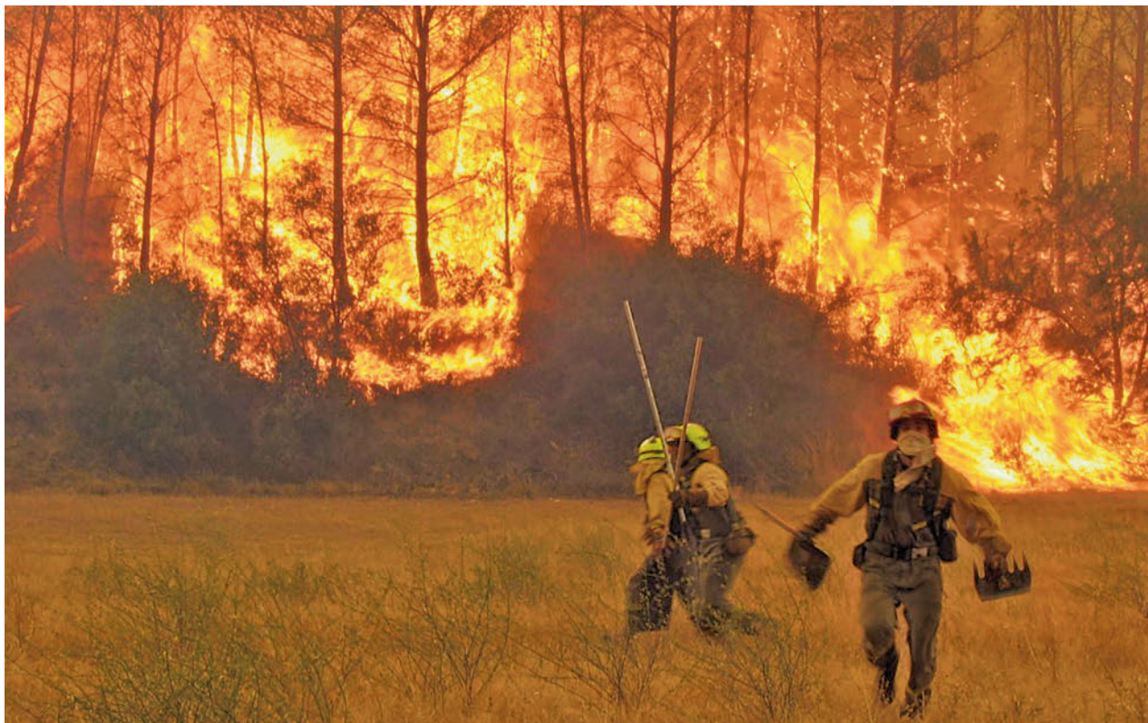
Los incendios forestales se están cebando con España en la primera mitad del año