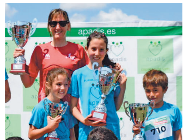
Imagen del podio instalado en Dehesa Boyal

El Parque Forestal Fuente Lucha Nodo de Hábitats de Alcobendas transformará el antiguo vertedero de residuos de El Goloso en un gran pulmón verde de 227.780 metros cuadrados. En él se plantarán más de 3.000 árboles y se fomentará la biodiversidad en un proyecto que va a contar con una inversión que ronda los doce millones de euros. El Ayuntamiento ha informado que Prointec contará con el estudio de arquitectura Burgos&Garrido, autor del proyecto Madrid Río.