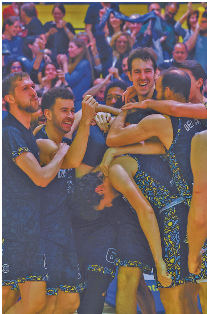
Celebración del equipo masculino en el Circular