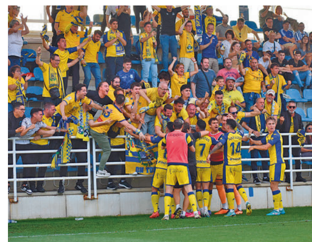
Celebración con los aficionados desplazados a San Sebastián

Por el otro lado de este cuadro caminan Deportivo y Castellón, con ventaja momentánea para los gallegos por 1-0.