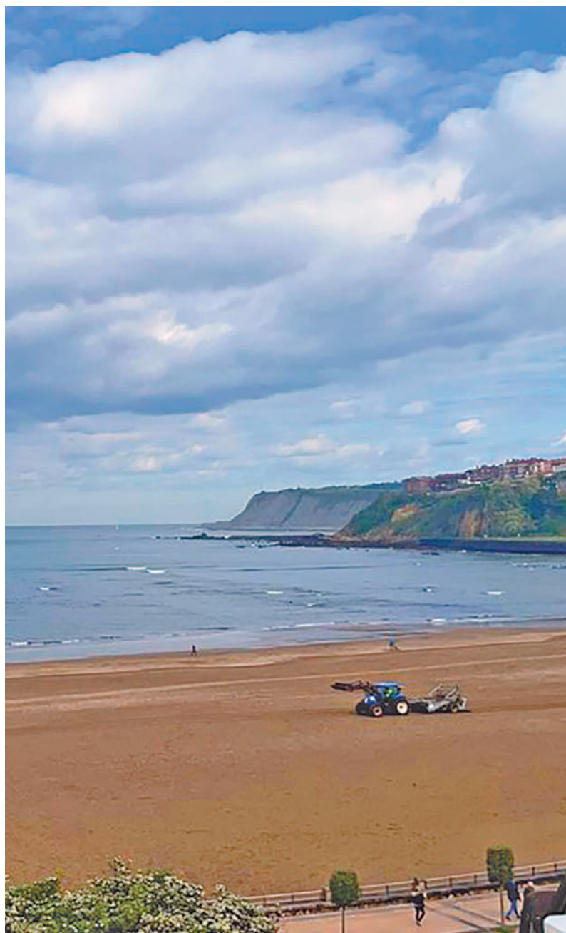
El agua sigue subiendo en las costas españolas

Por último, el científico ha añadido que “este estudio pone de relieve la necesidad de mantener sistemas de vigilancia y monitorización de nuestros mares para conocer exactamente los cambios que se están produciendo en ellos en tiempo real”.