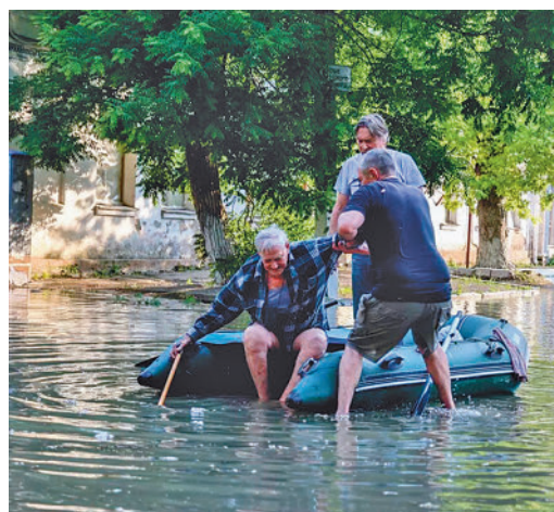
Desalojos en la zona de Jersón

EL PERIÓDICO GENTE NO SE RESPONSABILIZA NI SE IDENTIFICA CON LAS OPINIONES QUE SUS LECTORES Y COLABORADORES EXPONGAN EN SUS CARTAS Y ARTÍCULOS