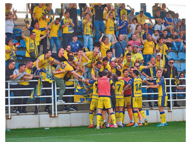
Celebración con los aficionados desplazados a San Sebastián

Por el otro lado de este cuadro caminan Deportivo y Castellón, con ventaja momentánea para los gallegos por 1-0.