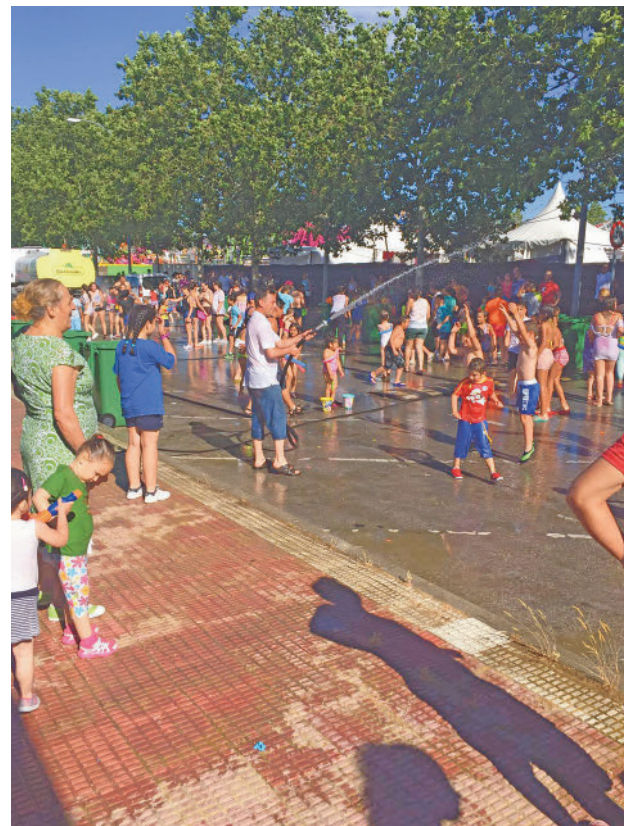
Gran Fiesta del Agua en el recinto ferial

El viernes 16 arrancará el grueso del programa a las 22 horas en el recinto ferial de la calle Picasso con el pregón a cargo de la histórica banda local de rock and roll Ten-