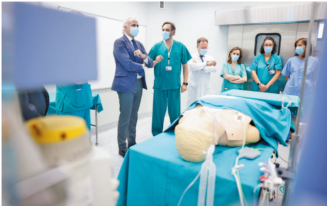
Visita del consejero de Sanidad al Puerta de Hierro de Majadahonda

Una vez que la familia del paciente fallecido da su per-