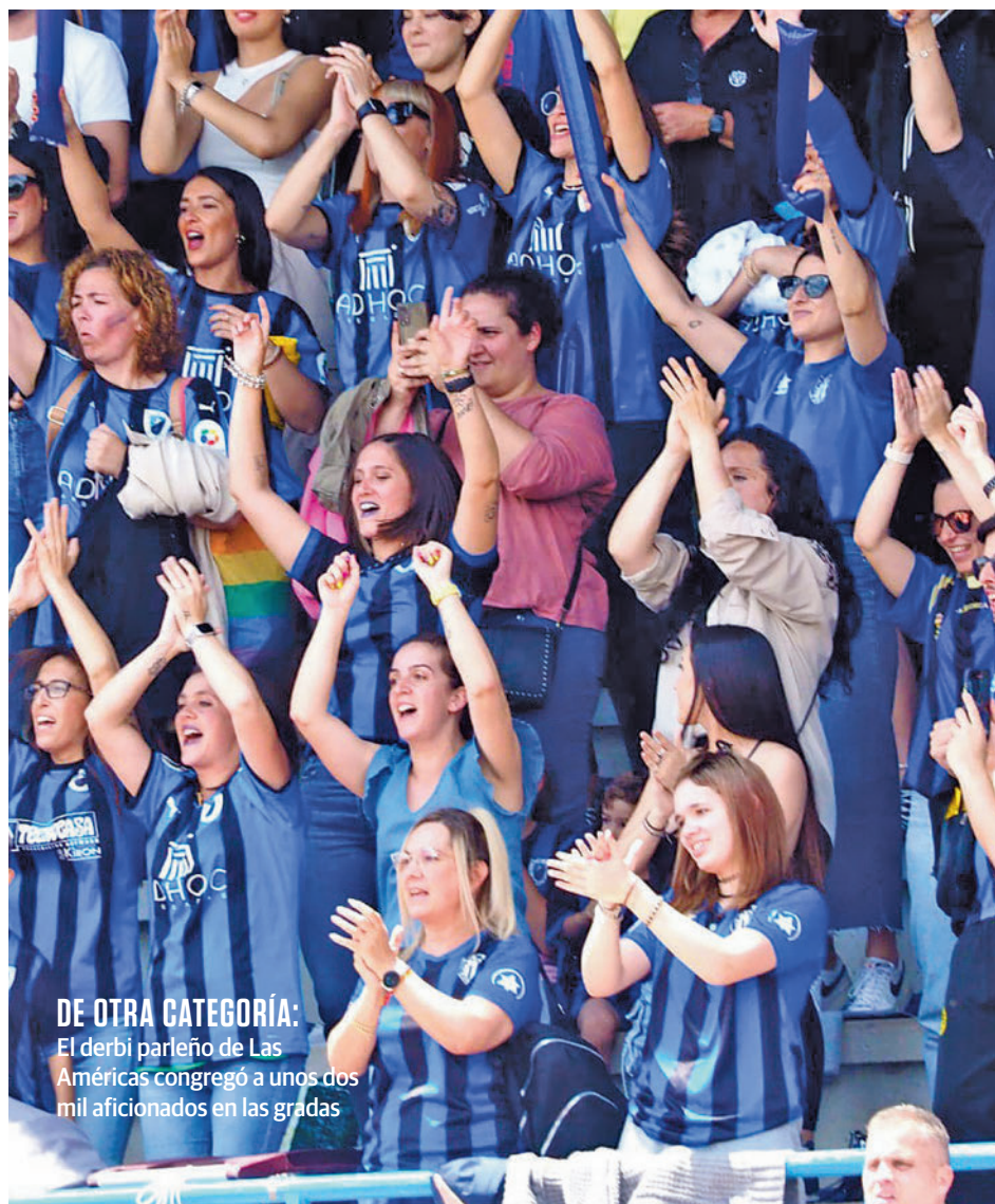
DE OTRA CATEGORÍA: El derbi parleño de Las Américas congregó a unos dos mil aficionados en las gradas

Esa emoción del Grupo 2 contrasta con la tranquilidad reinante en el Grupo 1, donde ya está todo decidido a falta de una jornada para el final. El Tres Cantos rubricó ante sus aficionados el título de campeón al imponerse con