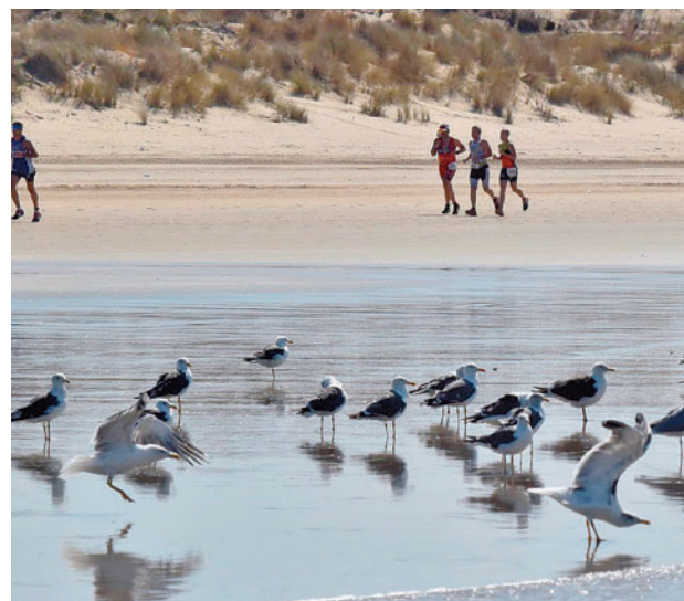
Coto de Doñana

La delegación de la Comisión de Medio Ambiente, Protección de la Naturaleza, Seguridad Nuclear y Protección del Consumidor del Bundestag (Parlamento) alemán, destaca que las relaciones hispano-alemanas se basan en