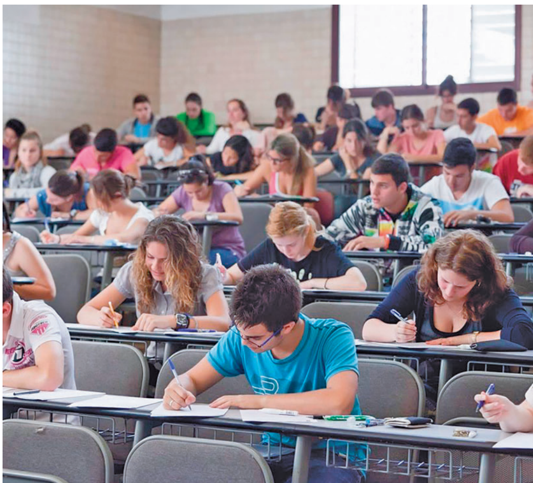
Miles de jóvenes realizan la EvAU en estos días

"El incremento de la automatización cambiará el ecosistema laboral, pero el saldo neto de creación de empleos será positivo, con nuevas categorías que demandan competencias cognitivas superiores, competencias sociales y emocionales y competencias tecnológicas", se señala en el informe. En el caso de los estudiantes de 16 a 18 años, muchos de ellos participantes de la EvAU en