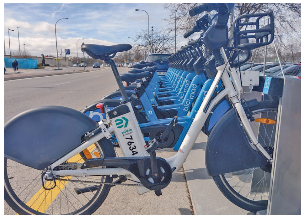
Uno de los puntos de anclaje de la red municipal de alquiler de bicicletas

La gratuidad del servicio estará vigente hasta el 31 de julio. El nuevo bicimad ya está presente en los 21 distritos con 4.397 bicicletas nuevas en calle y 381 bases. La previsión del Consistorio es que seguirá creciendo este verano has-