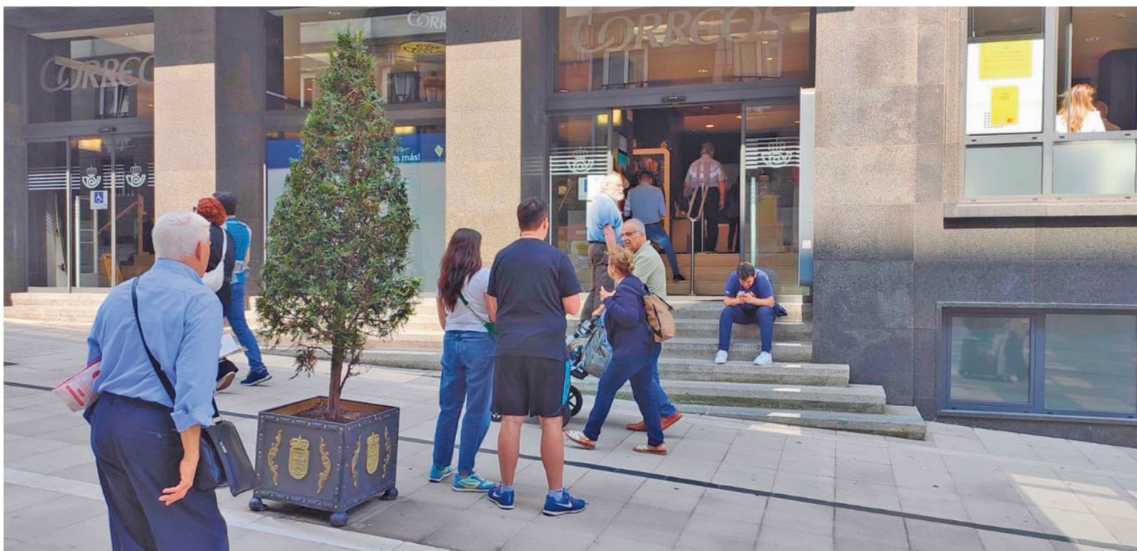
Las oficinas de Correos se han llenado en los últimos días