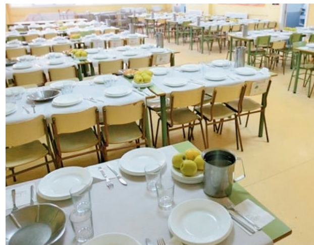
Comedor escolar en la Comunidad de Madrid

Para el resto de familias, el precio será de 5,50 euros, una subida que el Gobierno regional ha justificado por la inflación que tienen que soportar las empresas. Las que pueden acceder a precios reducidos (alrededor del 40%) seguirán pagando 1 o 3 euros según el tipo de