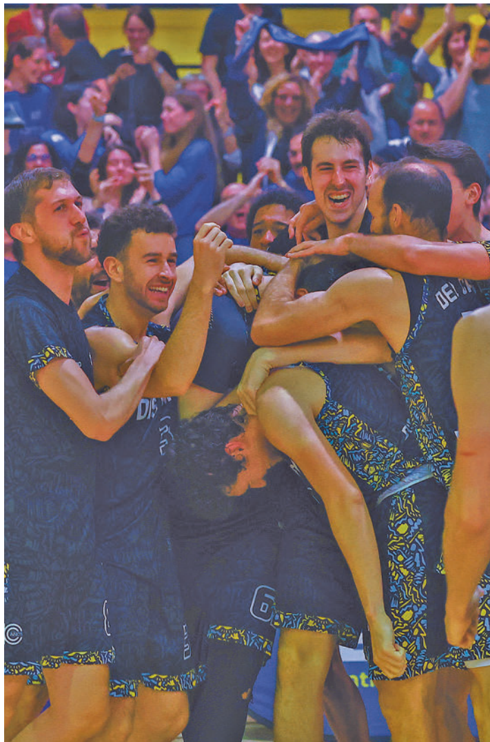
Celebración del equipo masculino en el Circular