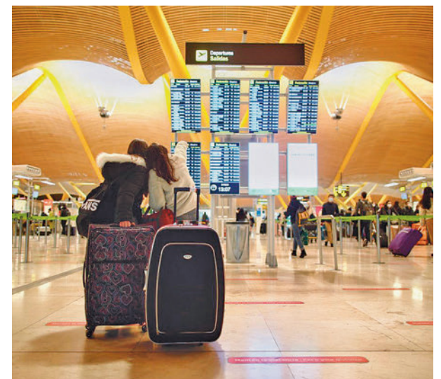
Tener un viaje no exime de acudir a la mesa

Lo que no libra de acudir a la mesa automáticamente es tener un viaje o una reserva hotelera en las fechas elegidas. En ese caso (así como en los anteriores supuestos) habrá que acudir a la Junta Electoral en los siete días siguientes a la recepción de la notificación y presentar la documentación y los responsables determinarán si se exime o no.