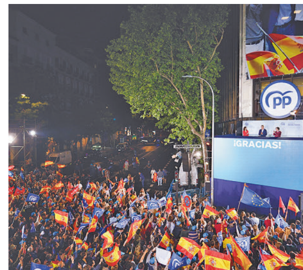
Celebración del PP en la calle Génova

En la parte izquierda del tablero Más Madrid empeoró con Rita Maestre en el lugar de Carmena, pero liderará la oposición por delante de PSOE y de Vox. Fuera del pleno se quedarán Podemos, que no llegó al 5%, y Ciudadanos, que ha pasado de tener a Begoña Villacís como vicealcaldesa a desaparecer de Cibeles.