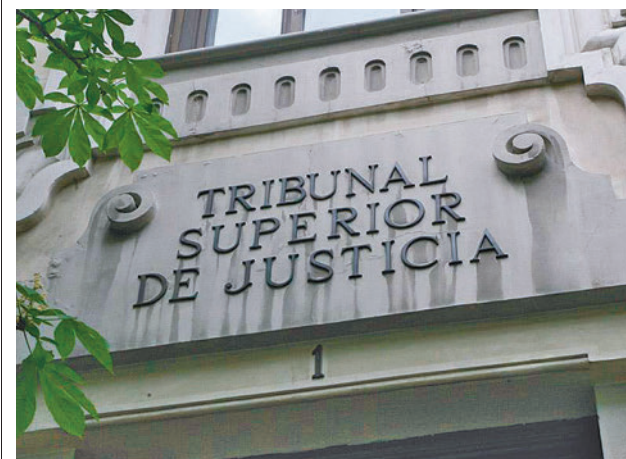
Sede Tribunal Superior de Justicia de Madrid

Poseen, además, una serie de mejoras de carácter tecnológico que hacen que el patinete pare de forma automática si identifica que van dos personas montadas, y en aquellas zonas en las que haya una limitación inferior a 25 Km/h, reducirá de forma inmediata la velocidad, e incluso en aquellas que esté prohibido el uso de los mismo detendrá el servicio. El contrato es de dos años, prorrogables dos años más, y recoge el compromiso de desplegar un total de 300 patinetes eléctricos y 100 bicicletas.