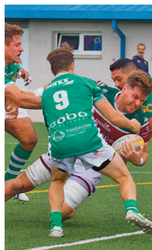
Imagen de la final