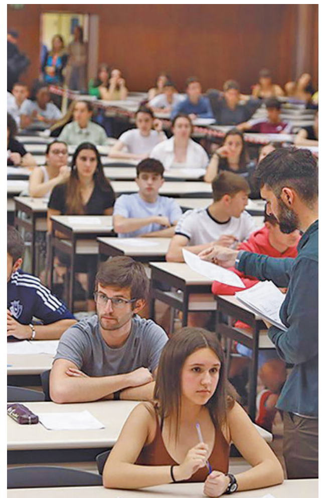
Pasada edición de la EvAU

distinta de la que hubieran cursado como materia del bloque de asignaturas troncales. La calificación obtenida en dicha prueba podrá ser tenida en cuenta por las universidades en sus procesos de admisión.