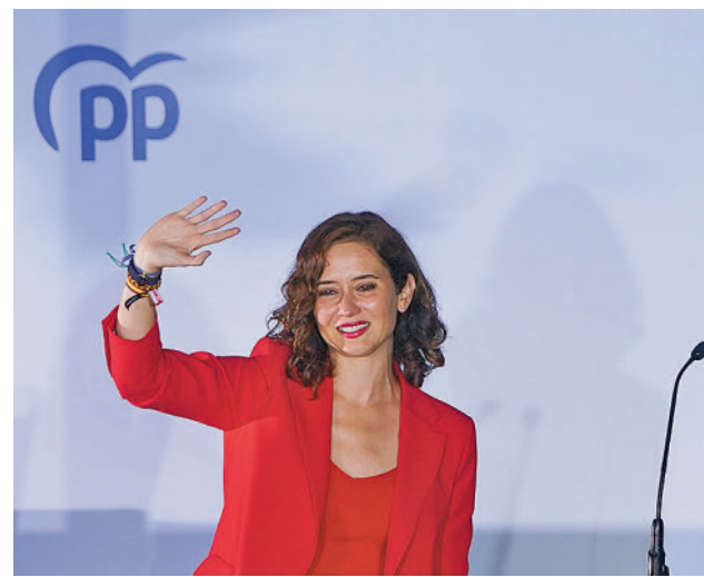
Isabel Díaz Ayuso celebra su victoria en Génova