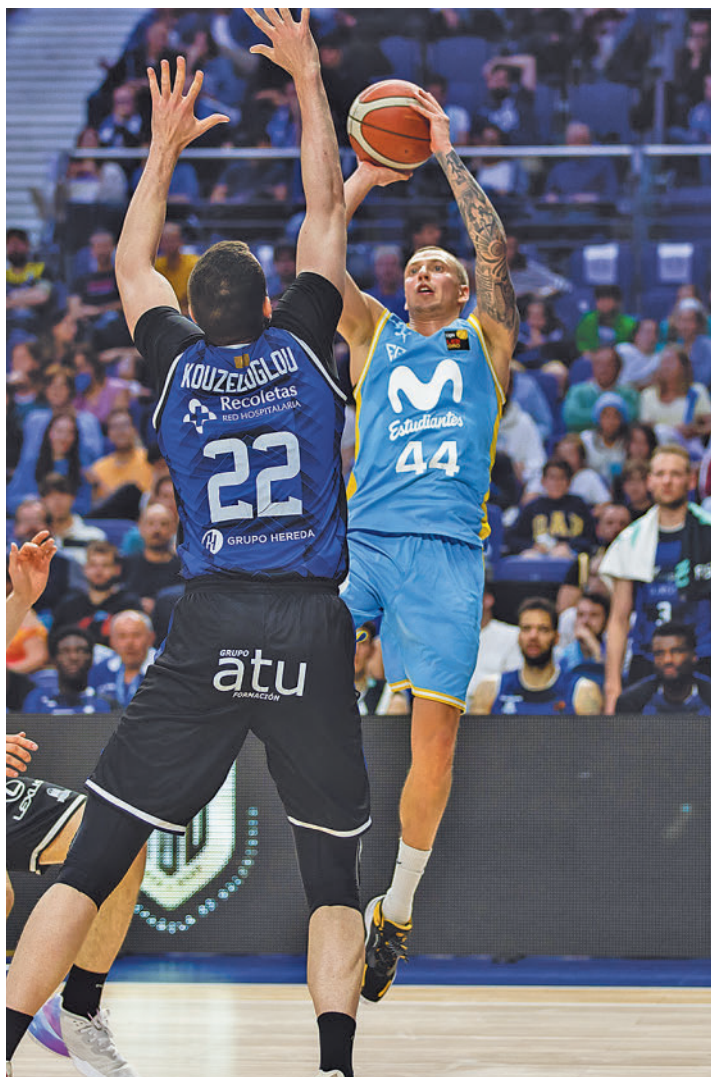
Hereda San Pablo Burgos ganó los dos primeros partidos

La empresa se antoja complicada pero no imposible. Para ello, el equipo que dirige Alberto Lorenzo debe ir partido a partido. No queda otra. La serie sólo seguirá abierta en el caso de que los colegiales se lleven el tercer asalto que tendrá lugar este mismo viernes 2 (20:30 ho-