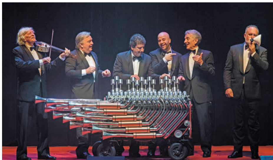
Los seis integrantes actuales de Les Luthiers

ENTREVISTA DE FRANCISCO QUIRÓS SORIANO (@FranciscoQuiros)