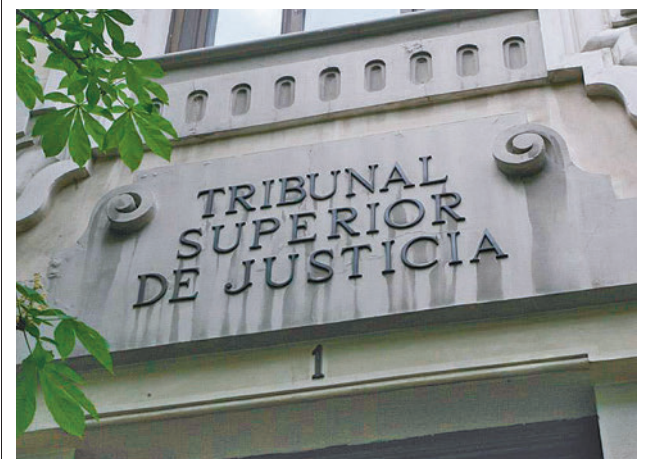
Sede Tribunal Superior de Justicia de Madrid

Poseen, además, una serie de mejoras de carácter tecnológico que hacen que el patinete pare de forma automática si identifica que van dos personas montadas, y en aquellas zonas en las que haya una limitación inferior a 25 Km/h, reducirá de forma inmediata la velocidad, e incluso en aquellas que esté prohibido el uso de los mismo detendrá el servicio. El contrato es de dos años, prorrogables dos años más, y recoge el compromiso de desplegar un total de 300 patinetes eléctricos y 100 bicicletas.