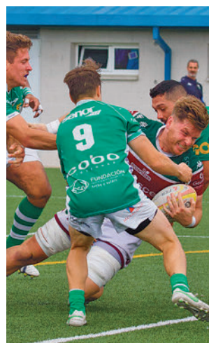
Imagen de la final