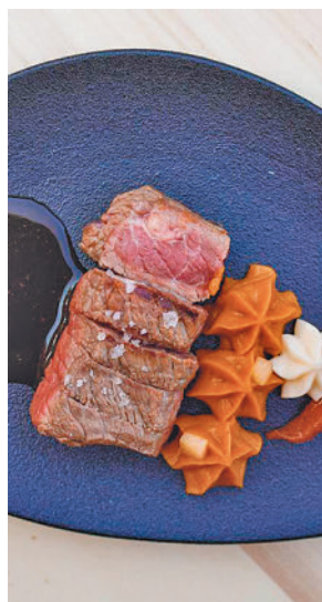
Plato elaborado con res

Instituto Madrileño de Investigación y Desarrollo Rural, Agrario y Alimentario (IMI-DRA), con el apoyo de la Asociación de Cocineros y Reposteros de Madrid (ACYRE), y consiste en la elaboración de diferentes