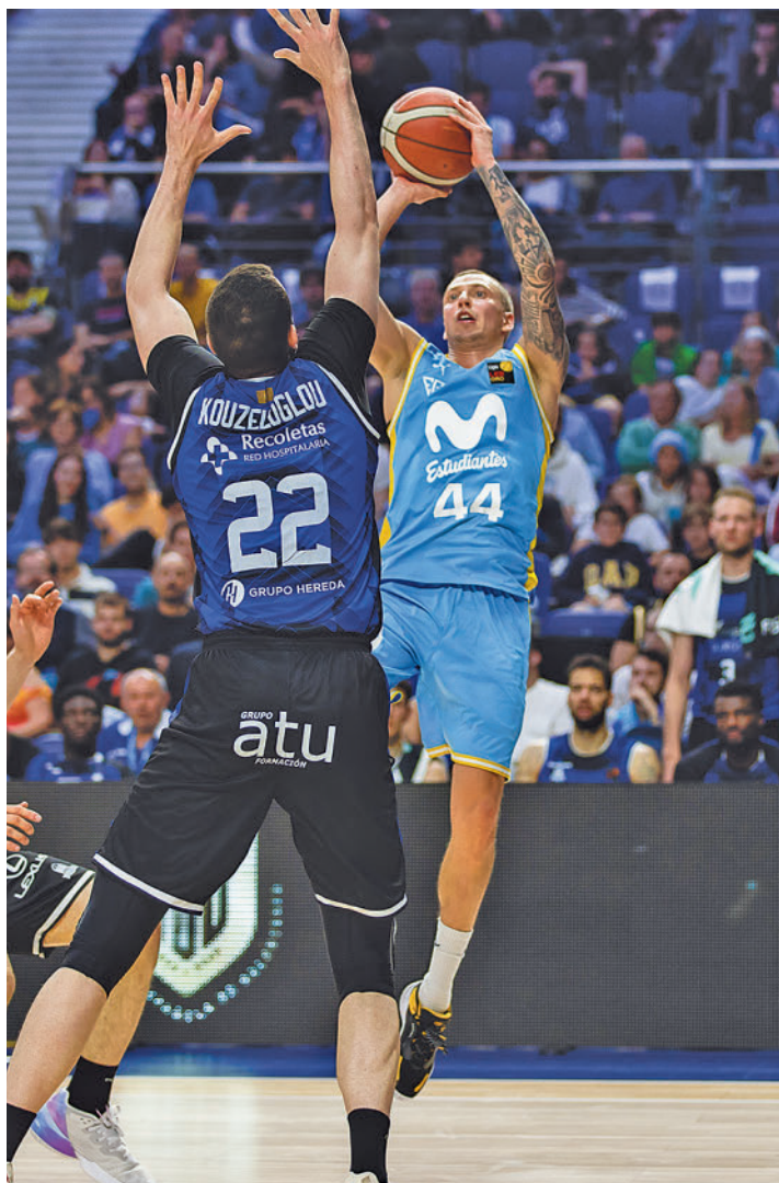
Hereda San Pablo Burgos ganó los dos primeros partidos