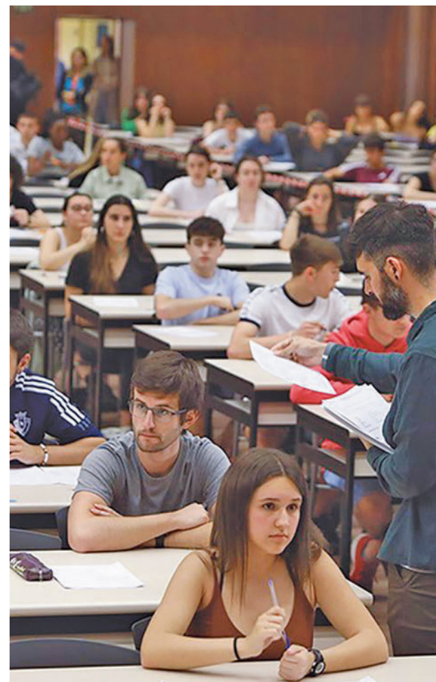
Pasada edición de la EvAU

distinta de la que hubieran cursado como materia del bloque de asignaturas troncales. La calificación obtenida en dicha prueba podrá ser tenida en cuenta por las universidades en sus procesos de admisión.