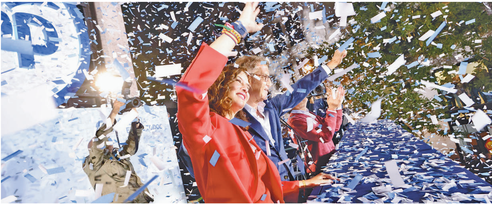
Isabel Díaz Ayuso celebra su victoria en Génova junto a Alberto Núñez Feijóo y a José Luis Martínez-Almeida