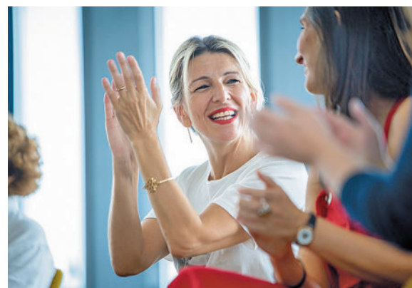
Yolanda Díaz, en un acto de campaña

las instituciones regionales y de muchas de las grandes capitales, los ojos se giran hacia la vicepresidenta segunda, Yolanda Díaz, que ya ha registrado su proyecto, el Movimiento Sumar, como un partido político. Díaz señaló tras el