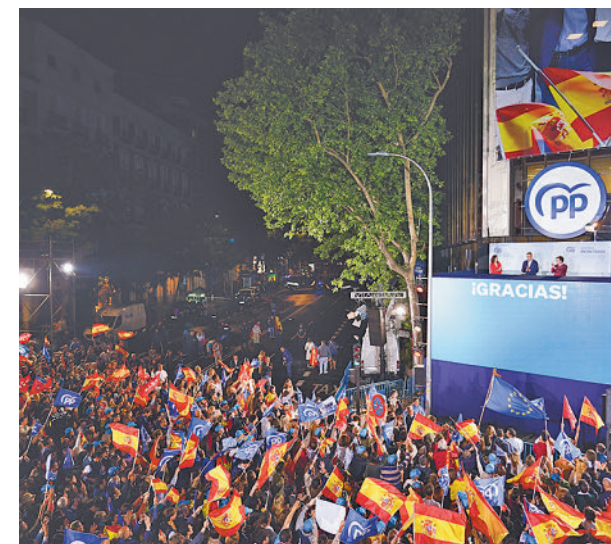
Celebración del PP en la calle Génova

En la parte izquierda del tablero Más Madrid empeoró con Rita Maestre en el lugar de Carmena, pero liderará la oposición por delante de PSOE y de Vox. Fuera del pleno se quedarán Podemos, que no llegó al 5%, y Ciudadanos, que ha pasado de tener a Begoña Villacís como vicealcaldesa a desaparecer de Cibeles.