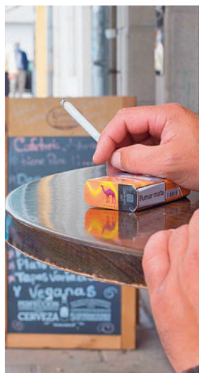
Más dudas con el tabaco

"Es evidente que hay una creciente demanda ciudadana a favor del avance de