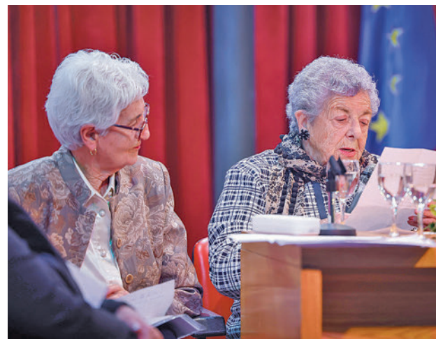
Dos de las integrantes del grupo

El grupo de lectura se formó en las Navidades de 2020 y, desde entonces, participa en las celebraciones que este centro organiza con motivo de fechas señaladas. En la actualidad está formado por nueve personas, cuyas edades oscilan entre los 67 y 95 años. Es un grupo terapéutico, coordinado desde el departamento de Psicología, con el objetivo de contribuir a la ac-