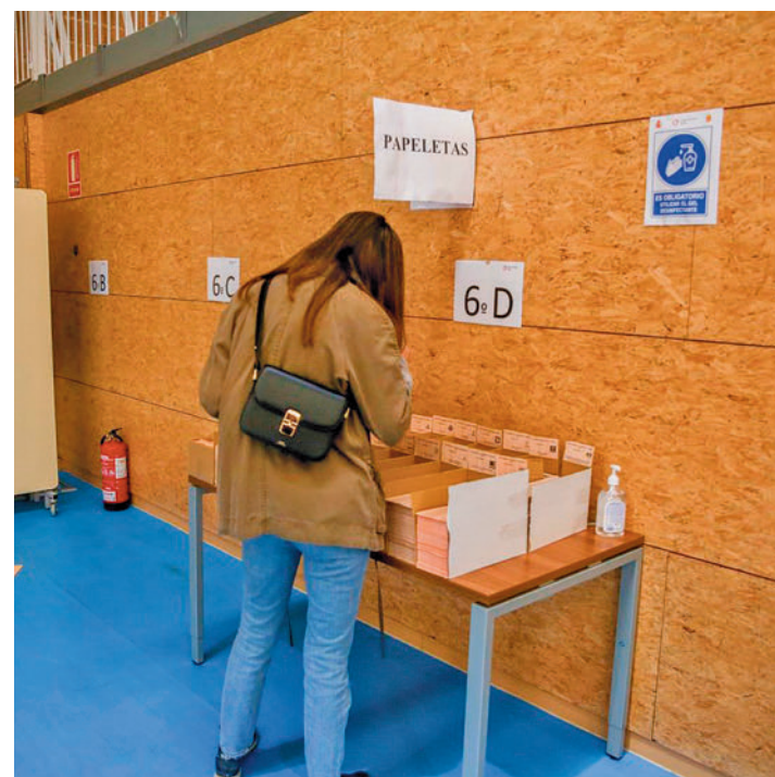
Voto nulo o en blanco: El voto blanco es válido, pero no va dirigido a ninguna candidatura, por lo que se reparte de manera proporcional en función al apoyo que ha recibido cada candidatura. La forma de emitirlo es un sobre vacío. El nulo no cumple con los requisitos, así que no se reparte.

pueden estar presentes en el mismo junto con los apoderados e interventores, que son los representantes de los partidos políticos. Si existe discrepancia con el criterio de la presidencia de mesa, por ejemplo, el presidente dice que un voto es válido y el interventor cree que no lo es, el interventor presentará una reclamación y se adjuntará a la documentación que se remite a la Junta Electoral para que decida.