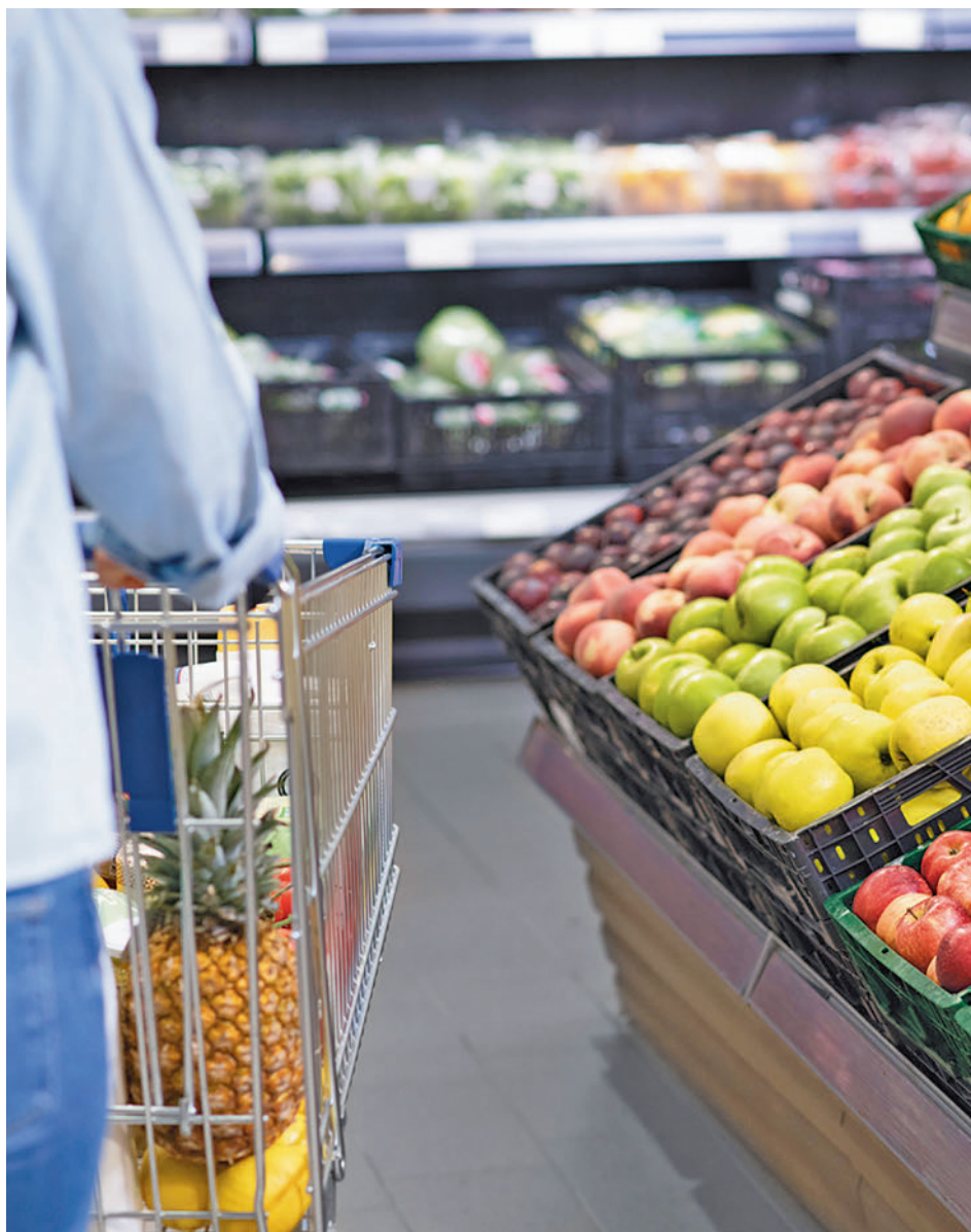
Frutas y verduras en un supermercado

Para el 68,2% de las familias madrileñas que el producto fresco sea de temporada es un factor determinante en su compra. Por otro lado, la gran mayoría de los hogares (72,9%) también tienen en cuenta el origen de los frescos en su compra habitual y, concretamente, el 90,9% de ellos compra productos frescos de origen nacional. El 55,4% de los consumidores madrileños dan mucha o bastante importancia al envase en el que se presentan los productos frescos.