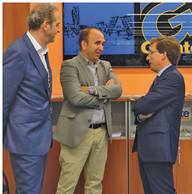
Martínez-Almeida, durante su visita a GENTE

Potenciar las diferentes alternativas de movilidad. Vamos a poner en marcha un proyecto pionero como el Bus Rapid, que va a unir los desarrollos del Norte con el Hospital Ramón y Cajal, queremos ejecutar el carril Bus-VAO de la A-2 y establecer nuevas líneas de autobús que unan los barrios con sus hospitales de referencia. Y también tenemos