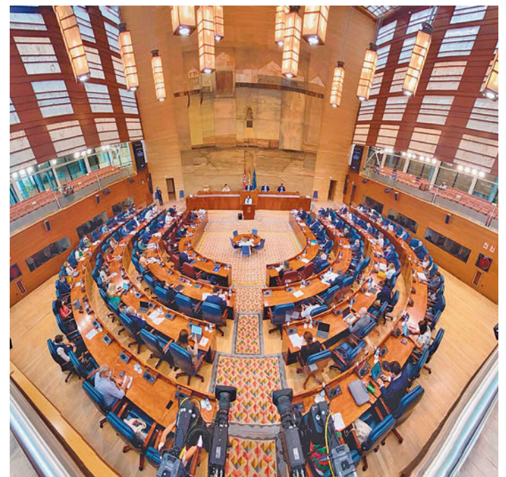
Asamblea de Madrid

Pero si cualquiera de los dos tiene alguna opción de ser el próximo presidente de la Comunidad de Madrid, sus opciones pasan de manera obligatoria por la entrada de Podemos en la Asamblea. Hace dos años tuvieron que tirar de Pablo Iglesias para dar la vuelta a unas encuestas que ponían en duda su acceso a la cámara regional. Ahora Ale-