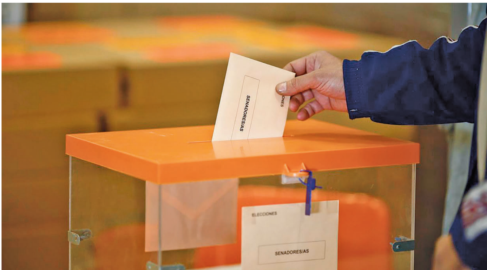
Los colegios electorales se abrirán este domingo 28 de mayo