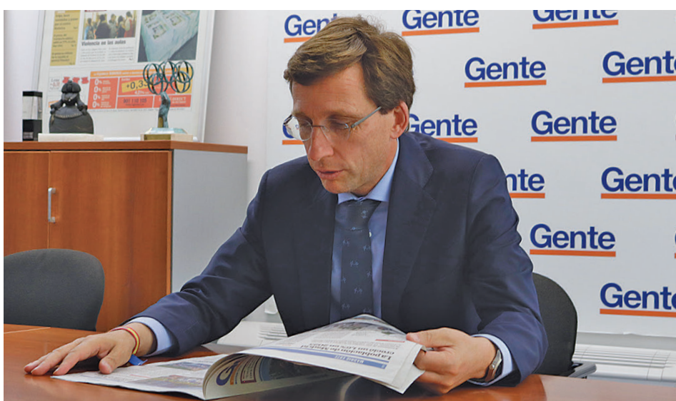
En la redacción de GENTE: El alcalde de la capital y candidato del Partido Popular a la reelección, José Luis Martínez-Almeida, acudió esta semana a la redacción de GENTE para hablar de los proyectos que pretende poner en marcha si repite en el cargo tras las elecciones de este domingo.