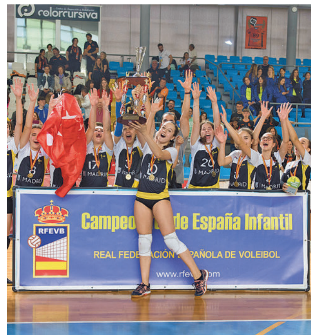
Las jugadoras madrileñas celebrando el título

En el horizonte ya se dibuja la 'Final Four', a disputar los días 17 y 18 de junio en sede aún por determinar.