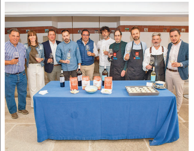
Foto de familia de los asistentes a la presentación