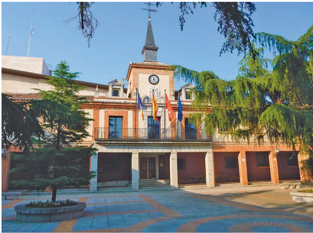
La sede del consistorio de la localidad