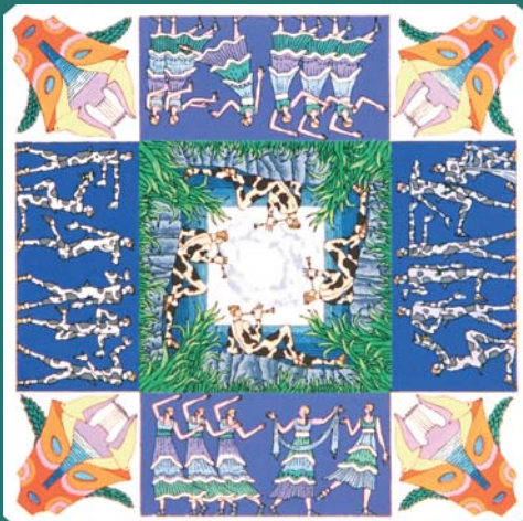
Ilustración de José Román Sánchez

ZARZUELA - 'DOÑA FRANCISQUITA' - COMEDIA LÍRICA EN TRES ACTOS ESTRENO - MIÉRCOLES ÍNTIMOS - TEATRO - 'ANÓNIMO' DANZA - BALLET NACIONAL DE CUBA EL PALACIO CON LOS NIÑOS - '¿CUÁNDO VIENE SAMUEL?' MÚSICA CLÁSICA - ORQUESTA SINFÓNICA DEL PRINCIPADO DE ASTURIAS TEATRO - 'LADIES FOOTBALL CLUB' JUEVES CLÁSICOS - KRISTINA SOCANSKI Y HUGO SELLES TEATRO - 'LA ISLA DEL AIRE'