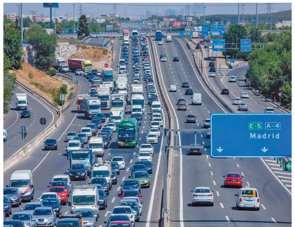
Imagen de una carretera de entrada a Madrid

20,7%. Uno de los problemas para la implantación del coche eléctrico es su precio, que de media se eleva hasta los 34.000 euros. No obstante, el Gobierno concede rebajas de hasta 7.000 euros a través del Plan Moves. A tenor de las cifras y, para llegar a los objetivos establecidos, el Partido Popular propuso esta semana introducir una nueva disposición en el decreto ley 29/2021, por el que se adoptan medidas urgentes en el ámbito energético para el fomento de la movilidad eléctrica, el autoconsumo y el despliegue de energías renovables. Mediante esta nueva