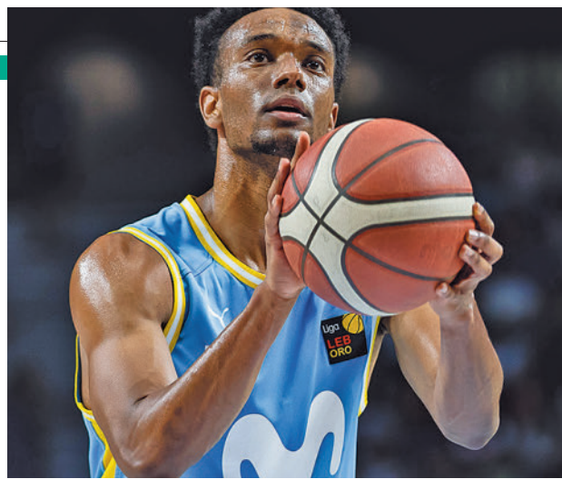
Nueva cita este domingo en el WiZink Center M. ESTUDIANTES

El Movistar Estudiantes recibe en el WiZink Center a uno de los rivales de la zona alta, el San Pablo Burgos • Los colegiales no tendrían el factor cancha