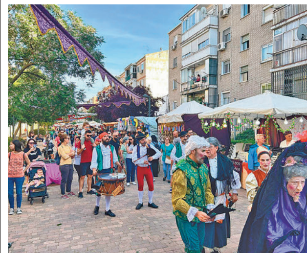
Mercado Goyesco de Leganés