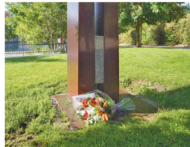
Ramo de flores en el monumento