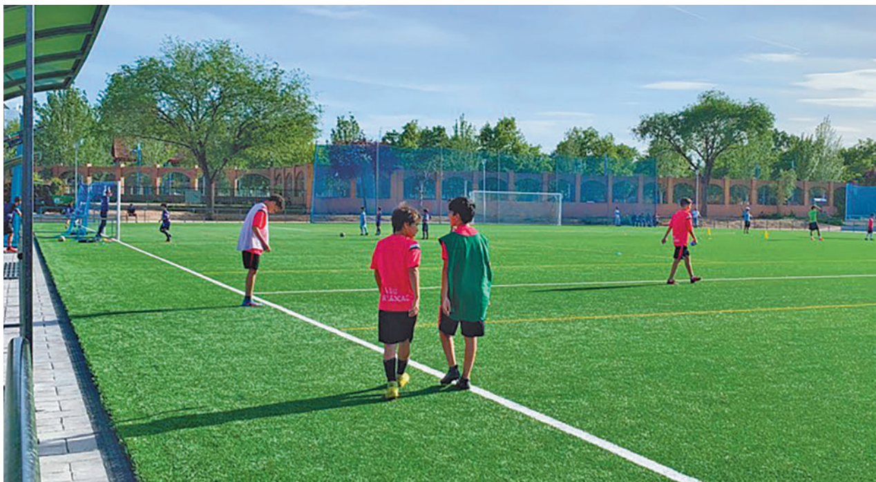
Uno de los campos de fútbol de la Instalación Deportiva Julián Montero

Toda la actualidad de Leganés, en nuestra página web