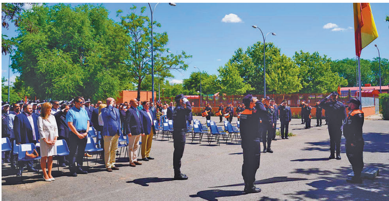
Acto de celebración del 40 aniversario de la Agrupación de Protección Civil de Leganés