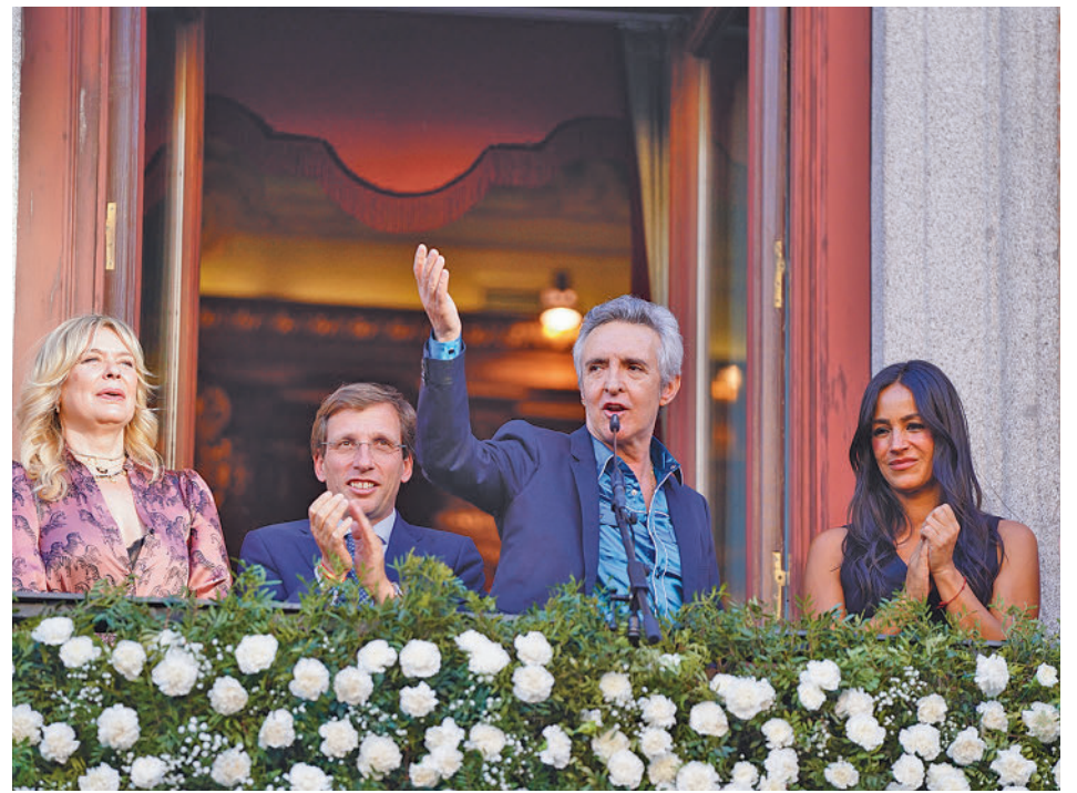
El cantante Ramoncín leyó el pregón desde el balcón de la Plaza de la Villa este miércoles 10