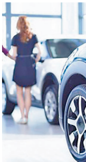
Concesionario de coches

este tipo de automóvil en 19.060 euros, un 0,4% menor que el mes anterior, la sexta caída mensual consecutiva, según el barómetro de Coches.net. Este descenso ha sido desigual en función al tipo de combustible, ya que