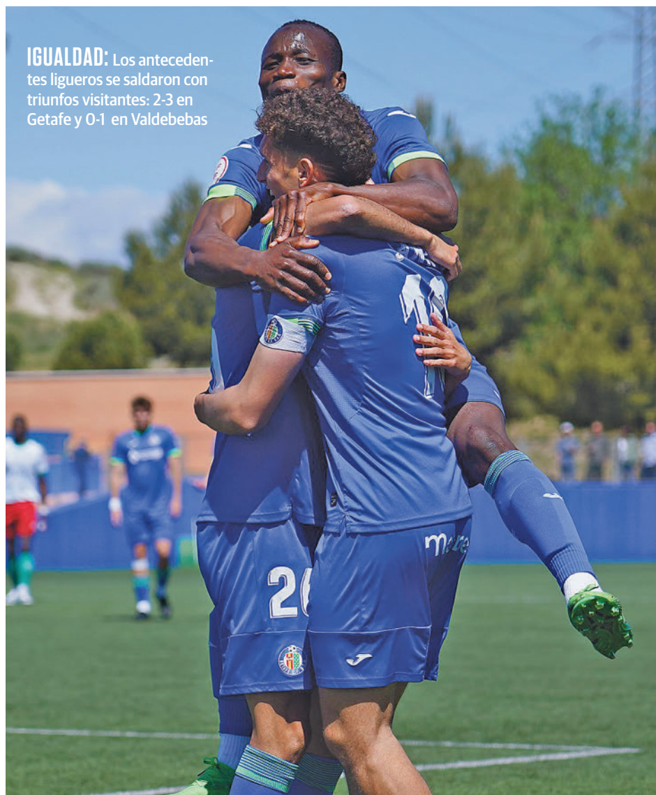
IGUALDAD: Los antecedentes ligeros se saldaron con triunfos visitantes: 2-3 en Getafe y 0-1 en Valdebebas

Tras estas eliminatorias, RSC Internacional y Getafe B disputarán ahora otra serie a doble partido, cuyo capítulo inicial se vivirá este domingo 14 (11:30 horas) en la Ciudad Deportiva azulona. Como ya sucediera en el choque con el Paracuellos, la alta demanda de entradas ha llevado al Getafe a permitir el acceso de forma exclusiva a sus abonados, lo que habla de la enorme expectación que genera el duelo. Por su parte, el RSC