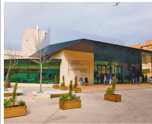
Teatro Francisco Rabal