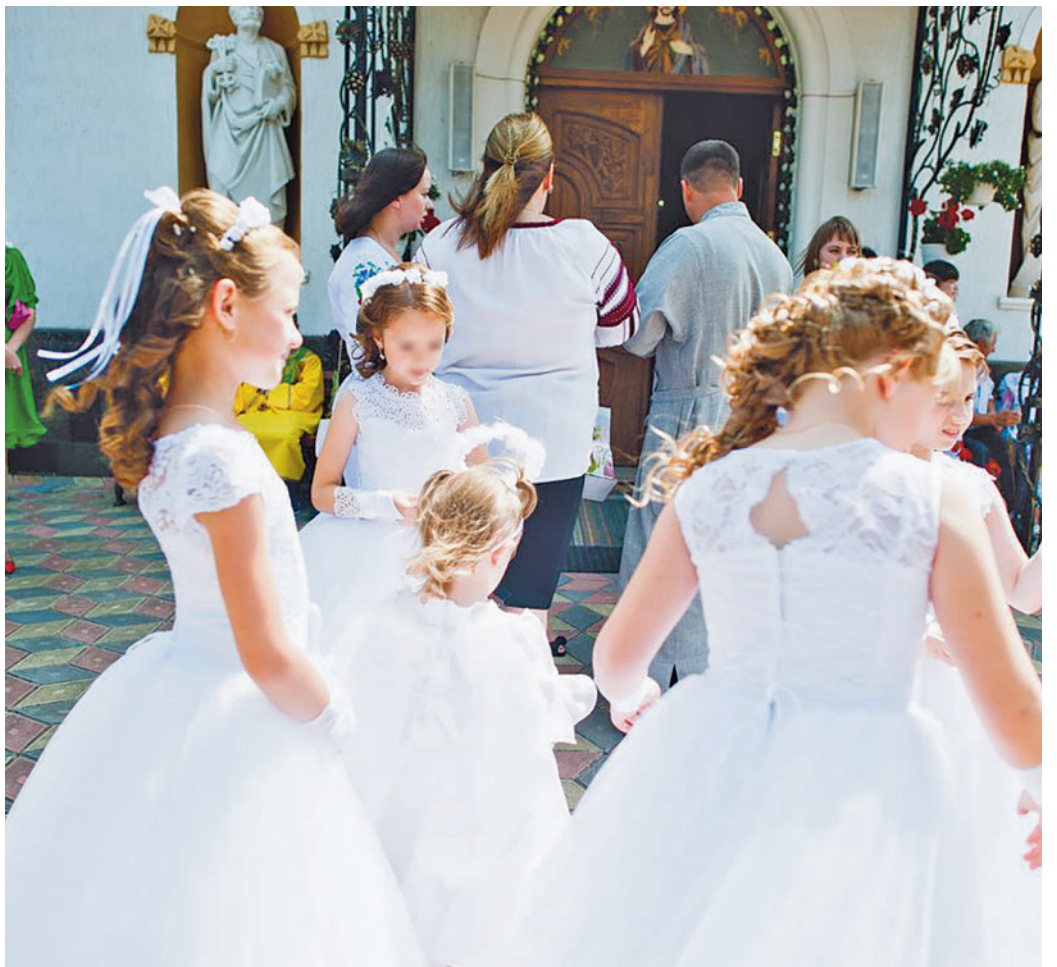
Las comuniones son cada vez más caras

En esta plataforma han ido constatando que desde 2019 hay una mayor tendencia a la contratación de más servicios para este tipo de celebraciones, que van desde el alquiler de castillos hinchables hasta fiestas temáticas e incluso espectáculos de magia. “Hace diez años las comuniones eran un evento donde se centraba más en la atención en lo