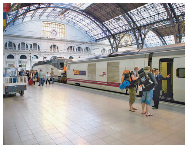
Uno de los trenes de Interrail

pero que en ambos casos tengan fijada su residencia en España. En el caso de los viajes que se realicen dentro de España, el programa consistirá en un descuento del 90% en los trenes de media y de larga distancia y también en los autobuses que dependen del Estado, además de un 50% de descuento en los trenes Avant y un 50% también en los servicios comerciales de