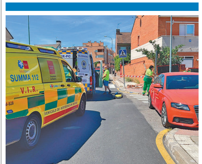
Lugar del accidente

El primer día las personas asistentes recibirán instrucciones en materia de convivencia y prevención de problemas de comportamiento. La segunda estará orientada al lenguaje canino, la tercera a manejar aspectos como la atención, la memoria o la empatía y el último día se realizará un entrenamiento animal. Las inscripciones se realizan en la dirección de correo electrónico actividadesba@ayuntamientoparla.es .