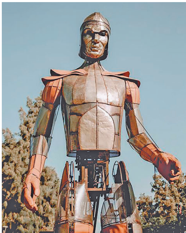
Representación de 'Aquiles'

El primero de los espectáculos será esta sábado 13 a las 22:15 horas en el recinto Ferial. Lleva el título de 'Senda sobre ruedas' y es una obra de 'clown' y 'videomapping' para todos los públicos que se realiza en el exterior de una caravana. Poesía, magia y humor se mezclan en un fantástico y pasional viaje con la risa y la dulce torpeza del payaso. Un día más tarde, el domingo 14, llegará 'Ohlimpiadas'. Dos limpiadoras aburridas de su rutina diaria, entran en un mundo de ensoñación donde