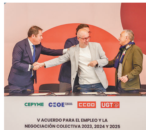
Empresarios y sindicatos firman el acuerdo

Álvarez resaltó también que tanto los sindicatos como la patronal llegaron a la conclusión de que “es bueno para el país y los trabajadores” dar esta señal de subida de los salarios, que aporta “estabilidad y confianza”. Se trata de una “aportación al país”, remarcó.