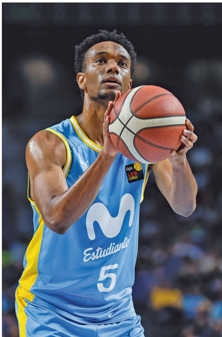
Nueva cita este domingo en el WiZink Center MOVISTAR ESTUDIANTES

Con este panorama, al 'Estu' no le queda otra salida que tratar de sumar sendas victorias en las dos jornadas que restan para el final de la fase regular, empezando por la cita de este domingo 14 (12:30 horas) en el WiZink Center. Enfrente estará el He-