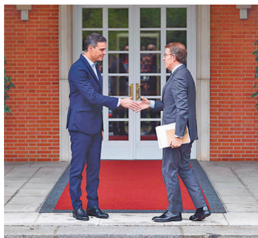
Foto de archivo de Sánchez y Núñez Feijóo

EL PERIÓDICO GENTE NO SE RESPONSABILIZA NI SE IDENTIFICA CON LAS OPINIONES QUE SUS LECTORES Y COLABORADORES EXPONGAN EN SUS CARTAS Y ARTÍCULOS