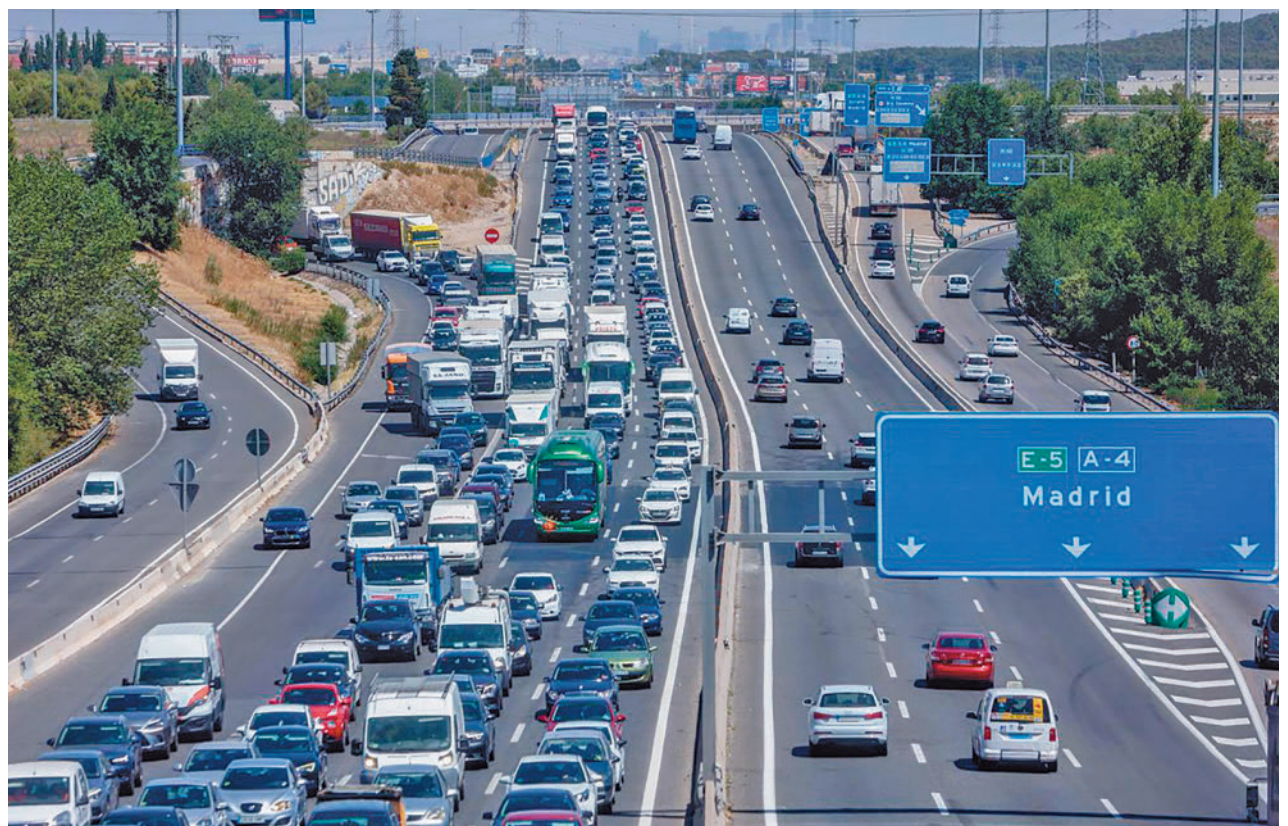
Imagen de una carretera de entrada a Madrid

Uno de los problemas para la implantación del coche eléctrico es su precio, que de media se eleva hasta los 34.000 euros. No obstante, el Gobierno concede rebajas de hasta 7.000 euros a través del Plan Moves. A tenor de las ci-