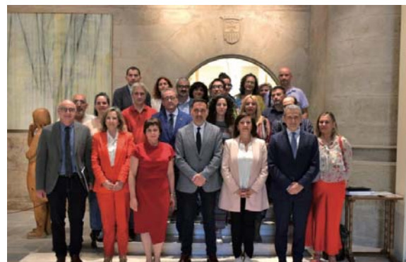
Instituciones y sindicatos, en el Parlamento.

La Ley incorpora la carrera profesional y el proceso de estabilización, y deja atrás la tasa de reposición cero y la congelación de las ofertas de empleo público. En el proceso de negociación y redacción, dispuso del beneplácito de funcionarios y sindicatos. Por eso, la presidenta regional, Con-