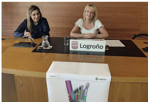
La presentación de las ayudas del Ayuntamiento.