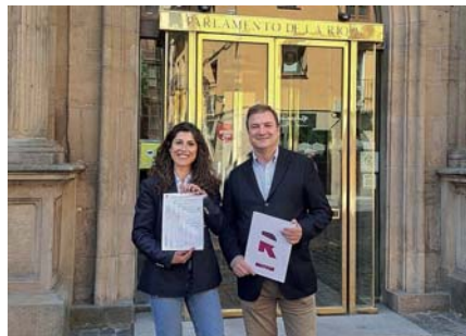
Formalización oficial del partido.