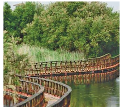
Laguna con agua en Daimiel E.P.

da, ya que alegan que el problema, lluvias aparte, viene dado por la explotación de los regadíos irregulares de la zona. WWF ha recordado que el nivel de explotación ilegal del agua en La Mancha Occidental es incluso cinco veces mayor en volumen y diez veces mayor en superficie que el que sufren los acuíferos que alimentan Doñana y el Mar Menor. La solución que proponen no pasa por el trasvase entre ríos, sino por la prohibición de seguir explotando agua del acuífero.