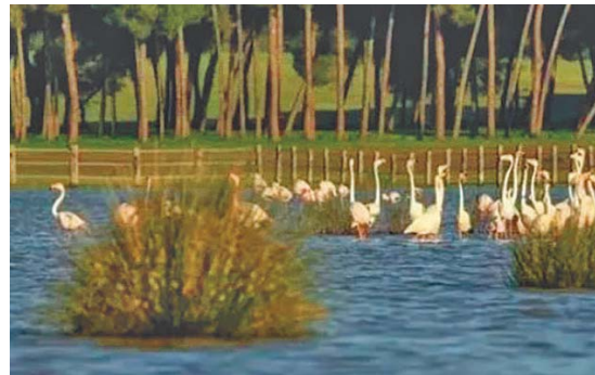
Biodiversidad: En el Parque Nacional de Doñana se pueden encontrar 37 especies de mamíferos, entre los que destaca el lince ibérico. Además, durante el año pasan por el entorno unas 450.000 aves, entre las que destacan los flamencos comunes, la aguja colinegra y el corremolinos común.