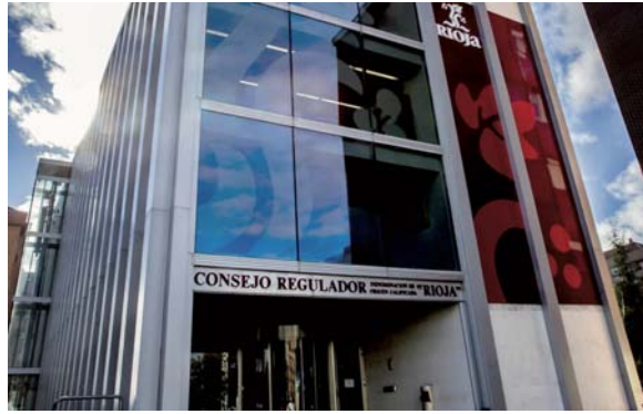
La sede del Consejo Regulador de Rioja.

En un comunicado conjunto, el sector lamenta que “más de un mes después de que se aprobase en sesión plenaria, por una mayoría de un 90%, un Plan para la Recuperación del Equilibrio que tenía como condición indispensable la aportación de fondos por parte de las comunidades que están incluidas