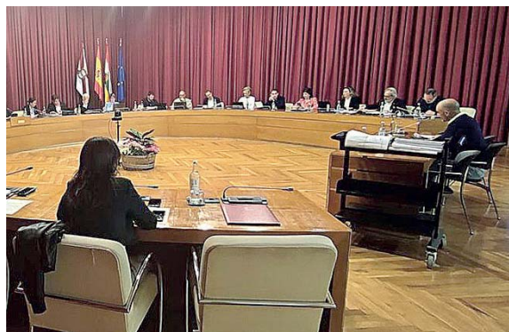
El Pleno que aprobó los Presupuestos de 2023.

Según esta organización sindical, la nueva Ley de Función Pública de La Rioja, aprobada el pasado 28 de abril en el Parlamento regional, incorpora innovaciones