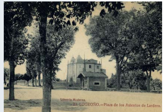
Plaza de los Asientos de Lardero.

aquellos impuestos que cobraba el Ayuntamiento capitalino si querías meter mercancía a la localidad, y que estaban custodiadas por unos empleados municipales a los que llamaban popularmente los 'depuertas'. Cuando yo fui a vivir a ese barrio, hacía dos años que acababan de construir el puente sobre la vía del ferrocarril, es decir, yo no lo vi construir, pero sí lo he visto destruir. ¡Quién me lo iba a decir! Pero 'nuestro' puente era el de República Argentina, pues vivíamos justo al lado. Cuando venía el tren, le hacíamos señas al conductor y él tocaba el silbato y nos lanzaba un chorro de humo por la chimenea que nos atufaba. No sé si será posible recuperar el nombre de la 'Plaza de los Asientos de Lardero' para los nuevos espacios que se han creado.