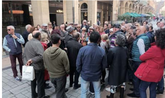
Un grupo de turistas, en Portales.

De los 57.940 turistas contemplados por el INE, 51.607 proce-