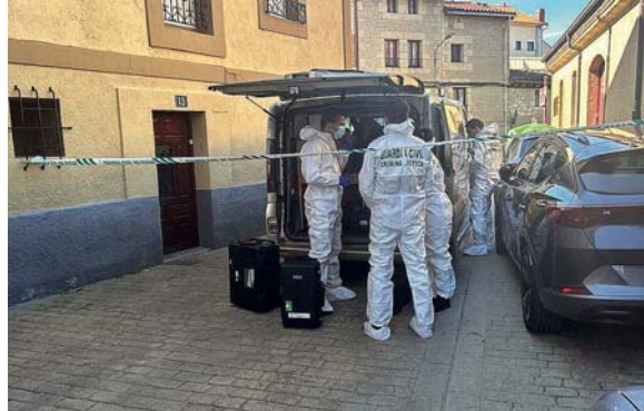
La Guardia Civil, en la escena del crimen.

Hasta el lugar del suceso se desplazaron varias patrullas de la Guardia Civil. La Unidad Orgánica de Policía Judicial de La Rioja abrió