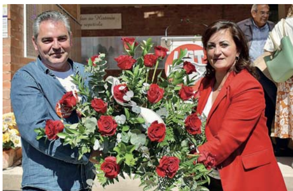
Ofrenda floral en La Barranca.

Posteriormente, tanto UGT como CCOO salieron a una concentración (con más de un millar de personas) bajo el lema 'Subir salarios, bajar precios, repartir beneficios', que concluyó en el logroñés Espolón. PSOE, IU y el Partido Co-