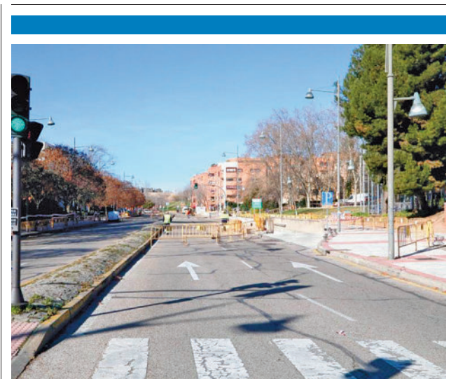
Imagen de la zona

Según recoge el Consistorio en un comunicado, comprobaron en una visita de agentes de la Policía Local y de la Guardia Civil (SEPRONA), acompañados por técnicos municipales de la Concejalía de Salud, había 25 equinos, entre los cuales había algunos en estado, según consta en el informe municipal, "muy delgados y con aspecto famélico". Los técnicos municipales también pudieron comprobar que en las instalaciones no había suficiente comida para alimentar a los animales.