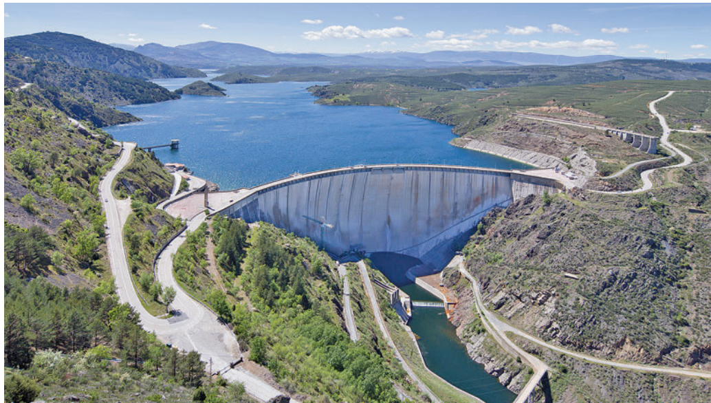
Foto de archivo del embalse de El Atazar

Sin ir más lejos, el año pasado por estas mismas fechas, los pantanos se encontraban al 72,7%, siete puntos por encima del dato actual. En lo