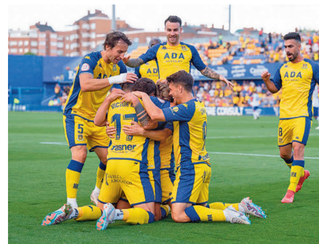
El Alorcón se impuso al Rayo Majadahonda AD ALCORCÓN

lean por evitar el descenso de categoría. El Fuenlabrada dio un paso importante la semana pasada, pero solo tiene dos puntos de ventaja respecto a la zona caliente antes de visitar al Celta B. Con un punto menos y bordeando el descenso está el Sanse, que recibirá al Algeciras, mientras que el Rayo Majadahonda visitará al San Fernando CDI.