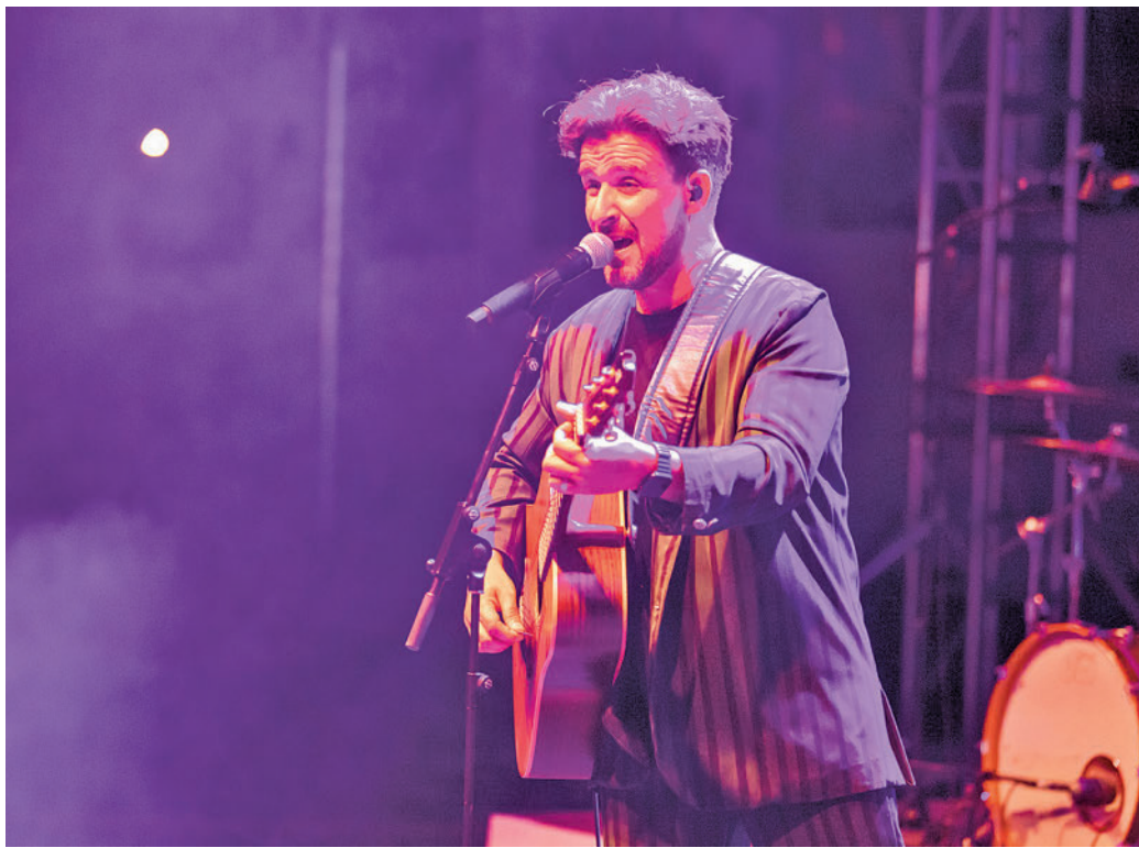
El concierto de Funambulista del sábado 13, uno de los platos fuertes