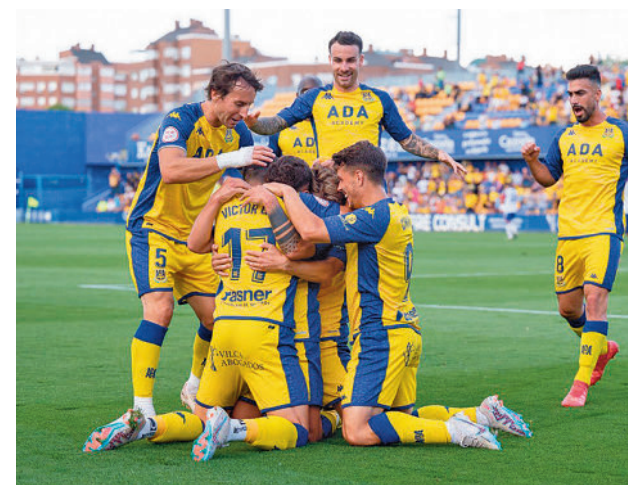
El Alorcón se impuso al Rayo Majadahonda AD ALCORCÓN

lean por evitar el descenso de categoría. El Fuenlabrada dio un paso importante la semana pasada, pero solo tiene dos puntos de ventaja respecto a la zona caliente antes de visitar al Celta B. Con un punto menos y bordeando el descenso está el Sanse, que recibirá al Algeciras, mientras que el Rayo Majadahonda visitará al San Fernando CDI.