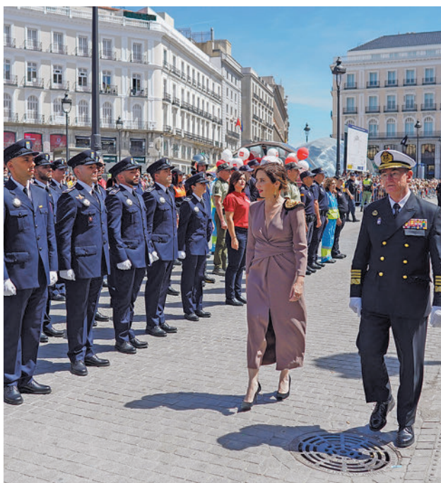
Acto con las fuerzas de seguridad