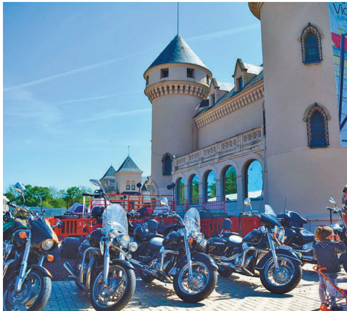
Uno de los actos de años anteriores

El entorno de Los Castillos, cuyo conjunto palaciego de estilo sajón fue usado por los distintos Marqueses de Valderas a lo largo de la historia antes de que estos edificios fueran cedidos a la ciudad, vuelve a acoger las Fiestas de San José de Valderas, que tendrán lugar hasta el 7 de mayo. Por delante, tres días de celebraciones con actividades que se distribuirán principalmen-