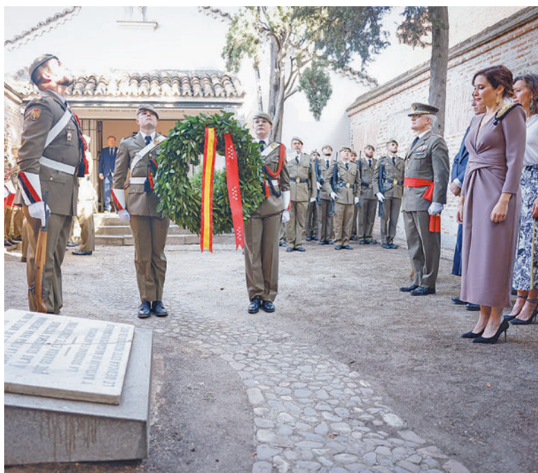
Homenaje a los caídos en 1808