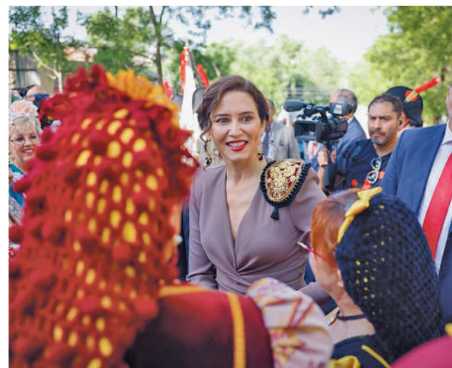
Isabel Díaz Ayuso, durante el 2 de Mayo