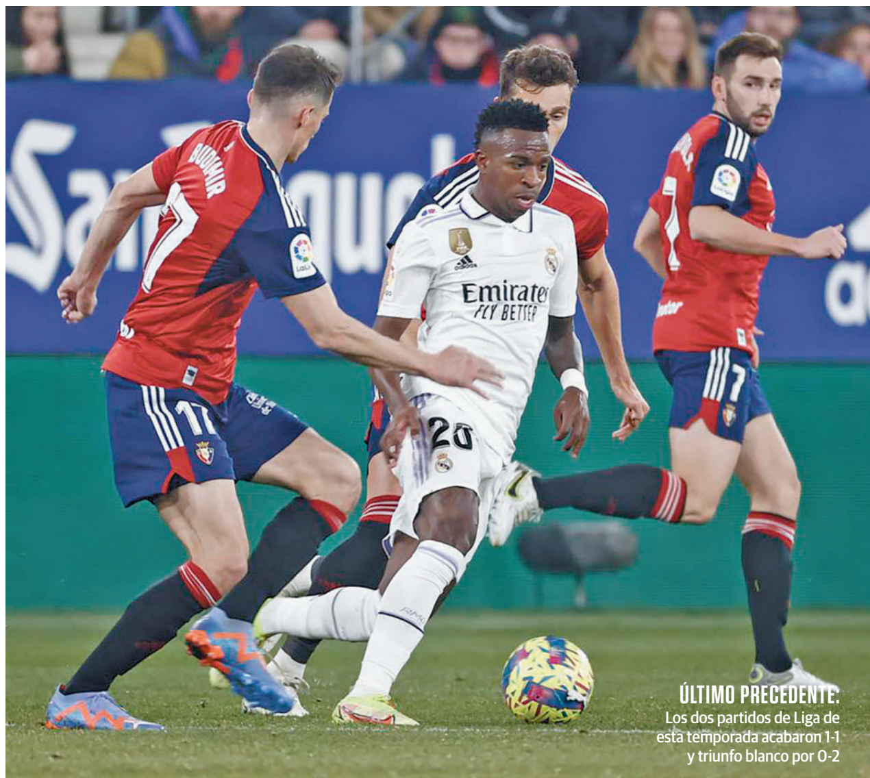
ÚLTIMO PRECEDENTE: Los dos partidos de Liga de esta temporada acabaron 1-1 y triunfo blanco por 0-2

Esta estadística y el hecho de tener la Liga prácticamente perdida obligan al Real Madrid a poner toda la carne en el asador, especialmente si se tiene en cuenta el alto grado de motivación que tiene un Atlético Osasuna que repite