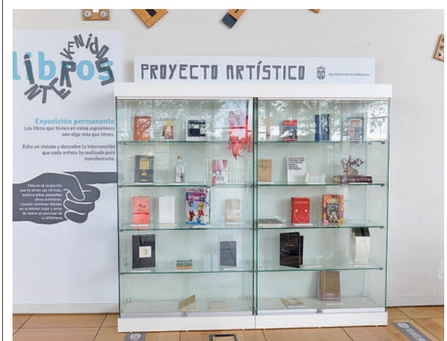
Exposición de 'Libros Intervenido'

Por su parte, el conductor de la furgoneta que arrolló a la víctima tuvo que ser atendido por un psicólogo de guardia del SUMMA 112, ya que presentaba una fuerte crisis de ansiedad. El Instituto Armado se ha hecho cargo de las investigaciones para esclarecer los motivos del accidente.