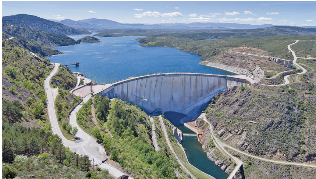
Foto de archivo del embalse de El Atazar

Sin ir más lejos, el año pasado por estas mismas fechas, los pantanos se encontraban al 72,7%, siete puntos por encima del dato actual. En lo