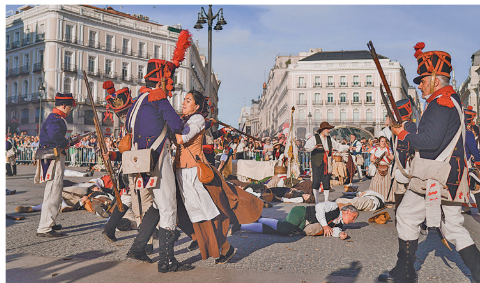
Recreación histórica en la Puerta del Sol

“Desde que Madrid es capital de España, hemos sido el centro del mundo Hispano, de Europa y del Mediterráneo. Hoy somos una de las regiones clave de la Unión Europea, admirada en el mundo”, destacó Ayuso, que también presumió de que “quizá no lo estemos haciendo tan mal cuando, pasan los años,