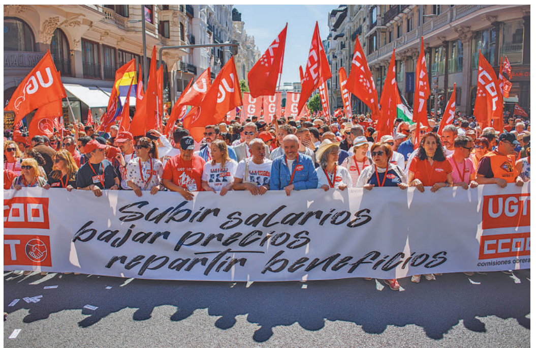
Cabecera de la manifestación celebrada en Madrid

LA DELEGACIÓN DEL GOBIERNO DICE QUE HUBO 10.000 PERSONAS EN MADRID