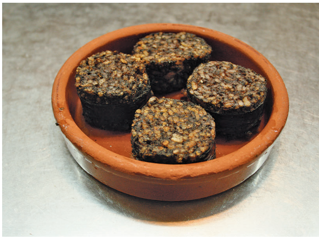
La morcilla de Burgos es uno de los platos estrella

El primer plato que destaca, como era previsible, es el de la morcilla. Su origen data del siglo XV, cuando los pastores de la zona elaboraban morcillas con la sangre de los animales que criaban y que luego mezclaban con arroz. A lo largo del tiempo, la morcilla de arroz de Burgos se ha ido perfeccionando en su elaboración, añadiéndole ingredientes como cebolla, manteca, sal y otros aditivos, lo que ha hecho que se convierta en una de las morcillas más valoradas y consumidas de España. En la actualidad está protegida por la Indicación Geográfica Protegida (IGP), lo que significa que solo puede ser elaborada en la provincia de Burgos, con