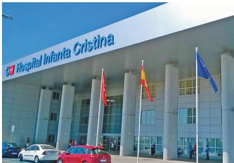
Hospital Infanta Cristina de Parla

La jornada dará comienzo a las 9:30 horas en la rotonda del hospital. La caminata atravesará el arroyo Humanejos y recorrerá el bosque ciudadano. Posteriormente, entrará en el Parque de las Comunidades, recorrerá la avenida del Sistema Solar hasta llegar al Parque del Universo por la puerta de la calle del Planeta Venus. A las 10:30 horas, las personas participantes irán a la explanada central, donde intervendrán las autoridades pertinentes tanto del Ayuntamiento como del