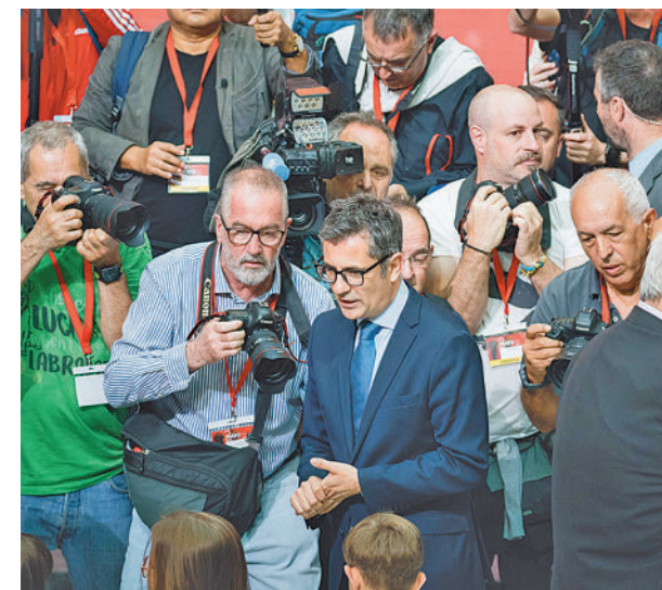
El ministro Bolaños, durante el 2 de Mayo

Bolaños criticó a los “crispadores” y a “los que se inventan mentiras para generar lío”, mientras que desde las filas populares censuraron que acudiera a un acto “al que no había sido invitado” y se quisiera “saltar el protocolo”.