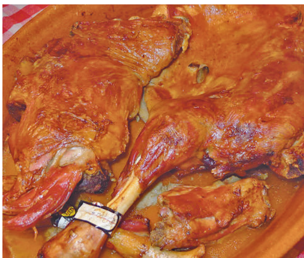
El cordero lechal es típico de toda la provincia

Protegida, es el cordero lechal. Se diferencian de los del resto de España al comer pastos de calidad que sólo crecen en la provincia. Por último, la olla podrida es típica de la ciudad. Se cocina con alubia roja de Ibeas de Juarros, acompañada de carnes, chorizo, panceta, oreja y morro de cerdo.