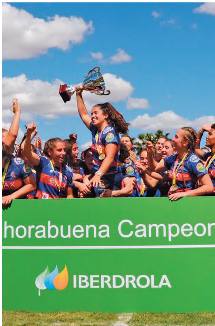
Las jugadoras del CR Majadahonda celebraron este éxito