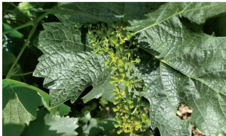
Un viñedo de Álava.

El Tribunal Superior de Justicia del País Vasco suspendió, de forma cautelar, la autorización concedida por el Ejecutivo vasco para separarse de Rioja. El poder judicial argumentó que se produciría un "elevado riesgo de confusión al permitirse la comercialización de vino bajo la nueva denominación, pues se ofrecerían dos vinos bajo sellos diferentes, pero coincidentes en zona geográfica". Rioja se lo tomó con "prudencia en una carrera de fondo". Los bodegueros alaveses aspiran a independizarse, pero