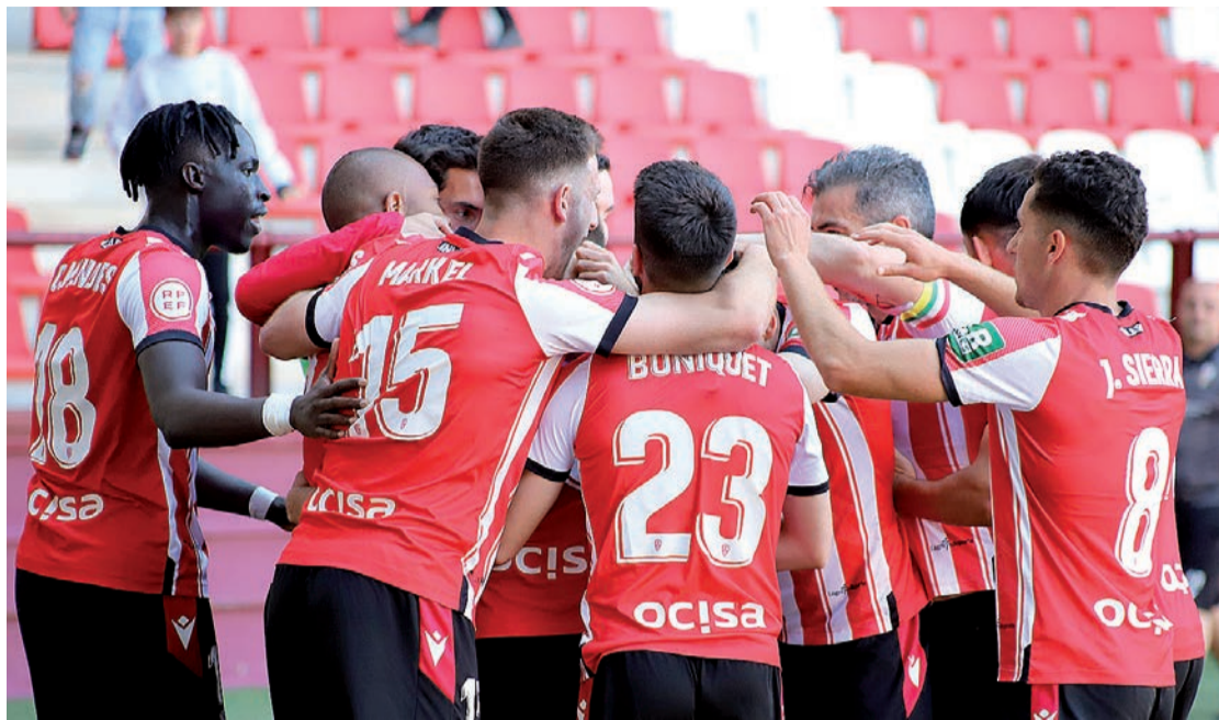
La alegría de los jugadores de la Unión Deportiva Logroñés.