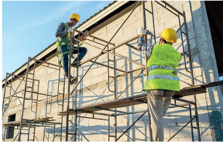
Unos trabajadores, en un andamio.

Cuando 2023 aún no ha consumido las primeras cuatro hojas del calendario, La Rioja ya ha sufrido más muertes a consecuencia de