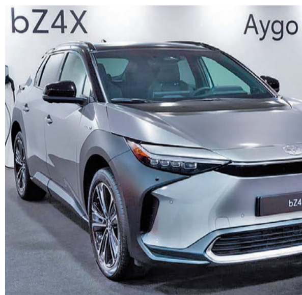
Toyota: La marca japonesa ha sido de las últimas en anunciar la creación de sus modelos eléctricos. De manera reciente ha presentado el bZ4x. Este SUV pasará a competir con otros como el Tesla Model Y, el Kia EV6 y el Skoda Enyaq iV, entre otros.