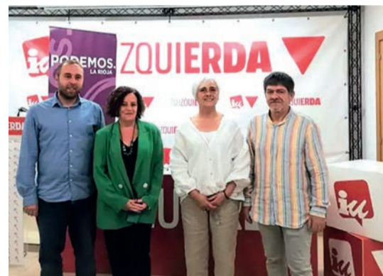
IU y Podemos, tras una rueda de prensa.