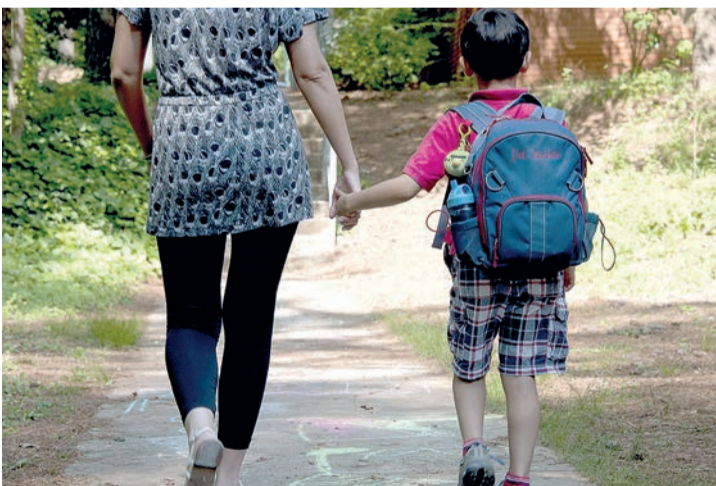
Un niño va a la escuela con su madre.

Además, el Ejecutivo riojano amplió el presupuesto destinado a las ayudas de agricultura ecológica del Programa de Desarrollo Rural para apoyar todas las solicitudes presentadas. Aumenta en 90.000 euros, hasta alcanzar los 350.000. Igualmente, el Consejo autorizó am-