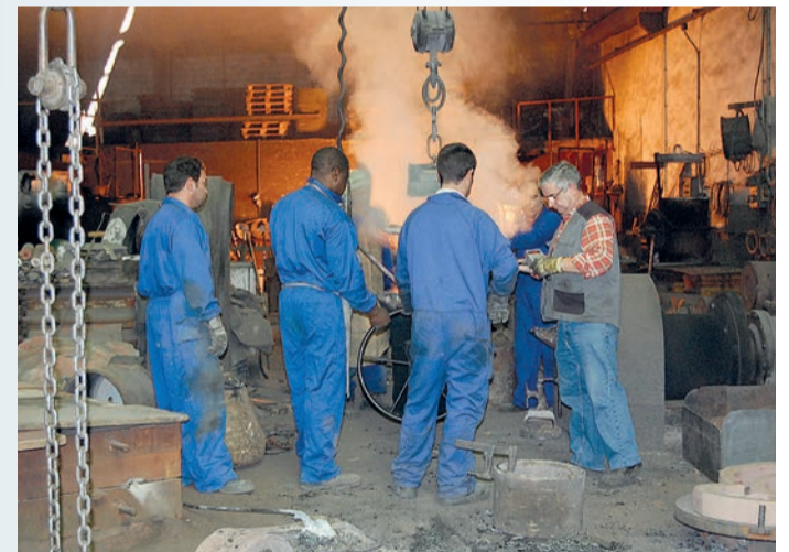
Asalariados en una fundición.

ro como no encontraban trabajo se tuvieron que autoemplear. En algunos casos no les llegan los ingresos ni para pagar la cuota de autónomos todo el año y tienen que andar dándose de alta y de baja, cuando encuentran un trabajo y deben facturar. Y luego está lo de fijos discontinuos, que es “para mear y no echar gota”. Han juntado dos palabras que, si usted las mira en el diccionario, son antagónicas, o sea: fijo, significa permanente; discontinuo, significa no continuo. Bueno, pues el Gobierno ha sido capaz de juntarlas y quedarse tan ancho, usted es alto y bajo a la vez. En fin, lo difícil es crear puestos de trabajo y eso lo hacen los empresarios si ven que tienen el viento a favor. Nadie arriesga su dinero con la posibilidad de que se le vaya a la basura.