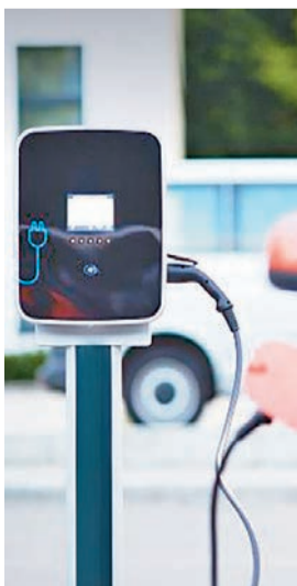
Cargador de coche eléctrico

dado que en el país transalpino se comercializaron 8.195 automóviles de este tipo, lo que supone un 81,5% más que los 4.515 que se vendieron en marzo de 2022. Por su parte, en Francia se entregaron 30.635 uni-