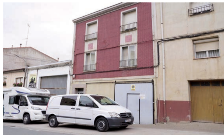
La vivienda en Entrena del presunto autor de los hechos.

Según el escrito de la Fiscalía, en la tarde del 29 de julio de 2021, el acusado (con antecedentes penales por robo con fuerza y maltrato animal) pidió a Ovejas y su pareja que fueran a su casa de Entrena con la intención de vengarse de un