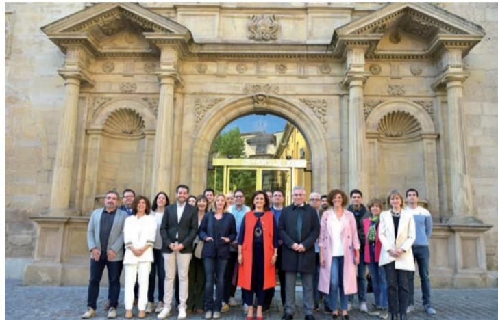
Andreu y los integrantes socialistas de su candidatura, en el Parlamento riojano.

Andreu considera que necesita "cuatro años más": "Hay que afianzar el cambio. Los que hemos puestos en marcha la locomotora económica de La Rioja, debemos pilotarla hasta consolidar todos los proyectos. No se puede permitir volver a la época de las privatizaciones y de la apatía. Además, impulsaremos una Ley de Reto Demográfico y Activación Rural