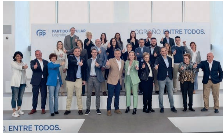
Foto de familia de la lista y los responsables del PP.