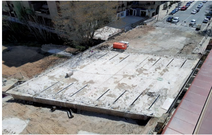
El tablero del ferrocarril, en Vara de Rey.

A partir de ese momento empezarán las tareas de cortes longitudinales con hilo de diamante y transversales. Cuando finalicen, se retirarán las vigas de una en una con la grúa. Cada una de las diez vigas se depositarán en la calle Miguel Delibes, junto al cajón del fe-