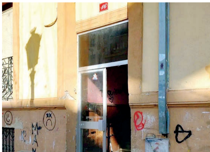
El portal 16 de Avenida de Navarra.