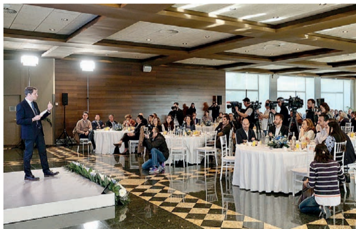
Capellán, en el desayuno informativo con la sociedad riojana en el Delicatto.

si revalidamos". Capellán acusó al Ejecutivo de "malgastar los fondos europeos" y de "no favorecer la actividad empresarial". Se comprometió a "convertir a La Rioja en la comunidad con el IRPF más bajo de España" y a "apoyar a sectores abandonados, como los autónomos, el vino y la agroalimentación".