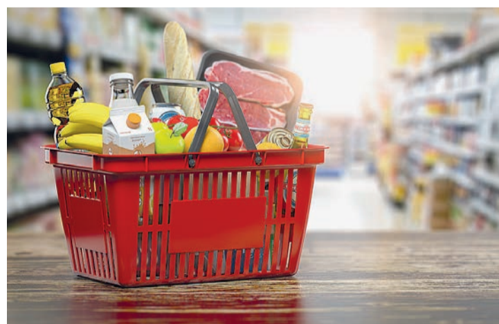
Una cesta de la compra en el supermercado.

En el caso de la comunidad riojana, la subida se produjo especialmente en 'Vestido y calzado', con un aumento del 1,9%, seguido del 1,3% de 'Alimentos y bebidas no alcohólicas', y del 1%