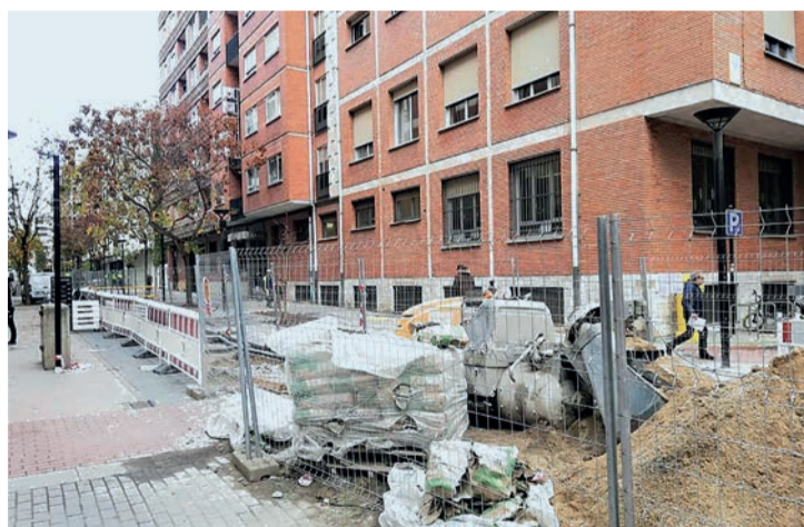
Las obras inconclusas en Cien Tiendas.

La empresa adjudicataria de la reurbanización de las Cien Tiendas recibirá 1.323.839,49 euros, correspondientes exactamente al 40% de la ejecución de las obras. Así lo reflejan las seis certificaciones que maneja el Ayuntamiento de Logroño, y que Cotodisa fue entregando en función del avance de la actuación. Un porcentaje de ejecución y un montante económico al que dio luz verde el área de Intervención Municipal, que exigió también distintos arreglos para rematar las áreas sin finalizar o en mal estado. A ese respecto, “Cotodisa no se niega a efectuar las intervenciones solici-