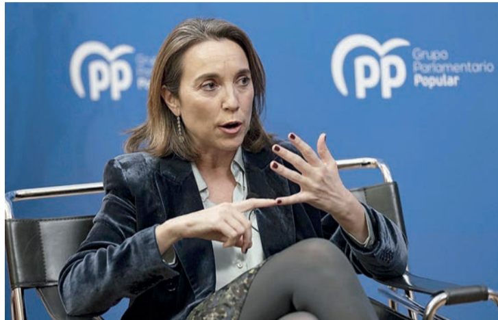
Cuca Gamarra, secretaria general del PP.

Gamarra aparece en varios de los documentos (fechados en 2011) que "evidencian la mediación del Ejecutivo riojano en la etapa de Sanz con empresas públicas y privadas a las que directamente pedía trabajo para simpatizantes, cargos públicos del PP o sus familiares". El medio, además, asegura que contactó con varios solicitantes que confirman que la secretaria general del PP fue quien les indicó que pidieran mediación al gabinete de