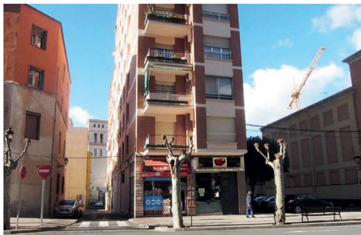
El barrio de La Villanueva.