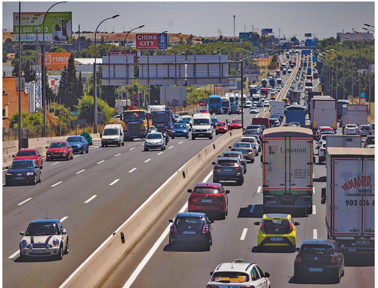
Europa ha prohibido la venta de vehículos de combustión a partir de 2035

mermada su capacidad de venta. Ante la previsible demanda de finales de década, quienes no estén ya posicionadas en el nuevo mercado como Tesla tendrán “serios problemas” para manter sus cifras de ventas.