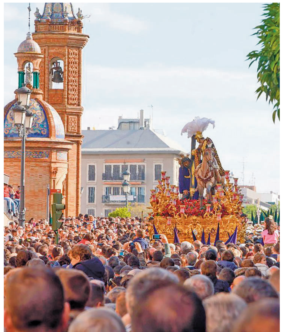
Andalucía, un referente en cuanto a procesiones

Con un aroma a incienso y azahar en sus calles, es probablemente una de las más reconocidas por sus contrastes. Entre la algarabía y el silencio, la Semana Santa en Sevilla no