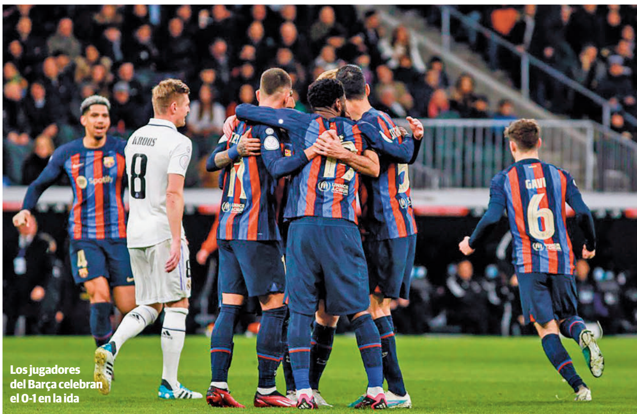
Los jugadores del Barça celebran el 0-1 en la ida