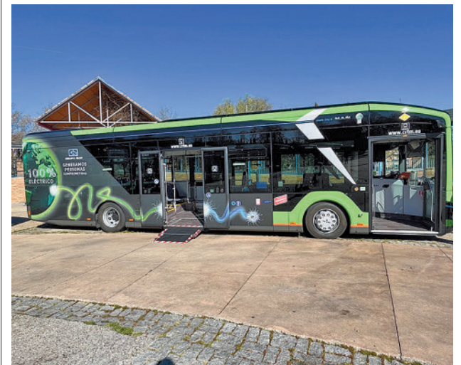
Nuevos autobuses de la línea 484

La línea 484 es la interurbana con mayor afluencia de viajeros en Leganés. En el año 2022 efectuó 285 expediciones diarias laborables, con 9.667 viajeros de media. Además, el año pasado tuvo una ocupación de 33,9 usuarios por trayecto y una demanda anual de 2,7 millones de personas.