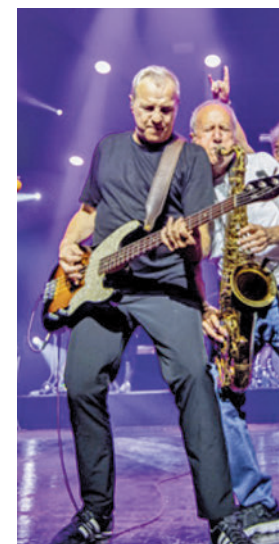
Concierto de Hombres G

El sello de calidad que envuelve al Universal Music Festival hace que haya "una ambición sana por mejorar año a año". Ese espíritu y el deseo de diferenciación se plasman, según la representante del festival, en que, por ejemplo,