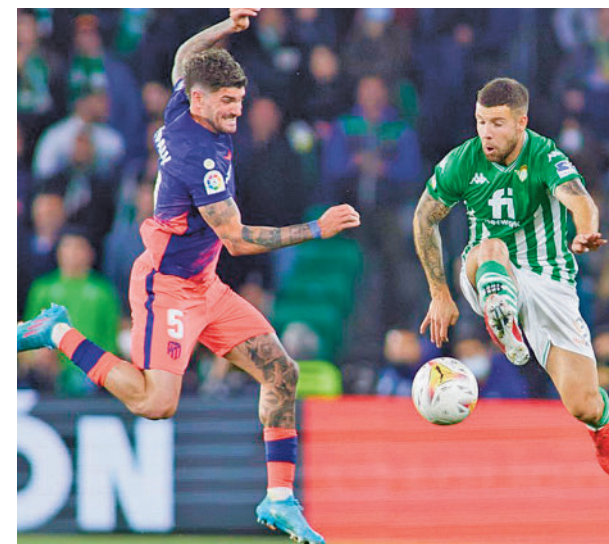
El Atlético de Madrid-Betis es el partido de la jornada

Cádiz-Sevilla (sábado 1, 18:30) es el choque más destacado en esta zona de la clasificación, con el aliciente del debut de Mendilibar en el banquillo hispalense. Girona-Espanyol, Athletic-Getafe, Celta-Almería, Real Madrid-Valladolid y Valencia-Rayo completan el menú por la salvación.