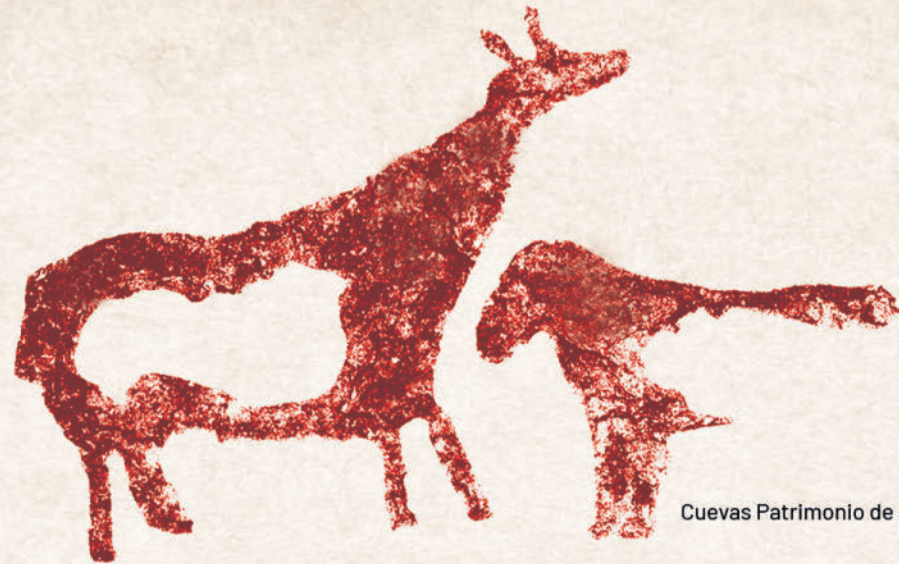
Cuevas Patrimonio de la Humanidad