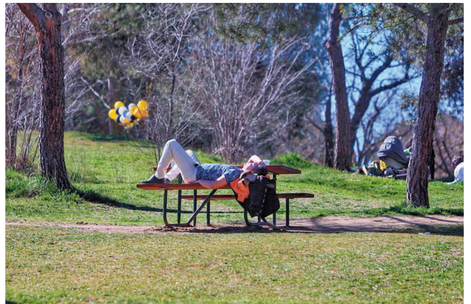
El buen tiempo podría ser la tónica dominante

Por otro lado, lloverá menos de la media en el oeste de Ga-