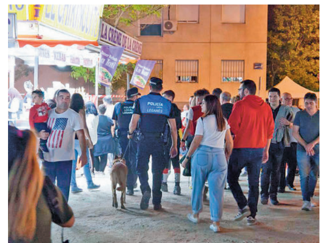
Policía Local en Leganés