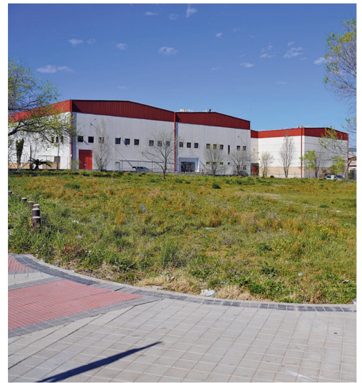
Parcela de un nuevo parque infantil