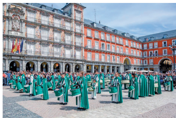
Tamborrada del Domingo de Resurrección

Estos atractivos son una de las razones que explican el hecho de que Madrid sea la segunda ciudad más buscada por los ciudadanos franceses, italianos y portugueses, la cuarta por los alemanes y británicos y la quinta por los neerlandeses, según