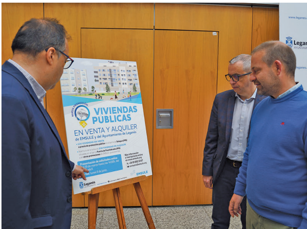
Presentación de las nuevas viviendas públicas