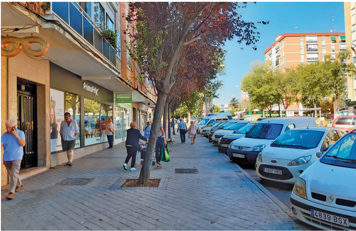
Las aceras de Zarzaquemada serán unas de las primeras en renovarse