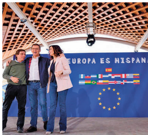
Almeida, Feijóo y Ayuso, en un acto reciente

EL PERIÓDICO GENTE NO SE RESPONSABILIZA NI SE IDENTIFICA CON LAS OPINIONES QUE SUS LECTORES Y COLABORADORES EXPONGAN EN SUS CARTAS Y ARTÍCULOS