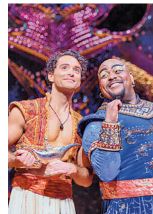
Imagen de la representación

Magia, espectáculo y diversión, en una producción que cuenta con una gran escenografía, un espectacular vestuario y un equipo integrado por más de 180 profesionales en cada representación que convierten a 'Aladdin' en uno de los mejores musicales. De los mismos productores de otros musicales como 'La