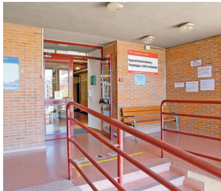
Dependencias del Centro Psicopedagógico Municipal

La iniciativa desarrollada por el Centro Psicopedagógico Municipal ha sido reconocida en el VII Concurso de Buenas Prácticas • Atiende a alumnos de Educación Secundaria