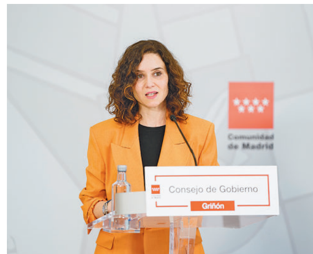
El anuncio se hizo tras el Consejo de Gobierno