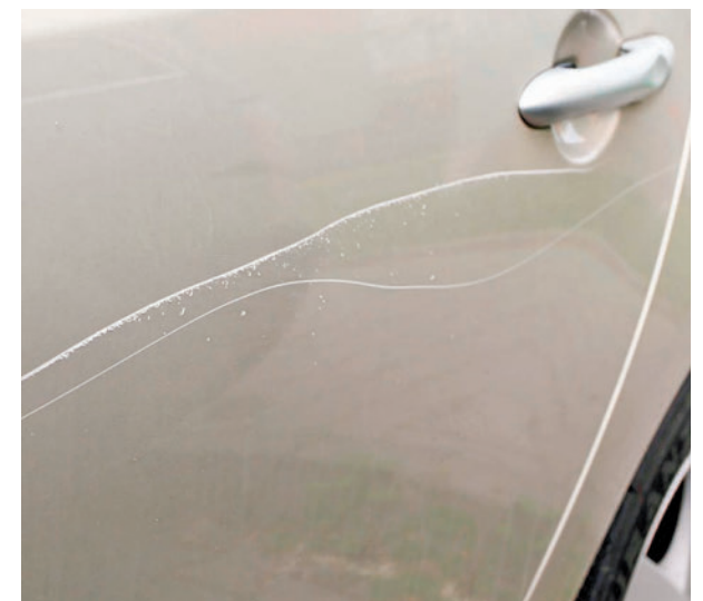
El porcentaje varía por autonomías

concienciar a la sociedad del problema que suponen los actos vandálicos y los comportamientos de algunos conductores que se dan a la fuga tras causar daños a otros. Casi la mitad de los conductores españoles se han visto perjudicados por estos actos, quedando indefensos en muchos casos. Como sociedad, debemos perseguir estas actuaciones tan poco cívicas y, como conductores, ser responsables no solo cuando conducimos, sino también cuando causamos daños a otros."