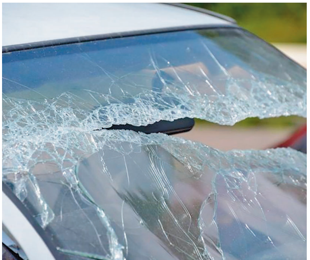
Daños en un vehículo

Los actos vandálicos más frecuentes son los arañazos (36%), daños en los retrovisos-