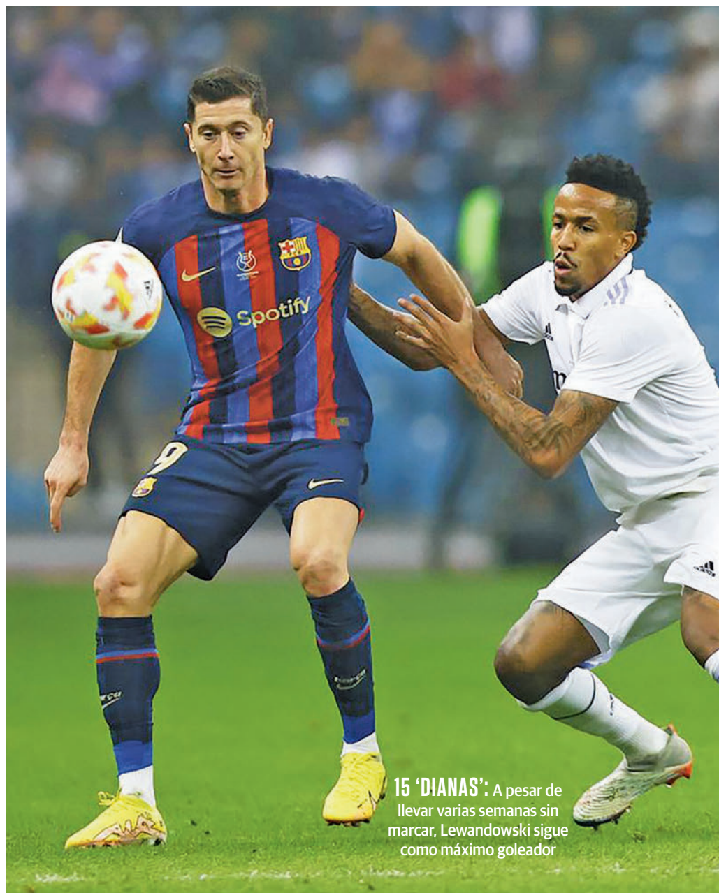
15 'DIANAS': A pesar de llevar varias semanas sin marcar, Lewandowski sigue como máximo goleador

Las matemáticas y la lógica dicen que un triunfo del Barça serviría para que Canaletas se fuera engalanando de cara a un futuro alirón, pero una victoria visitante podría generar algunas dudas en el líder de la competición, quien hasta la fecha está firmando unos números estratosféricos como local: ha ganado diez de sus doce par-