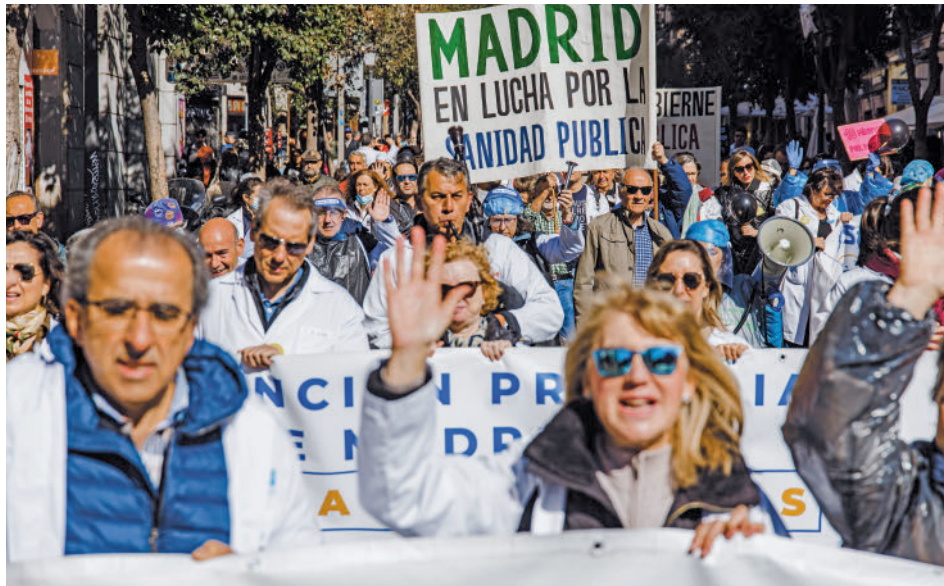
Protesta de los médicos madrileños

Ahora el sindicato Amyts tiene que trasladar la propuesta de Sanidad y, en caso de obtener el visto bueno de los profesionales, volver a reunirse con la Consejería para poner por escrito las condi-