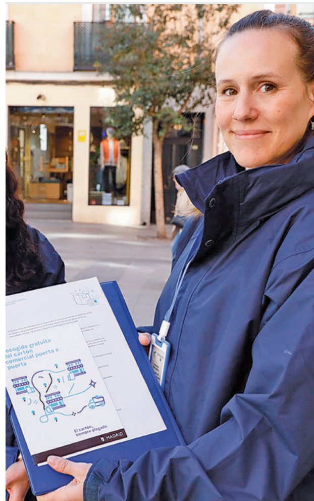
Trabajadora ambiental muestra los folletos

Con estas modificaciones se pretende contribuir a cumplir