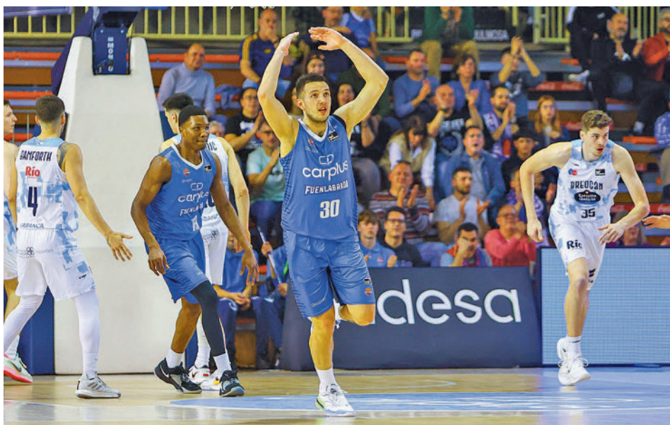
El Río Breogán también venció en su visita al Fernando Martín