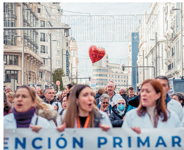
Manifestación de médicos en Madrid