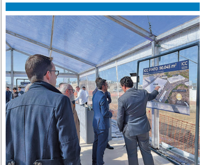
Acto de la primera piedra del proyecto

Un hombre de 42 años murió el pasado sábado 11 de marzo al ser posiblemente atropellado en un accidente en el kilómetro 25 de la autovía A-4 a la altura de Valdemoro con un camión y dos turistas implicados. Otro hombre resultó herido leve.