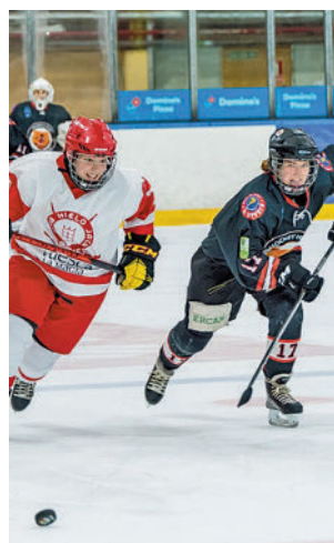
Decepción en Liga

su favor en los 'play-offs' por el título de la Liga Iberdrola de hockey hielo. Sin embargo, esa circunstancia no permitió que las jugadoras majariegas