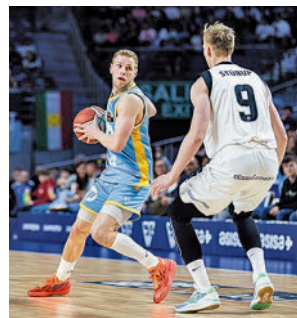
Derrota en casa

Después del gran triunfo ante BeSoccer UMA Antequera por 6-1, el Inter Movistar tiene este viernes una nueva cita liguera. Será en la pista del Industrias Santa Coloma, decimotercer clasificado.