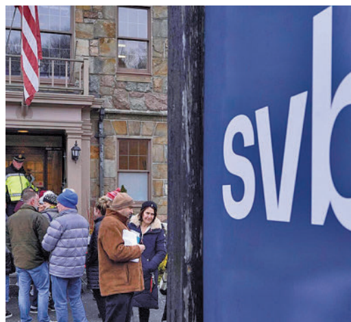
Crisis en el Silicon Valley Bank

EL PERIÓDICO GENTE NO SE RESPONSABILIZA NI SE IDENTIFICA CON LAS OPINIONES QUE SUS LECTORES Y COLABORADORES EXPONGAN EN SUS CARTAS Y ARTÍCULOS