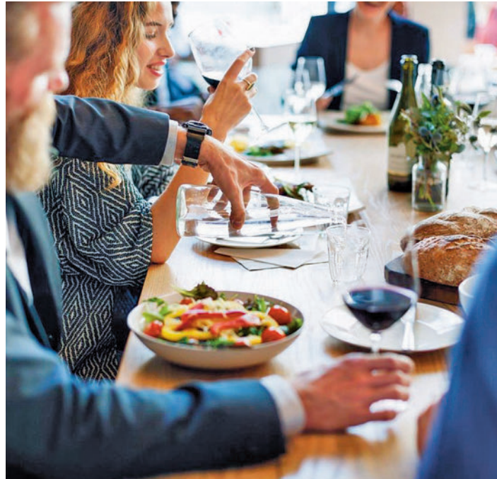
Los restaurantes acogerán comidas familiares

aprovechará el horario del mediodía, ya que al día siguiente, el lunes 20 de marzo, es festivo en la región, lo que permitirá que algunas de estas celebraciones se puedan trasladar a la noche.