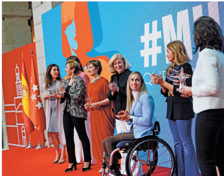
Foto de familia de las premiadas junto a la consejera