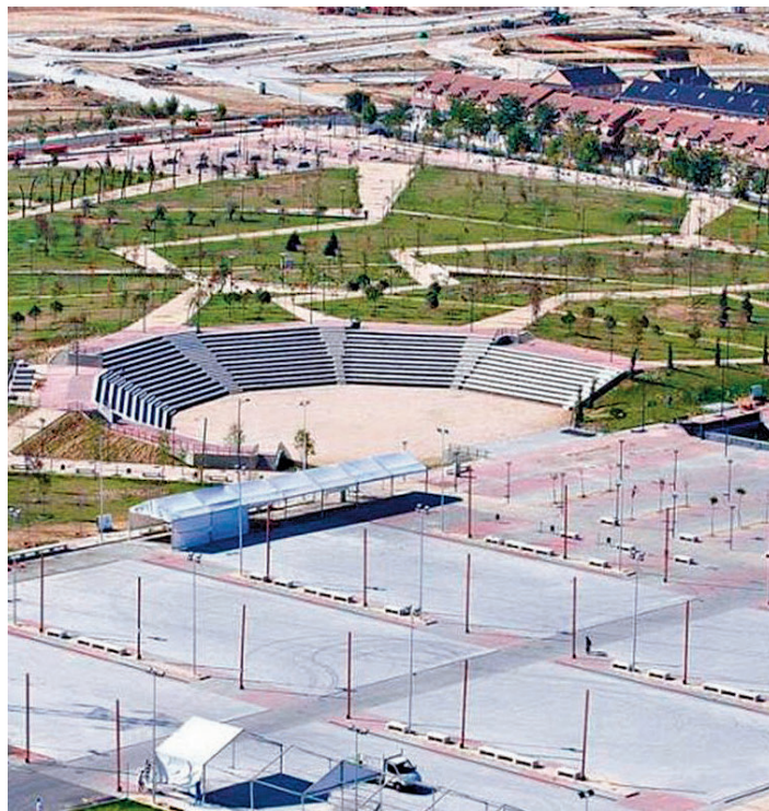
Recinto ferial de Alcorcón

EL PROGRAMA SE DESARROLLARÁ EN VARIOS PUNTOS DE LA LOCALIDAD