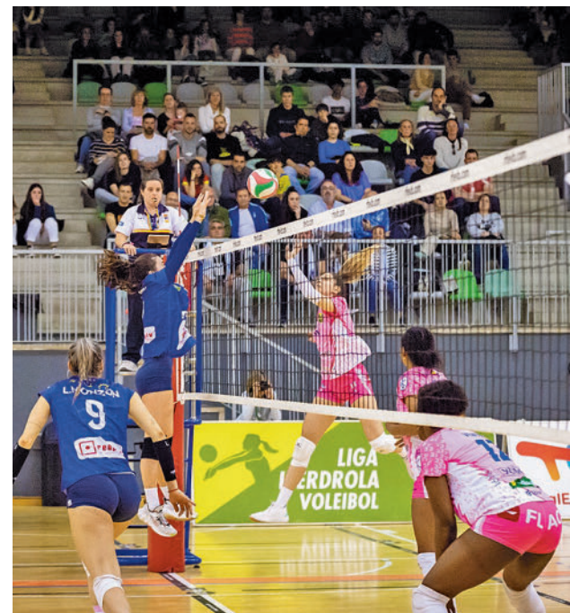
El Madrid Chamberí cayó ante el Kiele Socuéllamos

También habrá duelo entre canarias y madrileñas en el Pabellón Miguel Solaesa, escenario de un choque entre los dos últimos clasificados, el Heidelberg Volkswagen y el Madrid Chamberí TotalEnergies.