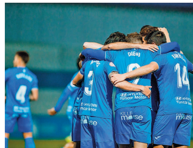
El Fuenlabrada sigue peleando por la permanencia

Los otros dos representantes madrileños, el Rayo Majadahonda y el Real Madrid Castilla, se verán las caras con el Racing de Ferrol y el Mérida, respectivamente.