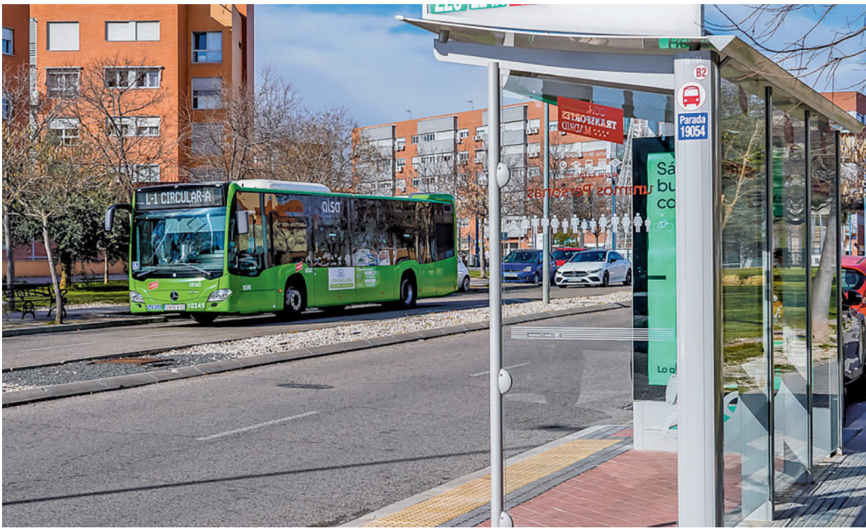
Imagen de una nueva parada de autobús AYTO. TORREJÓN