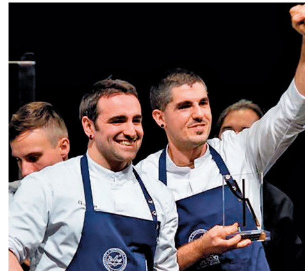
Los premiados recogiendo el galardón MADRID FUSIÓN