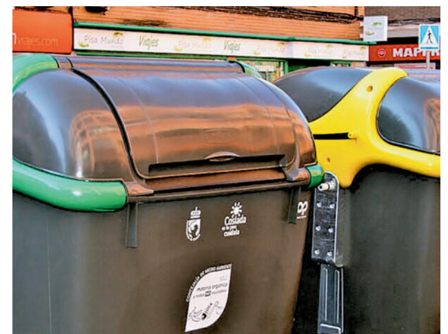
Contenedores de basura de Coslada