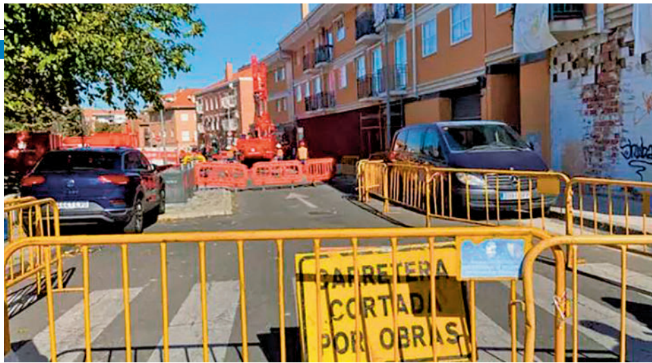
Obras en la 'zona cero' de San Fernando de Henares