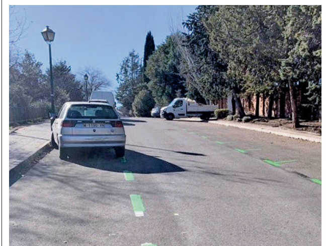
Cambios en varios barrios de Alcobendas

Los proyectos presentados en esta VII Edición han sido 15, con una participación de siete colegios, dos institutos y el Centro de Educación Permanente de Adultos (CEPA). En este curso escolar el presupuesto para los citados premios ha subido de 20.000 a 25.000 euros, debido a la apuesta del Ayuntamiento por la mejora y la evolución de las prácticas educativas, adaptándose a las necesidades cambiantes de la educación del siglo XXI.