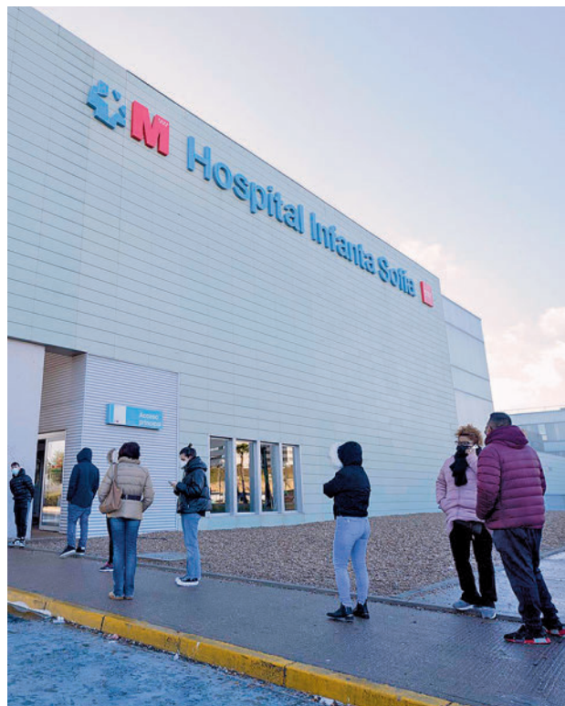
El proyecto tiene una inversión de 8,7 millones

En relación a ello, fuentes de la Consejería de Sanidad precisaron a Europa Press que en el plazo de tres meses está prevista la licitación de la obra y se abrirá el proceso de adjudicación. Este proyecto tiene una inversión de 8,7 millones de euros desde el Ejecutivo regional y su finalización está prevista para el verano de 2024, ya que la previsión actual es que los trabajos se desarrollen durante seis o siete