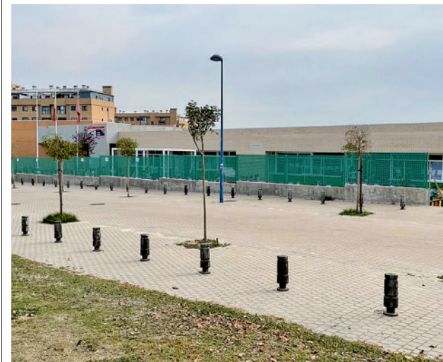
Colegio Gabriela Morreale