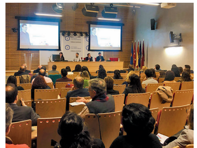
Imagen del primer Encuentro

Con este evento, la Red de Empleo de Leganés busca seguir fomentando la inserción de las personas en riesgo de exclusión social en las empresas de la ciudad. La Red de Empleo, creada en el año 2001, es una mesa que reúne a las distintas áreas municipales, colectivos y asociaciones que trabajan en materia de empleo en Leganés.