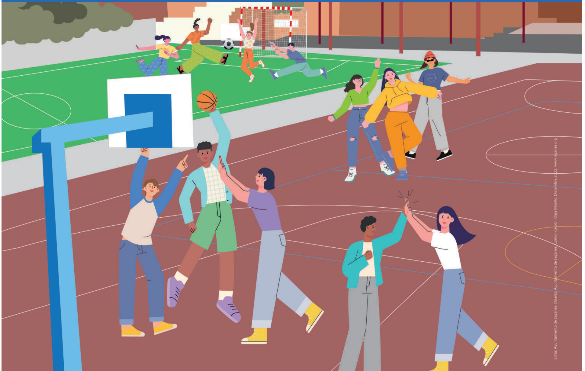
Edita: Ayuntamiento de Leganés. Diseño: Ayuntamiento de Leganés. Comunicación: Olga Morillo. Diciembre 2022. www.leganes.org

Entra y utiliza los PATIOS Y PISTAS EXTERIORES de los colegios