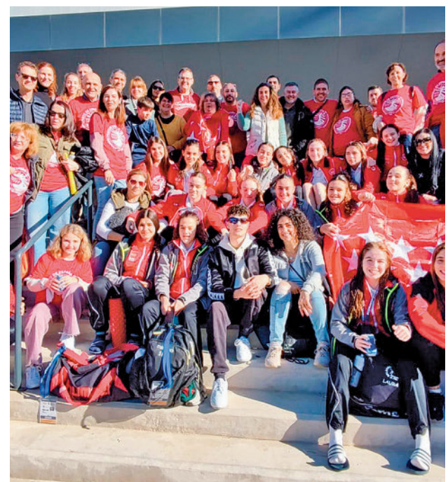
Foto de familia de los convocados

El otro metal lo aportó la selección infantil masculina, que tras caer en semifinales ante Comunidad Valenciana supo pasar página para superar en la final de consolación a Andalucía.