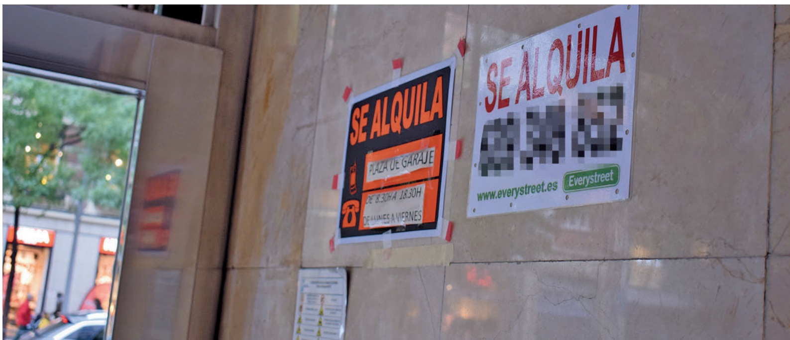
Viviendas de alquiler en Madrid capital GENTE