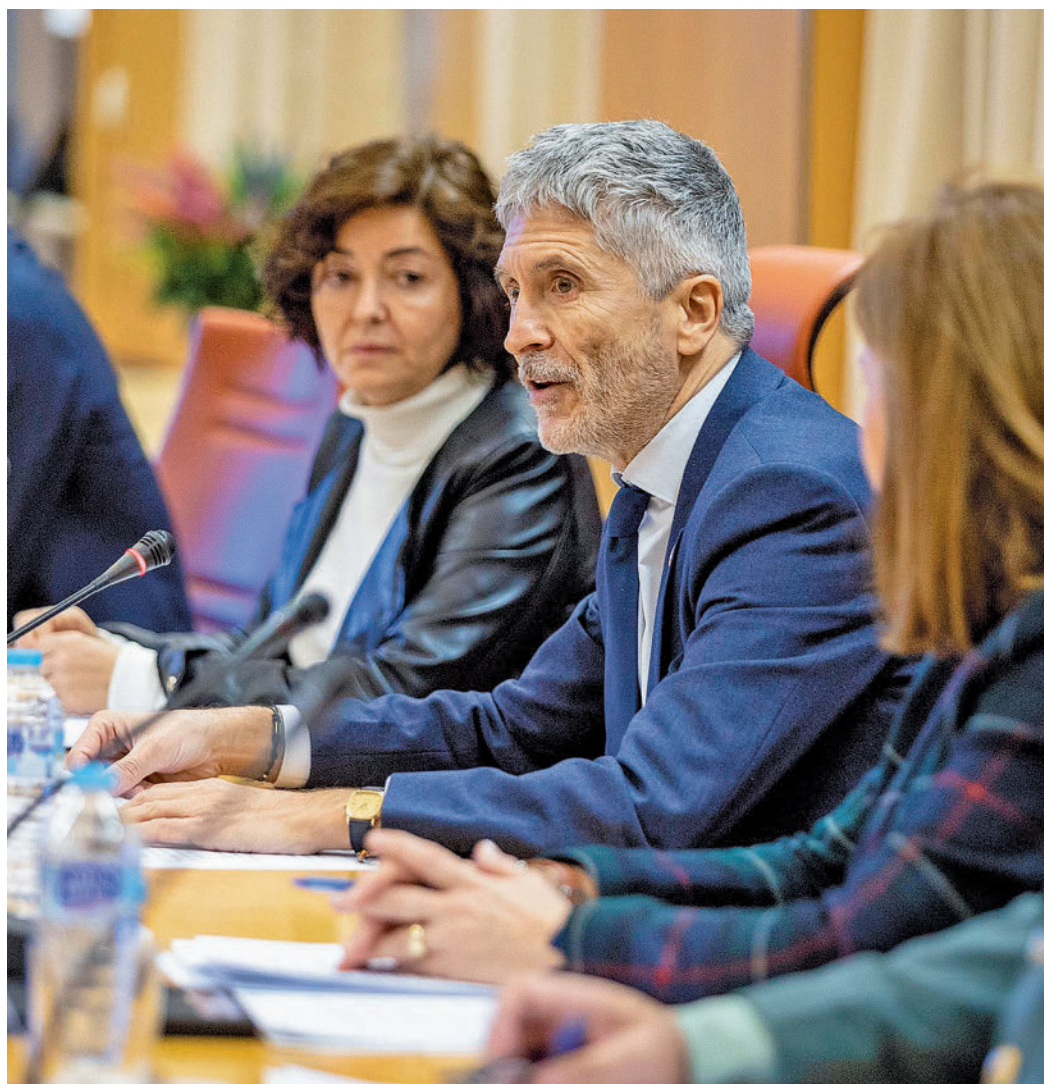
Fernando Grande Marlaska, durante la presentación del informe

Los peatones fallecidos han aumentado, 126 en 2022 frente a los 118 de 2019. Más de la mitad de ellos fueron en autopistas y autovías (58, cinco más que en 2019); más de tres