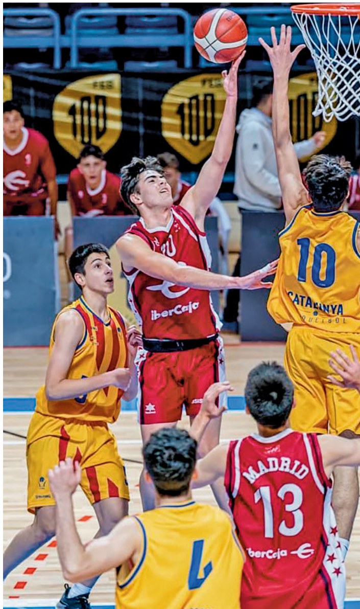
Un momento de la final de categoría cadete FBM

de toda la región. Entre todos estos éxitos brilla con luz propia el triunfo de la selección cadete masculina. Después de superar la primera fase con gran holgura (solo Galicia puso en aprietos a los madrileños), con victorias como la lograda ante Extremadura por 64-14, en cuartos de final los chicos convocados por Gorka González de Mendoza dieron buena cuenta de Baleares, a la que se imponían por un concluyente 105-59. Más sufrido fue el partido