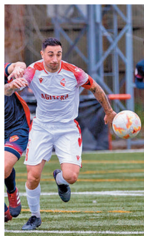
El Ursaria goleó al Torrejón

Por el momento, la zona de 'play-off' la ocupan el RSC Internacional, el Getafe B, el Trival Valderas y el Móstoles URJC, mientras que en descenso están el Fuenlabrada Promesas, el Canillas y el Aranjuez.