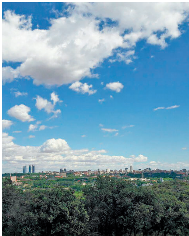
La capital vista desde el pulmón verde de la Casa de Campo

El primer edil aseguró que, de las 231 medidas contempladas, el 60% están completadas y el 30% están en curso. Almeida añadió que su aplicación ha permitido que el valor medio en las 24 estaciones de calidad del aire se haya situado en 2022 en 28,29 µg/m3, lo que representa un 22,7% menos que en 2018, último año que ha considerado la Unión Europea para emitir la sentencia en la que