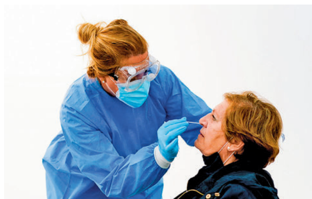
Test rápido de covid-19

La Consejería de Sanidad recomienda la realización de test rápidos frente a la covid y la gripe A y B en las Urgencias en aquellos pacientes que acudan con infección respiratoria aguda y tengan criterios