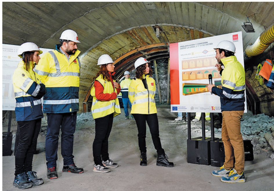
Visita de Isabel Díaz Ayuso a las obras de la Línea 3

Transportes espera que esta infraestructura, que tiene un