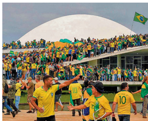
Brasil, escenario de diversos disturbios

EL PERIÓDICO GENTE NO SE RESPONSABILIZA NI SE IDENTIFICA CON LAS OPINIONES QUE SUS LECTORES Y COLABORADORES EXPONGAN EN SUS CARTAS Y ARTÍCULOS