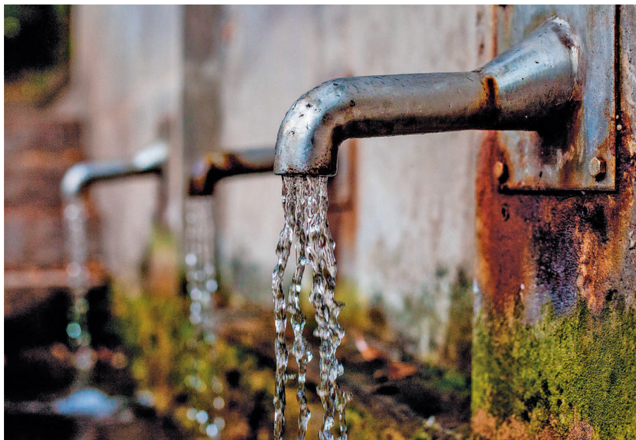
Cerrar los grifos y acortar las duchas son algunas de las medidas de ahorro que se pueden tomar

UN EDIFICIO NUEVO PERMITE UN AHORRO DE HASTA UN 40% DE AGUA