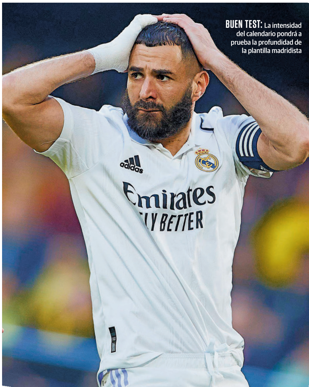
BUEN TEST: La intensidad del calendario pondrá a prueba la profundidad de la plantilla madridista

Antes de cerrar el mes de enero, regresará al Santiago Bernabéu, un estadio en el que no juega desde el 10 de noviembre (triumfo 2-1 ante el Cádiz) para medirse a la Real Sociedad, equipo que actualmente es tercero en la clasificación. La despedida del