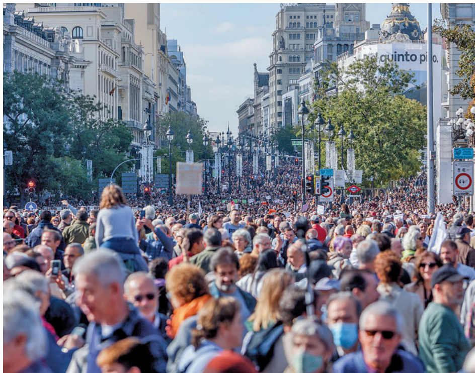
Protesta a favor de la sanidad pública