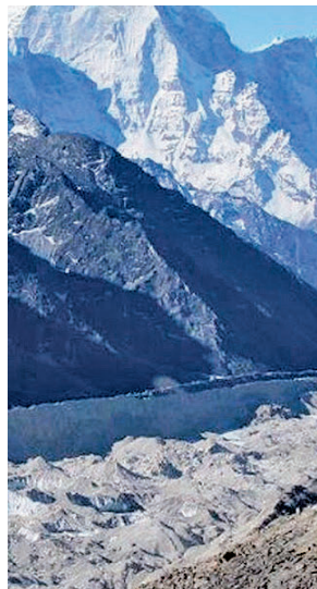
Glaciar en el Himalaya

para 2100. El trabajo, que publica Science, mostró que el mundo podría perder hasta el 41% de su masa total de glaciares este siglo, o tan solo el 26% dependiendo de los esfuerzos de mitigación del cambio climático. De