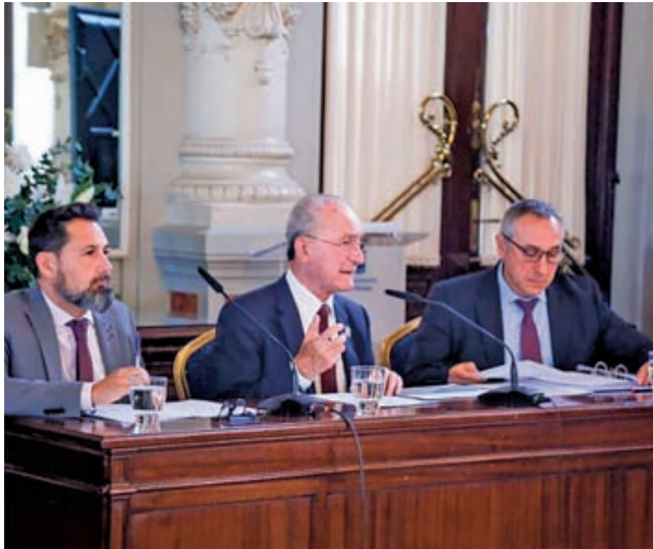
El alcalde de Málaga (centro), durante la presentación del plan AYTO. MÁLAGA

El plan establece tres objetivos: facilitar el acceso a una vivienda digna; fomentar la calidad de edificación y medio ambiente urbano; y evitar la vulnerabilidad urbana y residencial. Para su consecución se han elaborado 24 programas a financiar entre el Ayuntamiento, la Junta de Andalucía, el Gobierno y el sector privado. En el primer eje se incluye la acción de las instituciones para facilitar el acceso a una vivienda digna (en alquiler y en venta) a través del impulso de programas para la disposición en el mer-