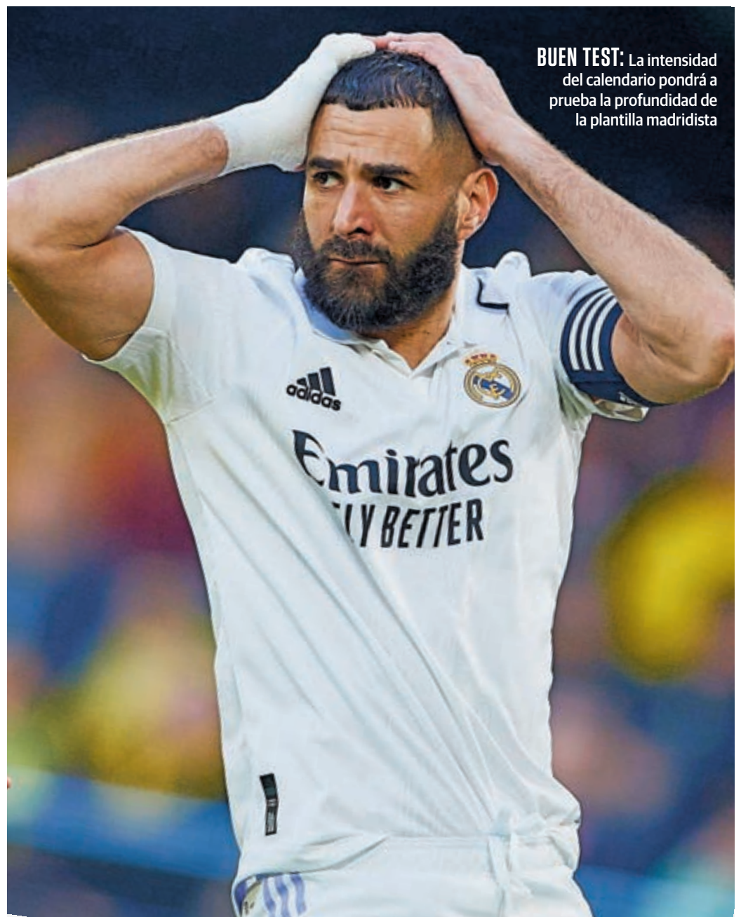
BUEN TEST: La intensidad del calendario pondrá a prueba la profundidad de la plantilla madridista

Antes de cerrar el mes de enero, regresará al Santiago Bernabéu, un estadio en el que no juega desde el 10 de noviembre (triumfo 2-1 ante el Cádiz) para medirse a la Real Sociedad, equipo que actualmente es tercero en la clasificación. La despedida del