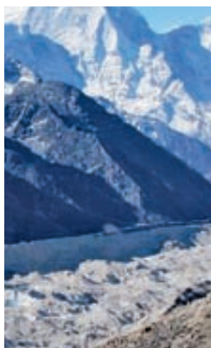
Glaciar en el Himalaya E.P.

2100. El trabajo, que publica Science, mostró que el mundo podría perder hasta el 41% de su masa total de glaciares este siglo, o tan solo el 26% dependiendo de los esfuerzos de mitigación del cambio climático. De manera especifi-