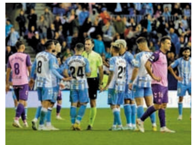
El Málaga sigue metido en problemas

sábado a las 18:30 horas. En El Sardinero se verán las caras el Racing de Santander, quien abre ahora mismo la zona de descenso, con un Sporting que sigue huyendo del descenso, al mismo tiempo que se ilusiona con hacer algo grande en la Copa del Rey. Recibirá la semana que viene al Valencia en los octavos de final.