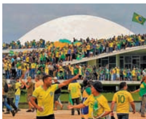
Brasil, escenario de diversos disturbios

EL PERIÓDICO GENTE NO SE RESPONSABILIZA NI SE IDENTIFICA CON LAS OPINIONES QUE SUS LECTORES Y COLABORADORES EXPONGAN EN SUS CARTAS Y ARTÍCULOS