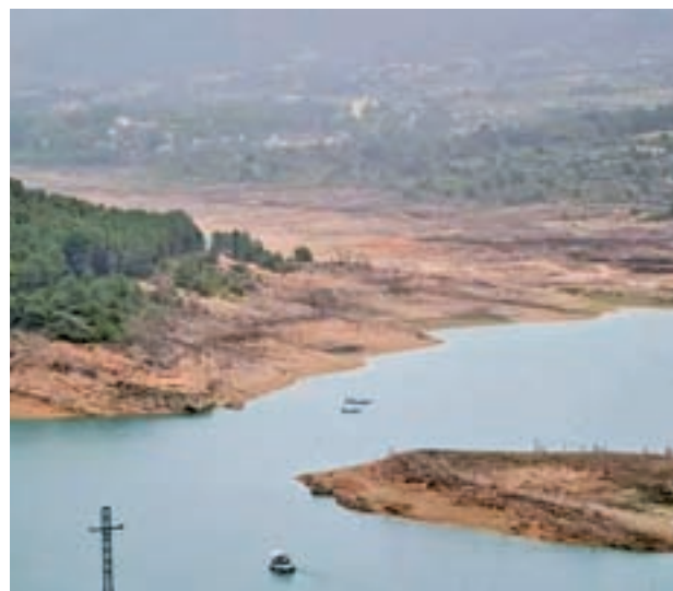
Estado de los embalses: La reserva hídrica de España se encuentra al 47,2% de su capacidad total. En comparación con la media de los últimos diez años, está siete puntos por debajo. Pese a las lluvias de diciembre, su estado sigue siendo preocupante.

Ahorro A nivel individual, el gasto de agua por persona se puede