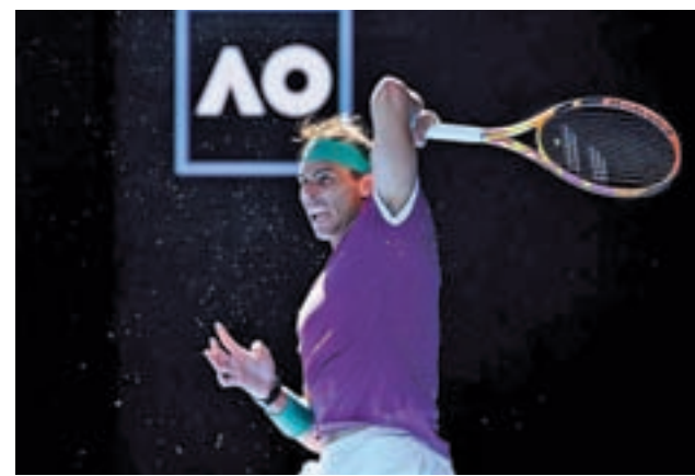
El balear busca su 'Grand slam' número 23

Al margen de la oportunidad de poder sumar su tercer Mundial, España tiene el aliciente de que el campeón obtiene un billete directo para los JJOO de París 2024, mientras que los que queden entre el segundo y el séptimo puesto se aseguran plaza en los preolímpicos.