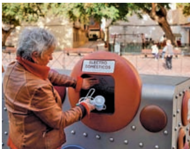
Una señora deposita un secador en el punto limpio AYTO. MÁLAGA

Cada distrito dispondrá de un punto, a excepción de Este, Carretera de Cádiz y Cruz de Humilladero, que dispondrán de dos unidades para responder a la demanda por su mayor población o extensión.