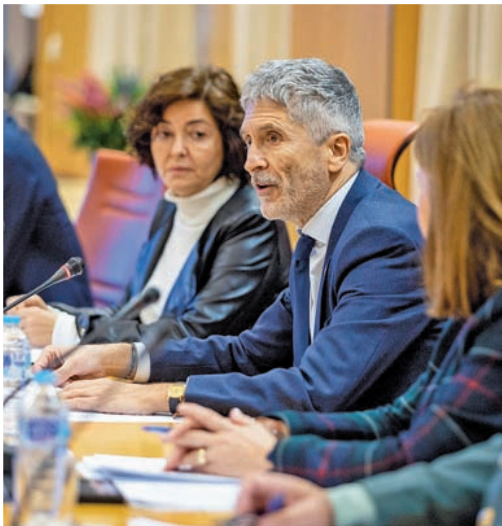
Fernando Grande Marlaska, durante la presentación del informe

Los peatones fallecidos han aumentado, 126 en 2022 frente a los 118 de 2019. Más de la mitad de ellos fueron en autopistas y autovías (58, cinco más que en 2019); más de tres