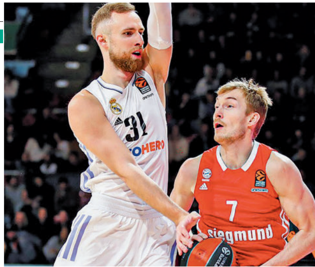
El Real Madrid llega tras dos partidos seguidos en Euroliga

Este Lenovo Tenerife-Real Madrid no será el único choque destacado de la jornada en la zona alta. El mismo