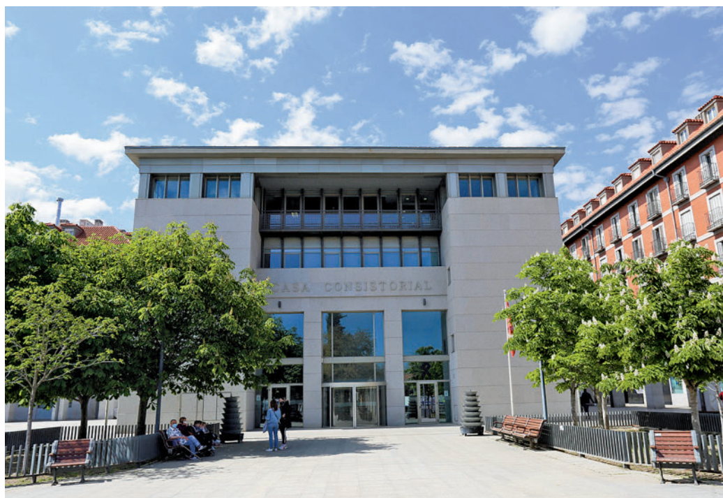
Ayuntamiento de Leganés

mantenimiento y mejoras de Bosquesur y Polvoranca (2 millones) y la rehabilitación de los juzgados (1 millón), también están incluidos en el montante total que ha desarrollado esta semana el candidato popular a la Alcaldía de Leganés.