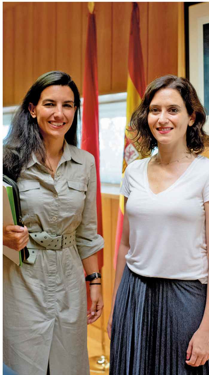
Monasterio y Ayuso, durante una reunión

Tras el cambio de postura de la formación ultraconservadora, llegó la reacción de la presidenta regional. "Lo que no voy a hacer es entrometerme en las decisiones de la Cámara", apuntó Isabel Díaz Ayuso, que descartó "retorcer el reglamento" para "justificar los errores de Vox" al presentar las enmiendas. Ayuso criticó que este partido haya "decidido distanciarse del PP y emprender por su cuenta una estrategia". Considera que lo sucedido responde "a errores de desconocimiento de la técnica parlamentaria" y a partir de ahí están "redactando un relato". "Habrán llamado incluso desde la Nacional para preguntar qué están haciendo en Madrid porque esto no tiene ni pies ni cabeza", añadió.