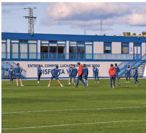
Instalación Deportiva de Butarque

Según los independientes, con esta comisión se busca "depurar responsabilidades" por un expediente de concesión demanial que, a su juicio, "se aprobó un viernes de manera sorpresiva y clandestina en una Junta de Gobierno donde ese mismo día se vio