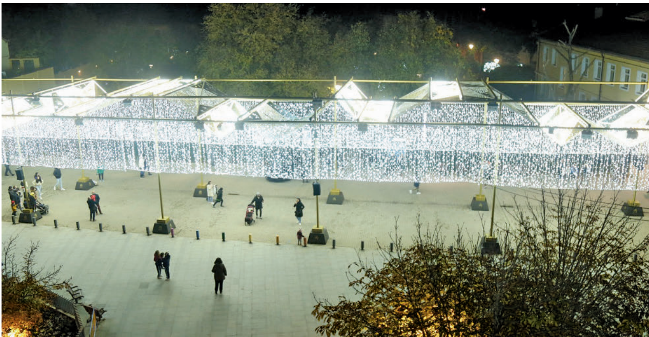
Túnel de luces en el centro de Leganés