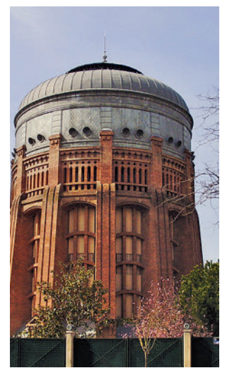
Canal de Isabel II