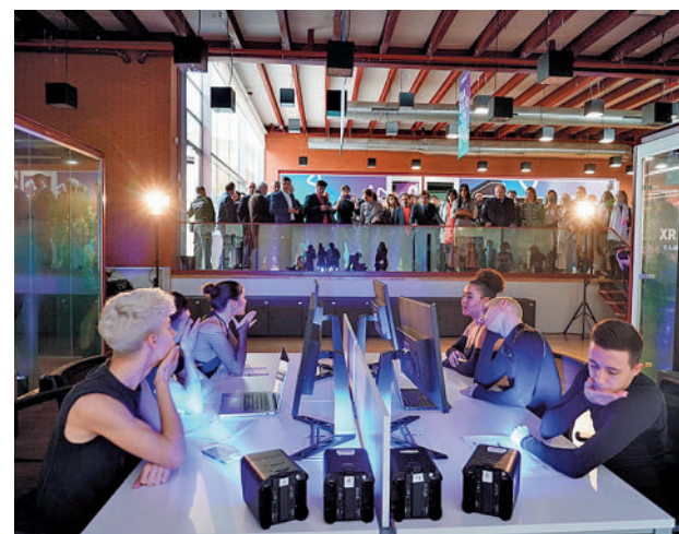
Madrid in Game

Otro de los pilares de Madrid in Game es el Clúster del Videojuego, compuesto por casi 70 empresas que trabajan dentro y fuera del campus