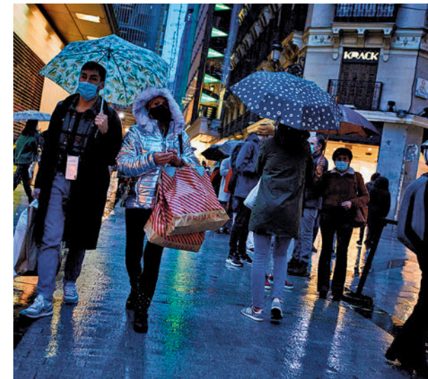
Los españoles han perdido capacidad de ahorro

La situación ha provocado un endurecimiento de las condiciones financieras que afectan a las hipotecas. En este sentido, el 23% de los españoles está pensando en cambiar su hipoteca a tipo fijo por el miedo a no poder pagarla y siete de cada diez no quieren cambiar su hipoteca actual por la incertidumbre de verse en una situación peor a la actual.