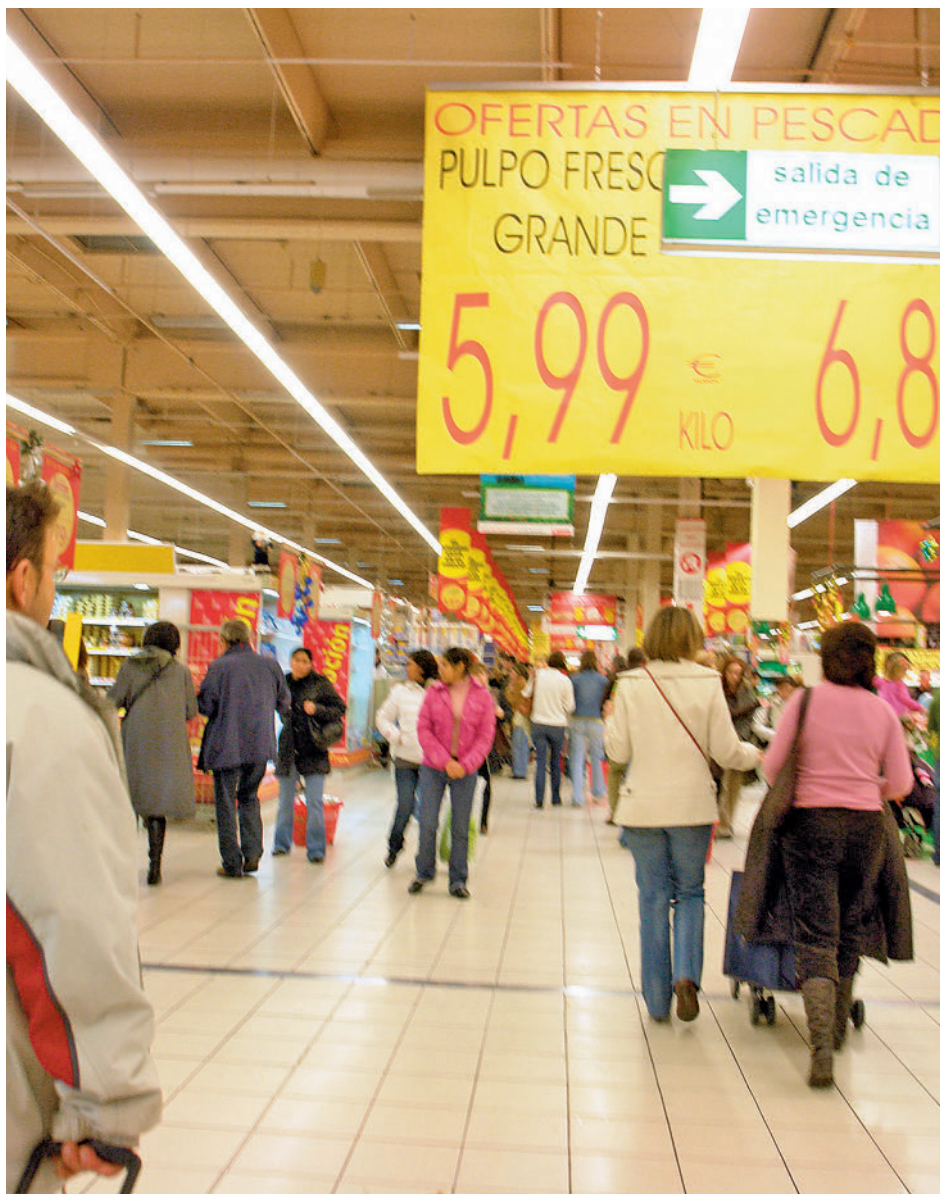
Las dificultades para llegar a fin de mes se han incrementado este año

La eficiencia energética en los hogares es todavía una tarea pendiente. En torno al 70% de los españoles no se plantea reformar su vivienda para hacerla más eficiente y