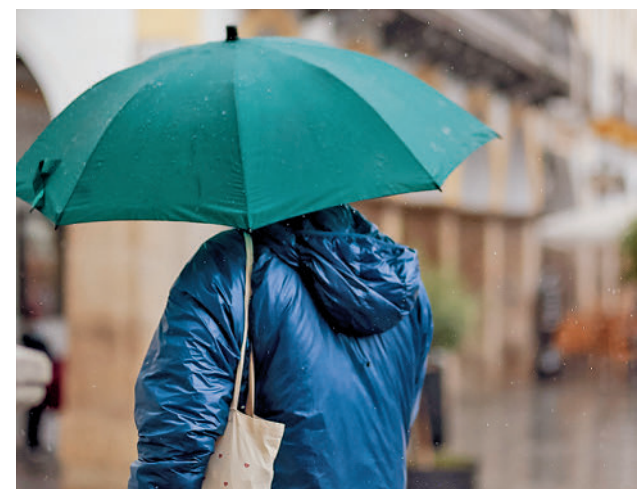
Las lluvias han barrido la península

Hay que remontarse ahora a 1994 para encontrar un año con cifras similares. En aquel momento, la reserva se situaba en un 35,8%, una cifra muy parecida a la de 28 años después. En aquellos ejercicios, 1994 y 1995, España vivía una de las sequías más destacadas desde que hay registros.