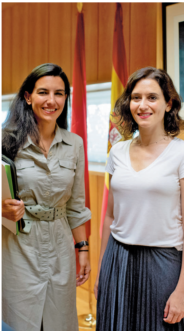
Monasterio y Ayuso, durante una reunión

Tras el cambio de postura de la formación ultraconservadora, llegó la reacción de la presidenta regional. “Lo que no voy a hacer es entrometerme en las decisiones de la Cámara”, apuntó Isabel Díaz Ayuso, que descartó “retorcer el reglamento” para “justificar los errores de Vox” al presentar las enmiendas. Ayuso criticó que este partido haya “decidido distanciarse del PP y emprender por su cuenta una estrategia”. Considera que lo sucedido responde “a errores de desconocimiento de la técnica parlamentaria” y a partir de ahí están “redactando un relato”. “Habrán llamado incluso desde la Nacional para preguntar qué están haciendo en Madrid porque esto no tiene ni pies ni cabeza”, añadió.