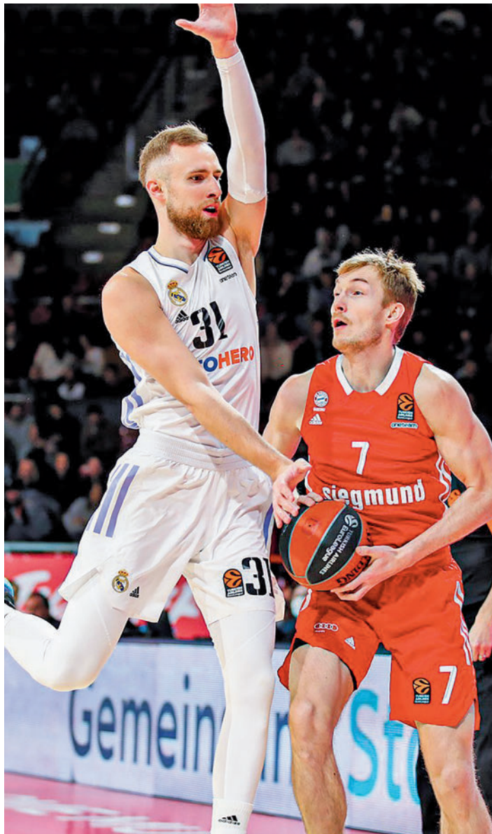
El Real Madrid llega tras dos partidos seguidos en Euroliga

Los argumentos de los canarios pasan por su fortaleza como locales, donde aún no conocen la derrota, su solidez defensiva (es el equipo que menos puntos encaja de toda la competición) y la aportación de un quinteto tan experto como consolidado: