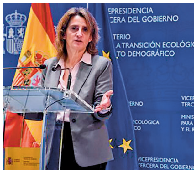
La ministra de Transición Ecológica, Teresa Ribera

ción de puntos de recarga. Según explicaron desde el Ministerio para la Transición Ecológica y el Reto Demográfico, el aumento en la dotación económica del plan se debe a que varias comunidades autónomas (Cantabria, Madrid, Asturias y Canarias) han superado ya el presupuesto que se les había asignado en este programa que estará vigente un año más,