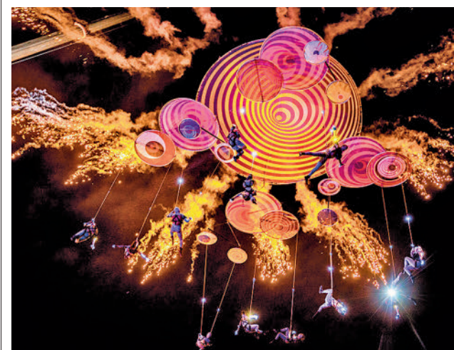
Uno de los espectáculos aéreos