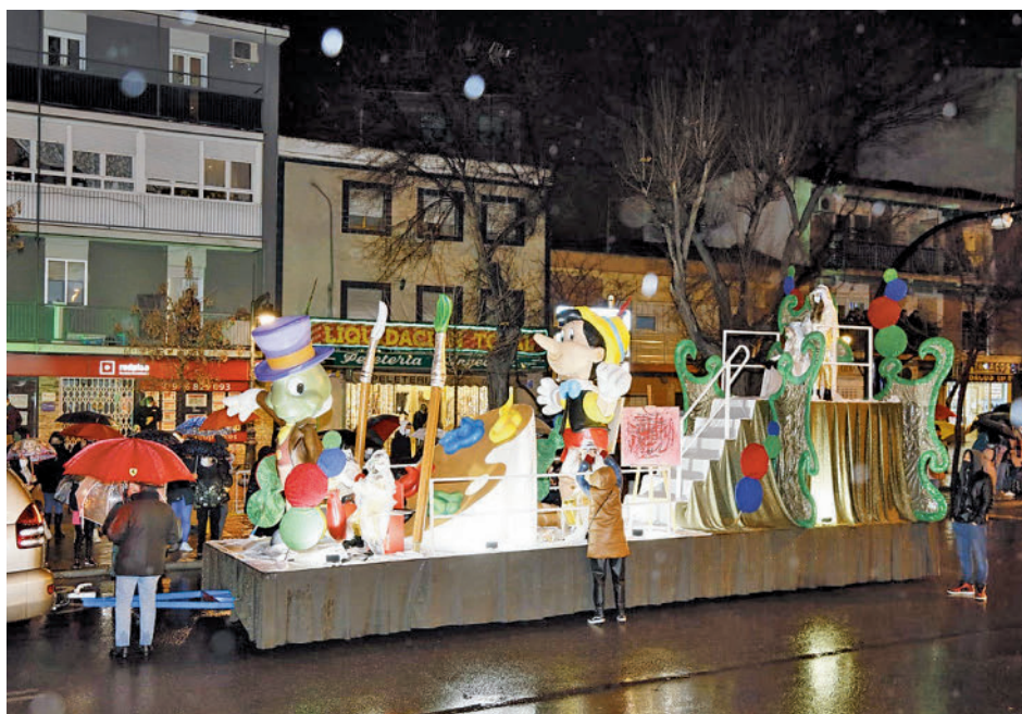
Cabalgata del año pasado en Getafe

La Cabalgata de Reyes del 5 de enero, por su parte, comenzará como es habitual en el polideportivo Juan de la