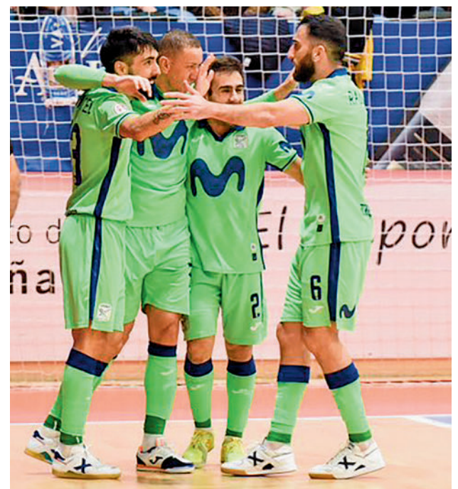
Importante victoria del Inter en Valdepeñas

A pesar de ello, los fuenlabreños tratarán de hacer valer su condición de locales para entrar en el pequeño maratón navideño con un margen más amplio, a la espera de enfrentamientos directos como el del 7 de enero con el Girona.