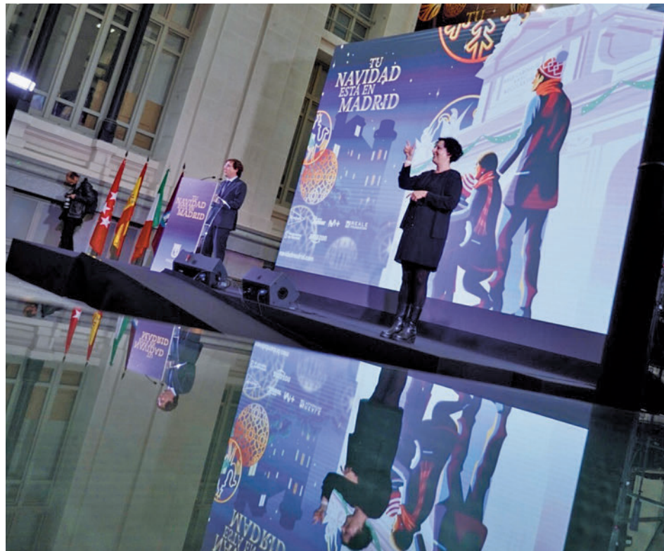
La intervención del alcalde en la presentación de la programación municipal

Además, continuará la tradición de felicitar las fiestas en la fachada de la sede municipal con un 'videomapping', diseñado por Eyesberg, con