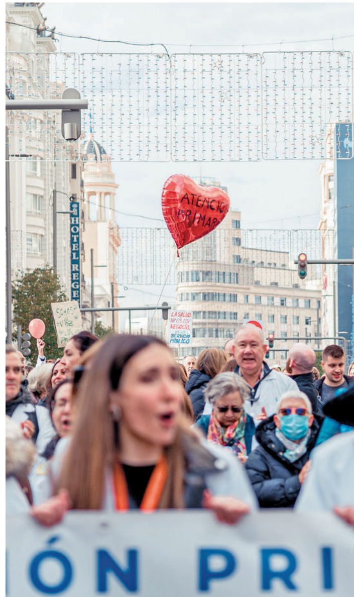
Protestas de los médicos en Madrid

El comité de huelga de Atención Primaria se encierra en la Consejería al acudir a una reunión ● Piden que el Gobierno regional ponga 42 millones de euros para acabar con los paros