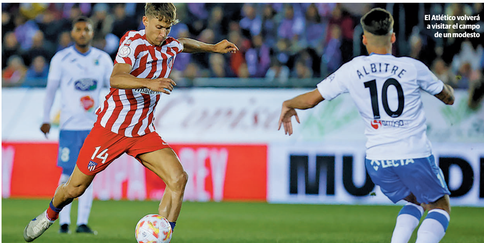
El Atlético volverá a visitar el campo de un modesto