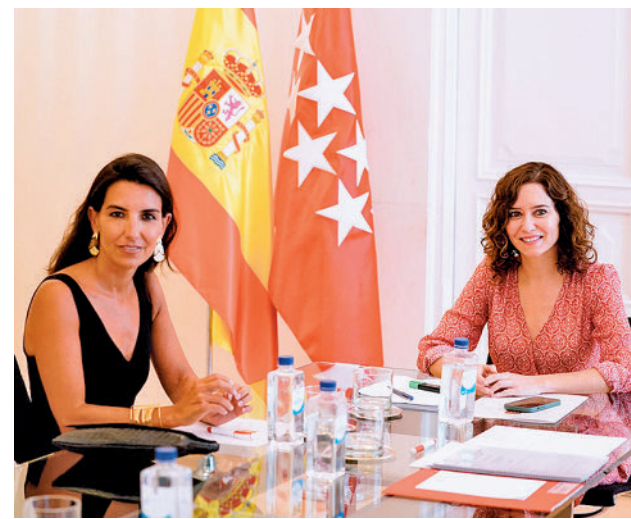
Rocío Monasterio e Isabel Díaz Ayuso