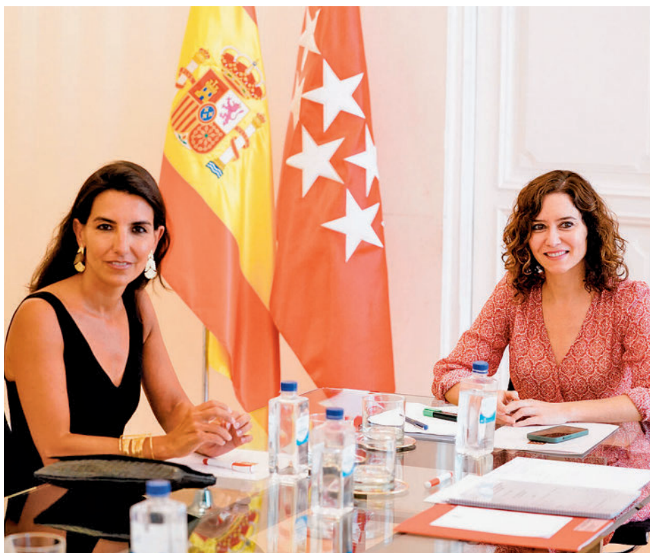
Rocío Monasterio e Isabel Díaz Ayuso, en una reunión

La presidenta de la Comunidad de Madrid, Isabel Díaz Ayuso, insistió en que Vox presentó fuera de plazo sus enmiendas y aseguró que "un tercio" de ellas tenían defectos técnicos y no se podrían haber tramitado incluso si hubieran llegado a tiempo.