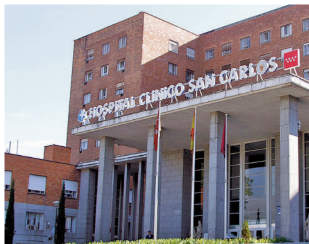
Hospital Clínico San Carlos

Consistirán en la creación de un apartado de Cirugía Mayor Ambulatoria (CMA) en el Bloque C, una nueva área de Oftalmología y la construcción de una planta de producción de frío. En total, se actuará en 10.768 me-