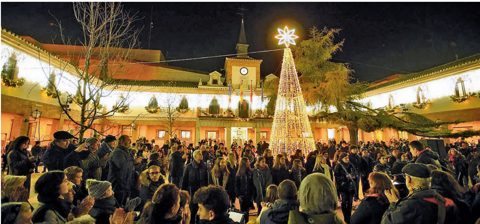
Encendido del alumbrado navideño de Las Rozas