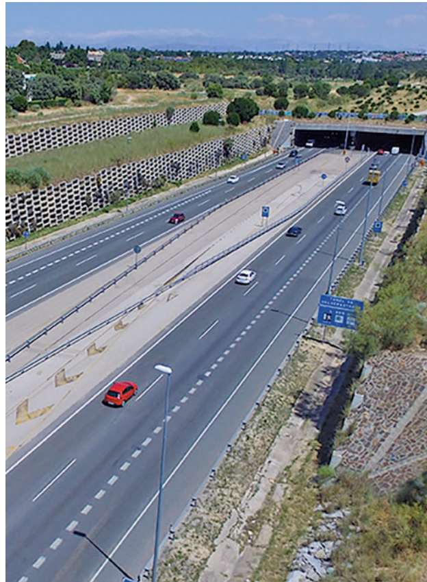
Carretera M-50 a su paso por Boadilla del Monte

Sin embargo, el Ministerio sí que indica que está trabajando en el proyecto de mejora del enlace de la M-50 con la carretera M-509 y la ampliación de la M-50 en el tramo comprendido entre los enlaces de la M-509 y la carretera M-503, así como la adecuación de la vía de servicio en la zona de Las Rozas, con