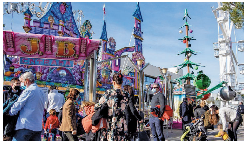
Zona de atracciones de Pozuelo

El Mercado de la Navidad es otra de las propuestas. Casi una veintena de puestos de comercios se instalarán en el Bulevar de la Avenida de Europa del 9 al 18 de diciembre. Otra de las citas esperadas en estas fechas es el Tren de la Navidad que arrancará el 22 de diciembre y circulará hasta el 6 de enero. Su recorrido empezará y finalizará en la zona navideña.