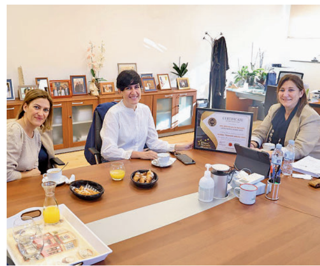
La alcaldesa, junto a la profesora

Toda la actualidad de la zona Noroeste, en nuestra web