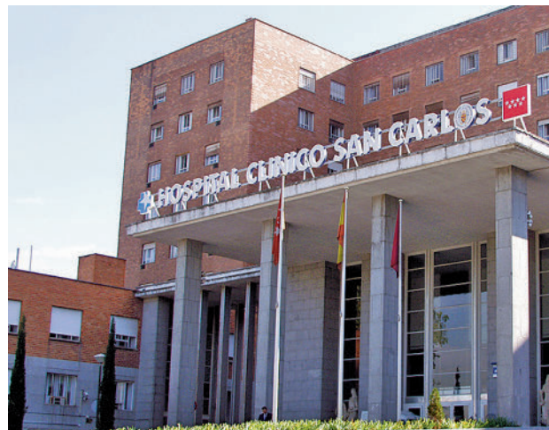
Hospital Clínico San Carlos

Consistirán en la creación de un apartado de Cirugía Mayor Ambulatoria (CMA) en el Bloque C, una nueva área de Oftalmología y la construcción de una planta de producción de frío. En total, se actuará en 10.768 me-