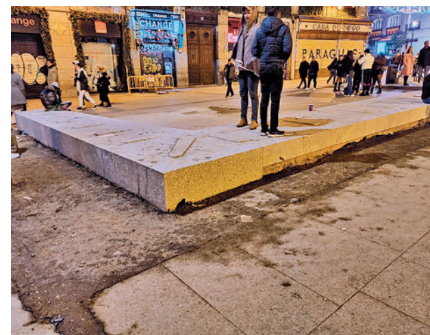
Estado de una de las zonas de la Puerta del Sol MAS MADRID

"Se ha hecho un esfuerzo para adelantar la apertura, no se ha improvisado y es un guiño a comerciantes, que desde marzo aguantan las obras de Sol", argumenta el primer edil.