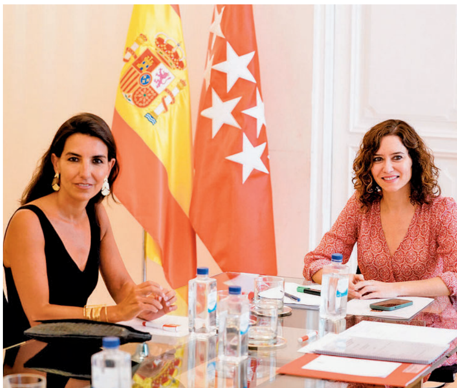
Rocío Monasterio e Isabel Díaz Ayuso, en una reunión

La presidenta de la Comunidad de Madrid, Isabel Díaz Ayuso, insistió en que Vox presentó fuera de plazo sus enmiendas y aseguró que "un tercio" de ellas tenían defectos técnicos y no se podrían haber tramitado incluso si hubieran llegado a tiempo.