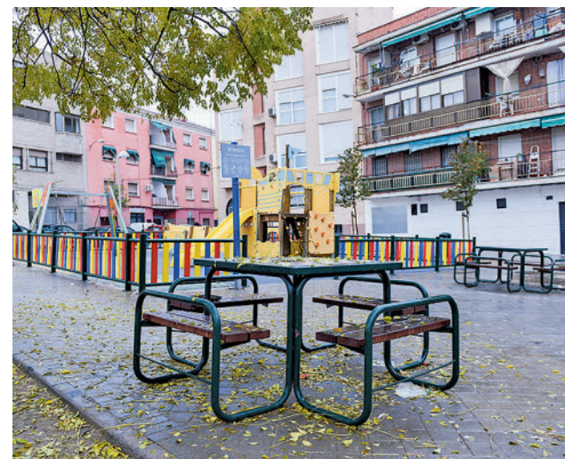
Siguen registrándose enfrentamientos entre bandas