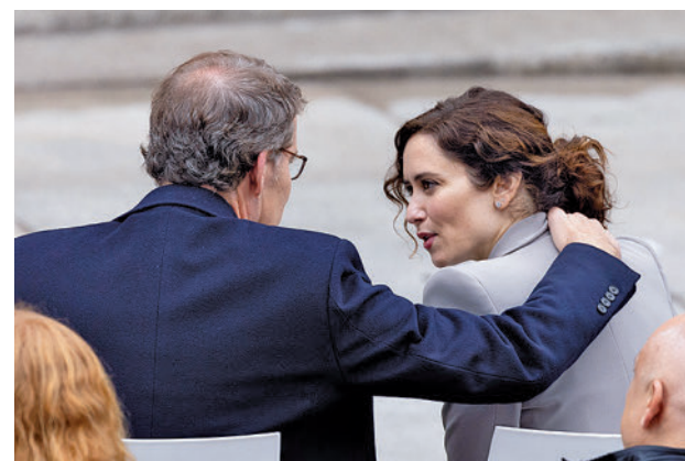
Alberto Núñez Feijóo e Isabel Díaz Ayuso

otro), las declaraciones que más repercusión tuvieron fueron las de la presidenta de la Comunidad de Madrid, Isabel Díaz Ayuso, que pidió que haya un cambio de Gobierno en 2023, ya que entiende que de no haberlo puede llegar el "último capítulo del libro que se empezó a construir en 1978" y que llegarán "situaciones como consultas o tensión entre regiones".