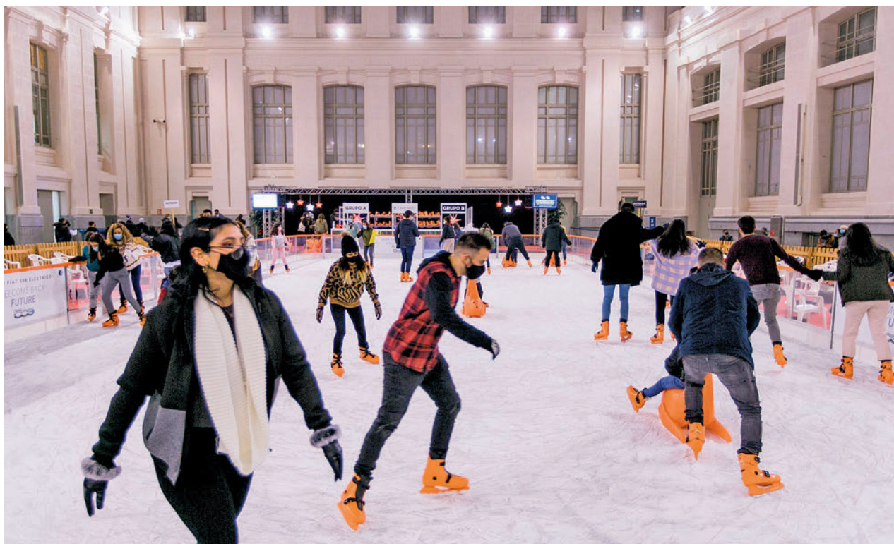
La pista instalada en la Galería de Cristal del palacio de Cibeles