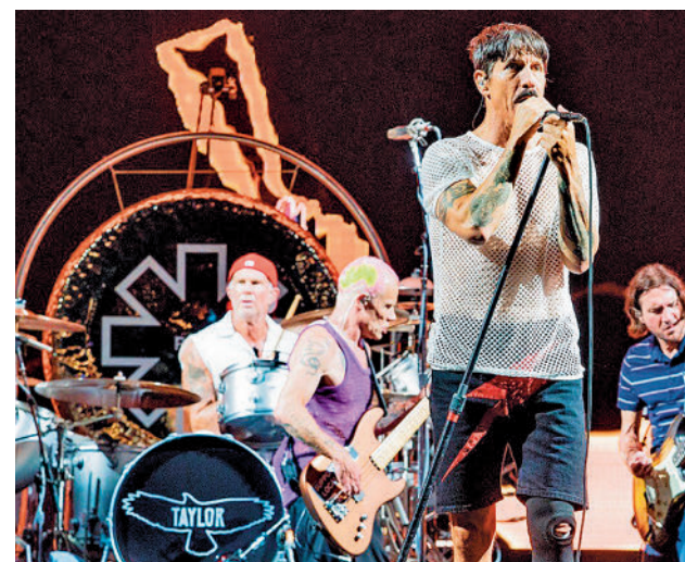
Red Hot Chili Peppers pasará por la capital

A modo de carta de presentación, la banda jerezana ha lanzado dos singles, 'El límite' y 'Qué te puedo dar', esta última una bofetada a la conciencia social en relación a la indigencia, canciones que le han valido a Flecha Valona excelentes comentarios por parte de la crítica especializada, aunque, lejos de fijarse en eso, el grupo aspira a otra meta: "Me conformo con formar parte del panorama musical español, pero sobre todo que nuestras canciones estén en la atmósfera de muchas familias".