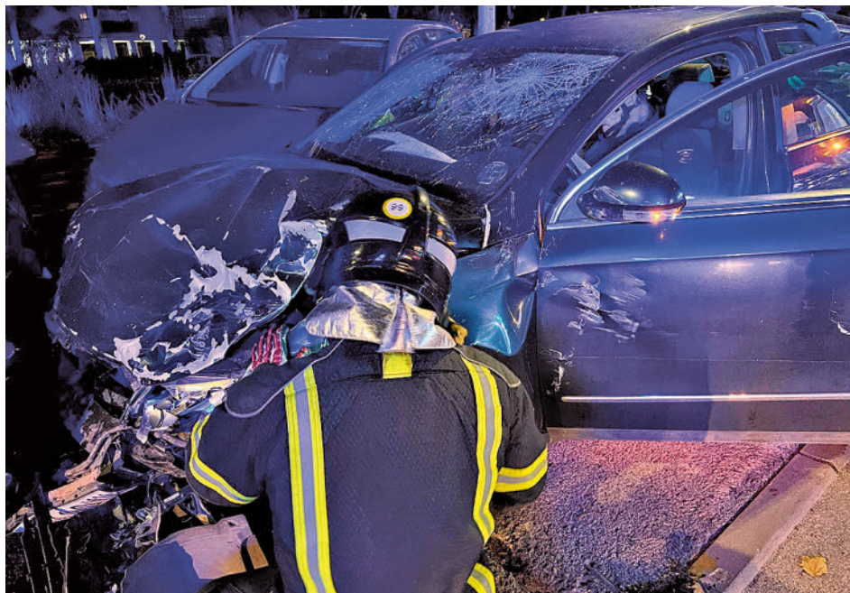
Estado de uno de los vehículos tras el accidente

ve. El conductor de ese segundo coche ha sido enviado a prisión por el juez acusado de la comisión de dos delitos de homicidio por imprudencia grave, un delito de lesiones por imprudencia grave (a la espera de la evolución médica de la menor), un delito de conducción bajo la influencia de bebidas alcohólicas y drogas y un quinto delito de conducción temeraria. El autor de los hechos fue detenido en el momento y dio positivo en las pruebas de drogas y alcohol que se rea-