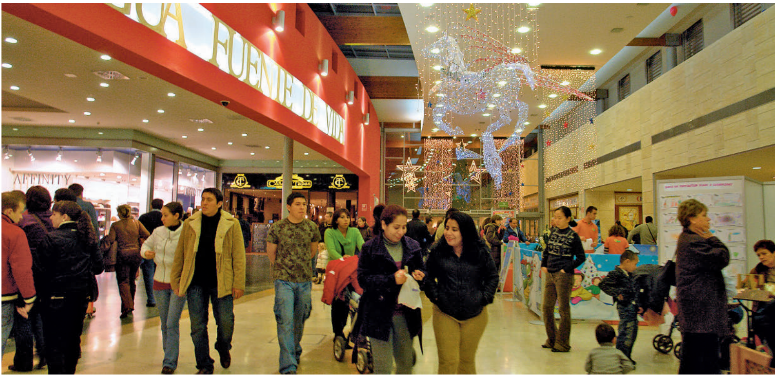
La cantidad de dinero que los españoles destinan a esta Navidad podría descender