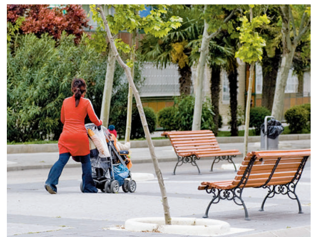
La natalidad bajó el año pasado

Al mismo tiempo, el informe señala que cuando fueron concebidos casi todos los nacidos en 2021 (de abril de 2020 a abril de 2021), se estaba viviendo una "abrupta" caída de la economía y un incremento del paro real. Según el informe, después se siguieron concibiendo hijos a un ritmo normal.