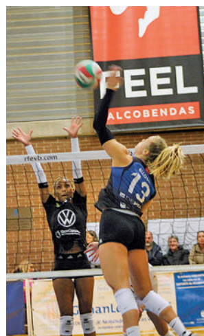
Victoria del Depol Feel

Por su parte, el Madrid Chamberí TotalEnergies visitará la pista del Kiele Soceúllamos.