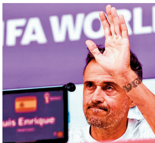
Luis Enrique se ha pasado a Twitch

EL PERIÓDICO GENTE NO SE RESPONSABILIZA NI SE IDENTIFICA CON LAS OPINIONES QUE SUS LECTORES Y COLABORADORES EXPONGAN EN SUS CARTAS Y ARTÍCULOS