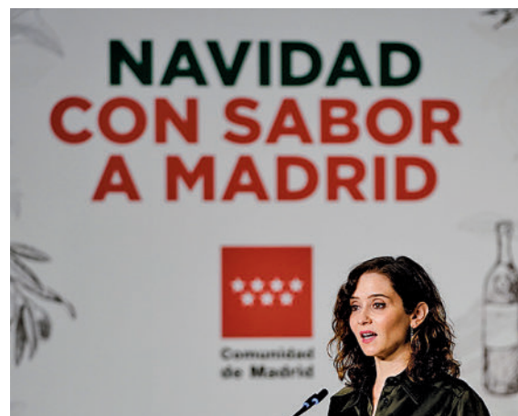
Presentación del pasado año

Tenemos el mejor café de España. Creemos que el café viene de Italia porque los italianos lo venden muy bien a nivel de imagen, pero solo se dedican a transformar el producto. También tenemos la mejor bollería de España, el mejor mercado de pesca sin tener mar, hemos hablado de los vinos, también sucede lo mismo con las cervezas gracias a empresas que han hecho espabilar a las compañías más grandes, tenemos unos quesos sensacionales, miel estupenda... La pregunta es qué no tenemos en la Comunidad de Madrid para una cena o comida de Navidad. Se puede llenar cualquier mesa con productos madrileños, de cercanía y con escasa huella de carbono.