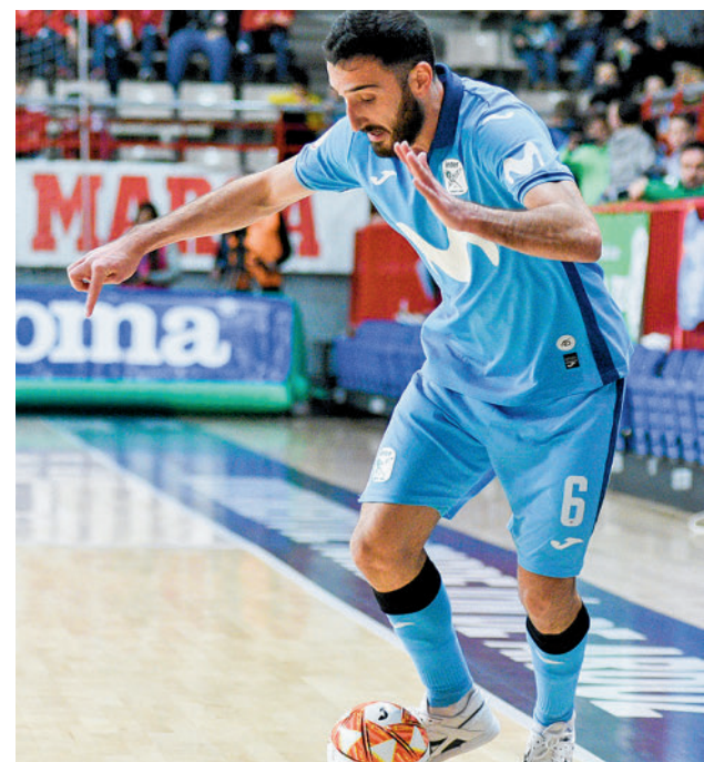
Nuevo triunfo del Inter HELEN BOTO / INTER MOVISTAR