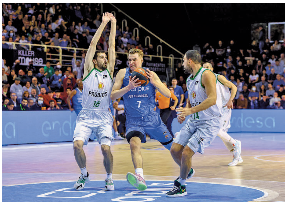
El Carplus no pudo con el Joventut B. FUENLABRADA

Hablando de la competición europea, la semana que viene, el jueves 8 de diciembre, el Real Madrid recibirá (21 horas) al Mónaco, un equipo que tiene a Mike James como gran estrella.