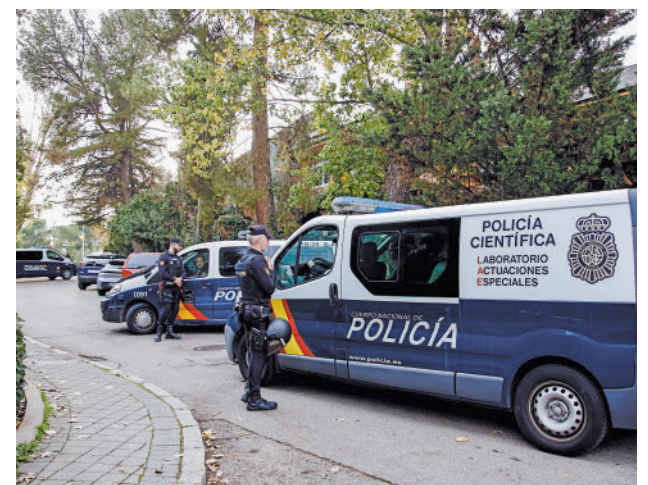
Dispositivo policial en la embajada de Ucrania en Madrid

La caja despertó sospechas después de ver que no tenía remitente, por lo que llegó hasta el jefe de seguridad. Este decidió abrirla en el patio por seguridad y al hacerlo escuchó un 'clíc' que le hizo lanzarla lejos. La deflagración le provocó pequeñas heridas en el dedo anular de la mano derecha, pero el empleado se desplazó por su propio pie al Hospital.