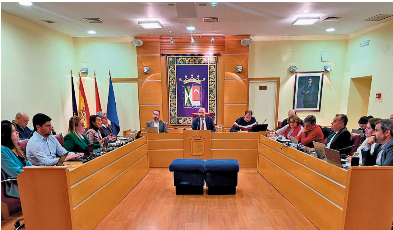
Pleno de Colmenar Viejo en el que se aprobaron los presupuestos