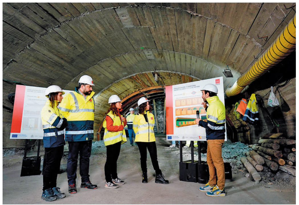
Díaz Ayuso, durante su visita a las obras

entrada a la estación del túnel de línea y la losa de cubierta. “Se va a realizar un movimiento de tierras de más de medio millón de metros cúbicos, lo que equivale a rellenar un estadio como el Santiago Bernabéu”, detalló la jefa del Ejecutivo madrileño.