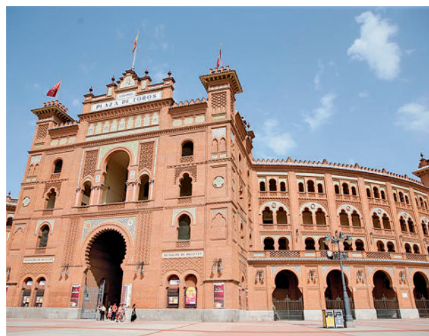
Plaza de toros de Las Ventas