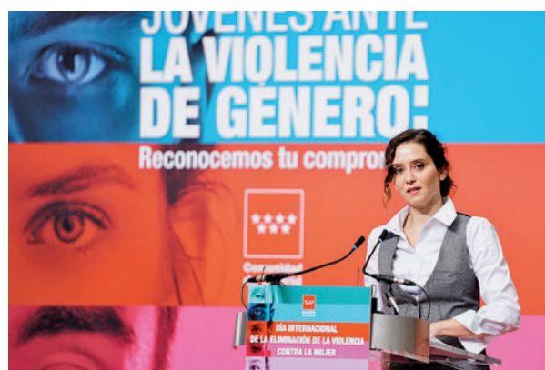
Isabel Díaz Ayuso, el pasado 25-N

El objetivo es mostrar "su solidaridad con la lucha que han emprendido en las últimas semanas con manifestaciones y reivindicaciones por todo Irán", según desveló el Gobierno regional. Durante el encuentro, que tendrá lugar en la Real