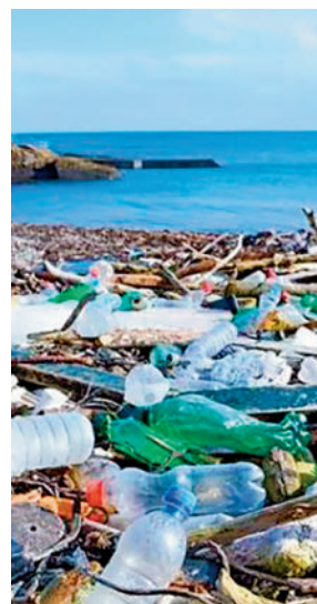
Plásticos en una playa

de los mismos. Los investigadores detallan en su estudio cómo el hecho de que las grandes compañías se centren en el reciclaje en lugar de en la reducción del plástico virgen hace que sus compromisos sean menos significativos. Se centraron en las 300 empresas más importantes de la lista Fortune 500 y descubrieron que el 72% se había comprometido a reducir.