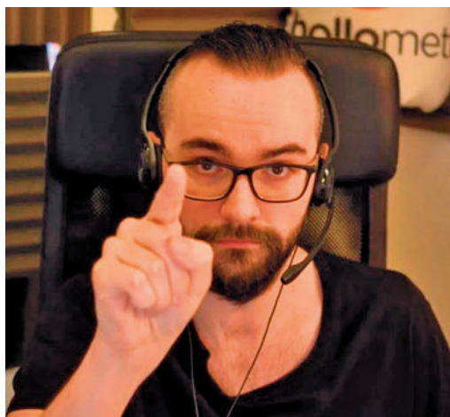
'Elxokas', protagonista de la semana

EL PERIÓDICO GENTE NO SE RESPONSABILIZA NI SE IDENTIFICA CON LAS OPINIONES QUE SUS LECTORES Y COLABORADORES EXPONGAN EN SUS CARTAS Y ARTÍCULOS