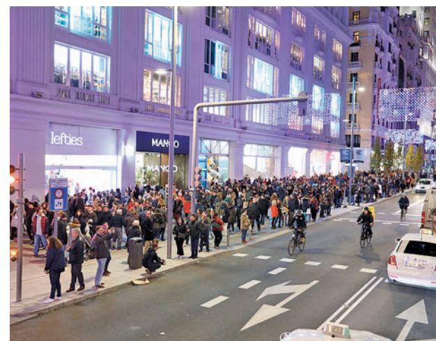
Las calles de Madrid se llenarán en diciembre

El mes de diciembre es uno de los más fuertes para el turismo regional, con especial influencia del Puente de la Constitución, donde se suele llegar al pico más alto.