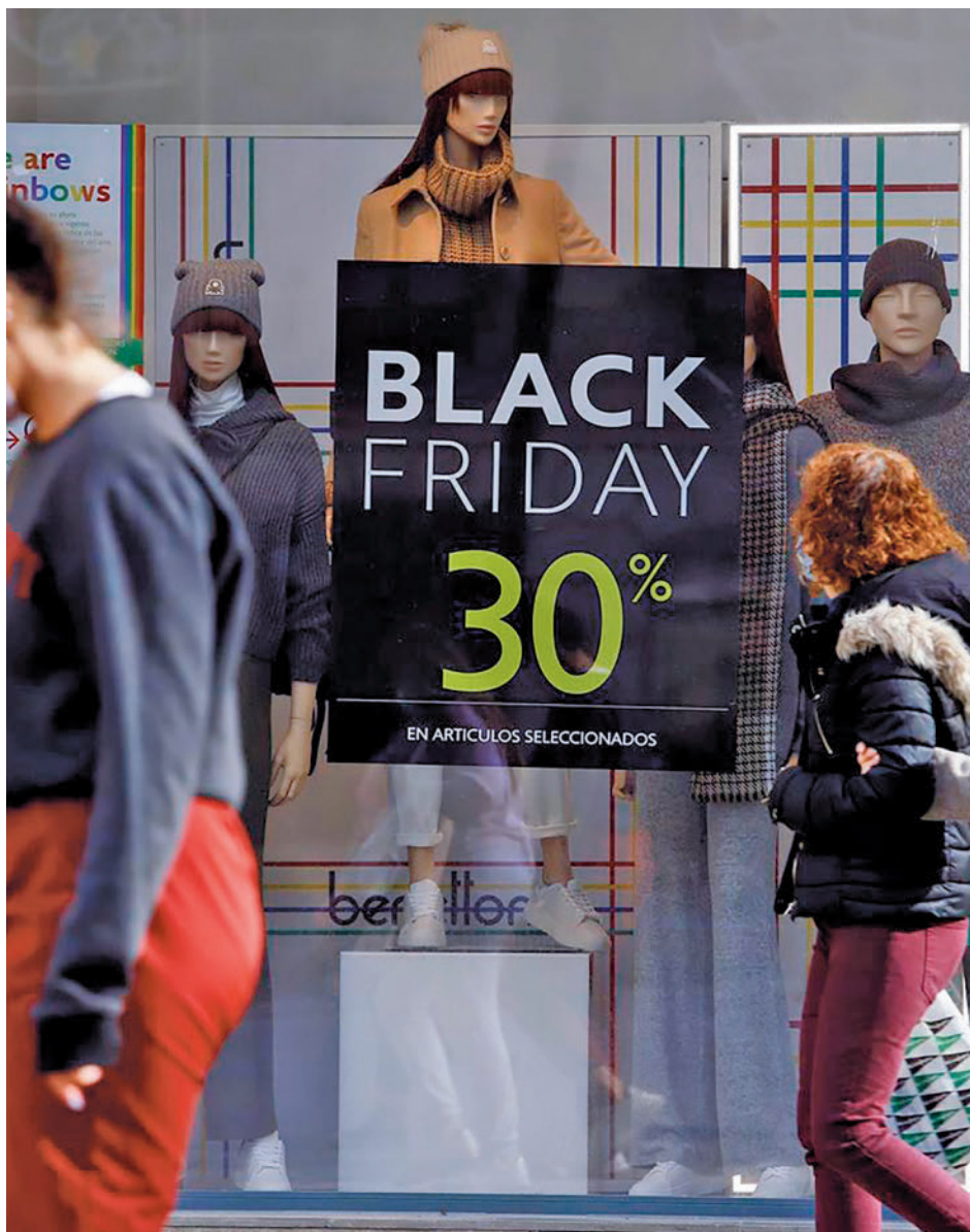
Comercios con descuentos por el Black Friday

Muchas son las teorías e historias sobre el origen del Black Friday, el día posterior a la celebración de Acción de Gracias (el cuarto jueves de noviembre). Aunque en un principio no tenía una visión consumista, entre los años 60 y 70 los comerciantes aprovecharon la gran afluencia de personas a las ciudades para realizar agresivas campañas de descuentos. Cincuenta años después, la costumbre se ha extendido por todo el mundo, incluido nuestro país.