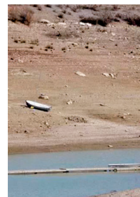
Embalse bajo mínimos E.P.

Según el boletín de las reservas hídricas de España elaborado por el Ministerio para la Transición Ecológica, los embalses contienen 18.444 hectómetros cúbicos (hm 3 ) de agua, muy por debajo de los 28.393 hm 3 de media por