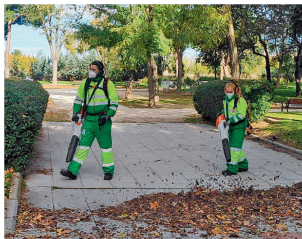
Dos trabajadores utilizan sopladoras para concentrar las hojas

La recogida de hoja será diaria de lunes a domingo, y