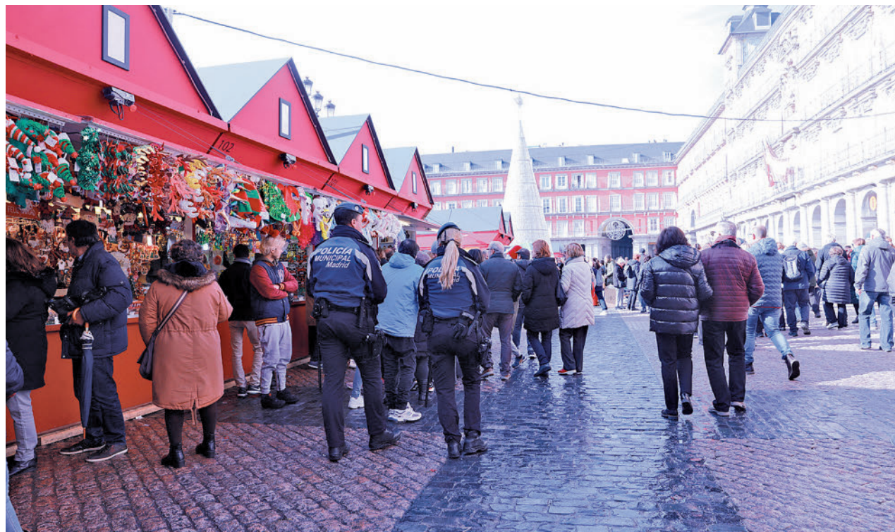
Agentes de la Policía Municipal patrullan a pie la Plaza Mayor

Al igual que en años anteriores, el Ayuntamiento restringirá el tráfico de vehículos pesados en la Gran Vía desde las 0 horas del 2 de diciembre hasta las 0 horas del 7 de enero, además de prohibir el estacionamiento de todo tipo de vehículos en horarios y espacios concretos en sus calles aleañas. Esta medida se adoptará teniendo en cuenta que España continúa en el nivel 4 de alerta antiterrorista.