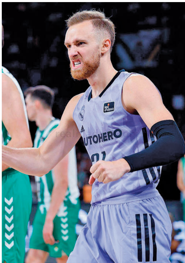
El Real Madrid ya ganó en Sevilla en la última Supercopa

LA ZONA CALIENTE SE HA APRETADO TRAS LOS ÚLTIMOS RESULTADOS