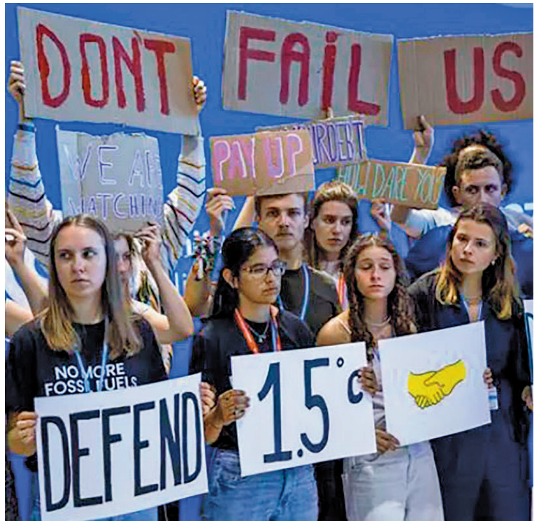
Activistas durante la COP27

Los países han acordado que aquellas naciones que más emisiones emiten también puedan contribuir al fondo, como es el caso de China e India. Ese fue, precisamente, uno de los aspectos que estu-