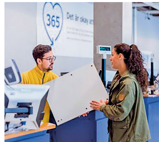
Empleados en la campaña de Navidad

A pesar de estas previsiones de caída, en el caso de la hostelería se pronostica un incremento del 12,4%, hasta los 96.987 contratos. Randstad precisa que el sector logístico será uno de los principales dinamizadores, con cerca de 200.000 contratos.