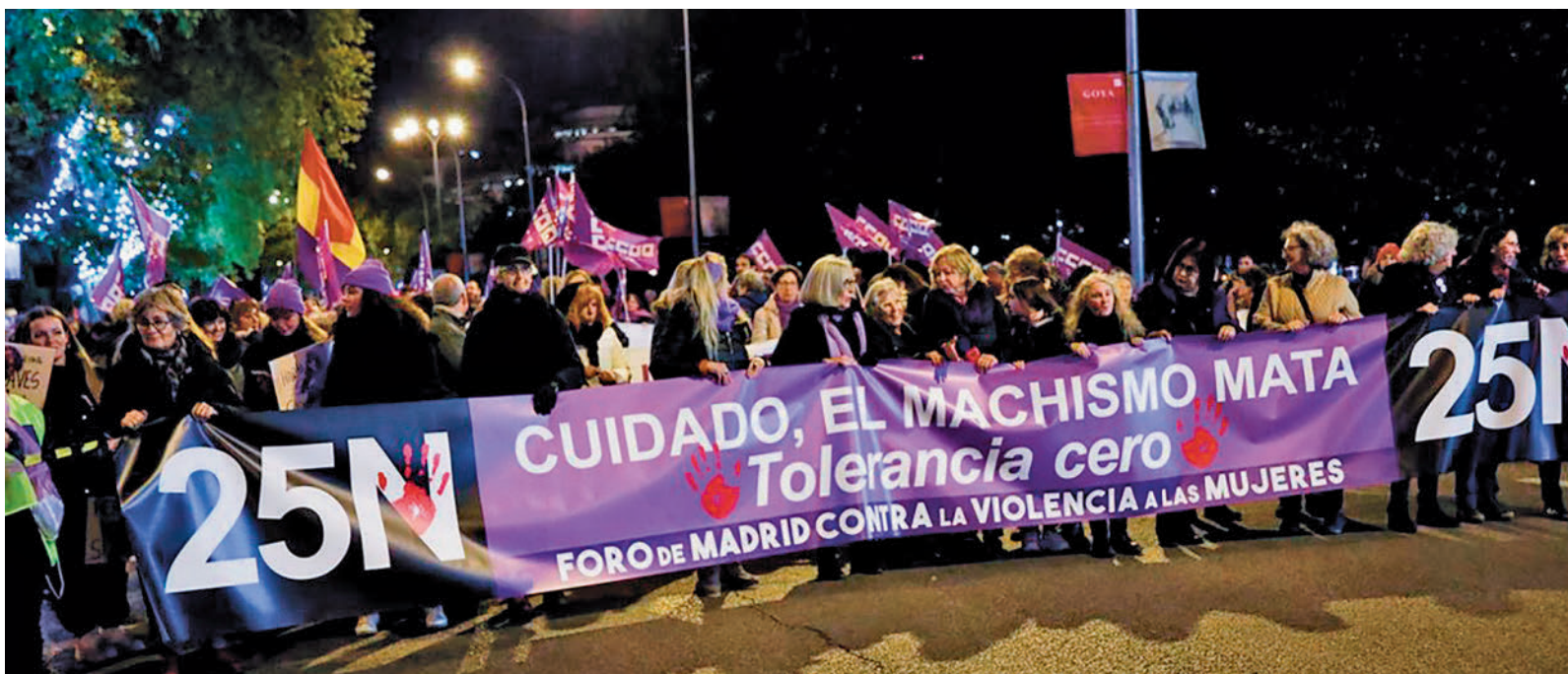
Manifestación contra la violencia machista en las calles de Madrid