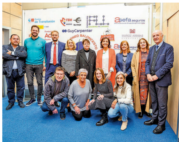
Foto de familia en la presentación

lino competirán Real Madrid, Valencia Basket, Cajasiete Canarias, Real Canoe, Fundal Alcobendas y la selección infantil de Madrid; mientras que en el femenino estarán presentes Movistar Estudiantes, Real Canoe, Femenino Alcorcón y la selección infantil madrileña.