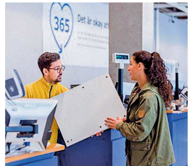
Empleados en la campaña de Navidad

A pesar de estas previsiones de caída, en el caso de la hostelería se pronostica un incremento del 12,4%, hasta los 96.987 contratos. Randstad precisa que el sector logístico será uno de los principales dinamizadores, con cerca de 200.000 contratos.