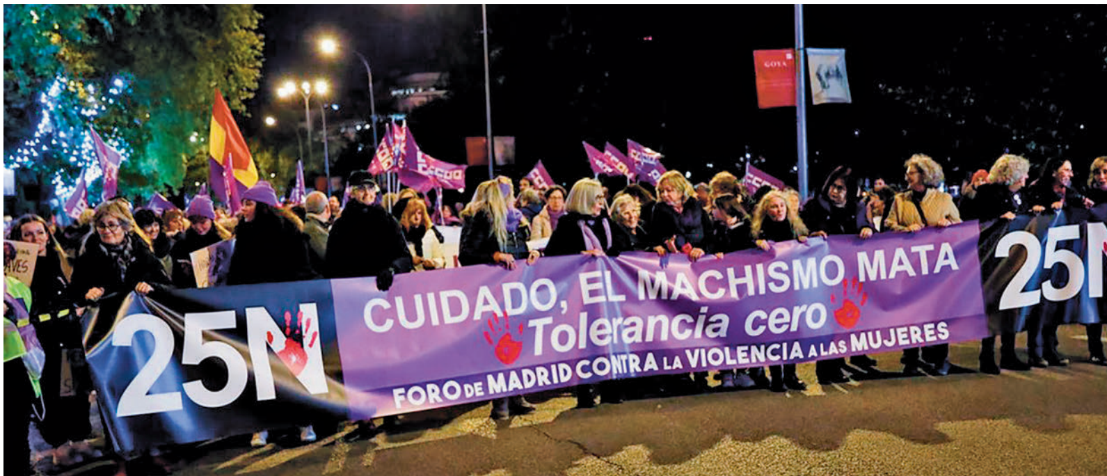
Manifestación contra la violencia machista en las calles de Madrid