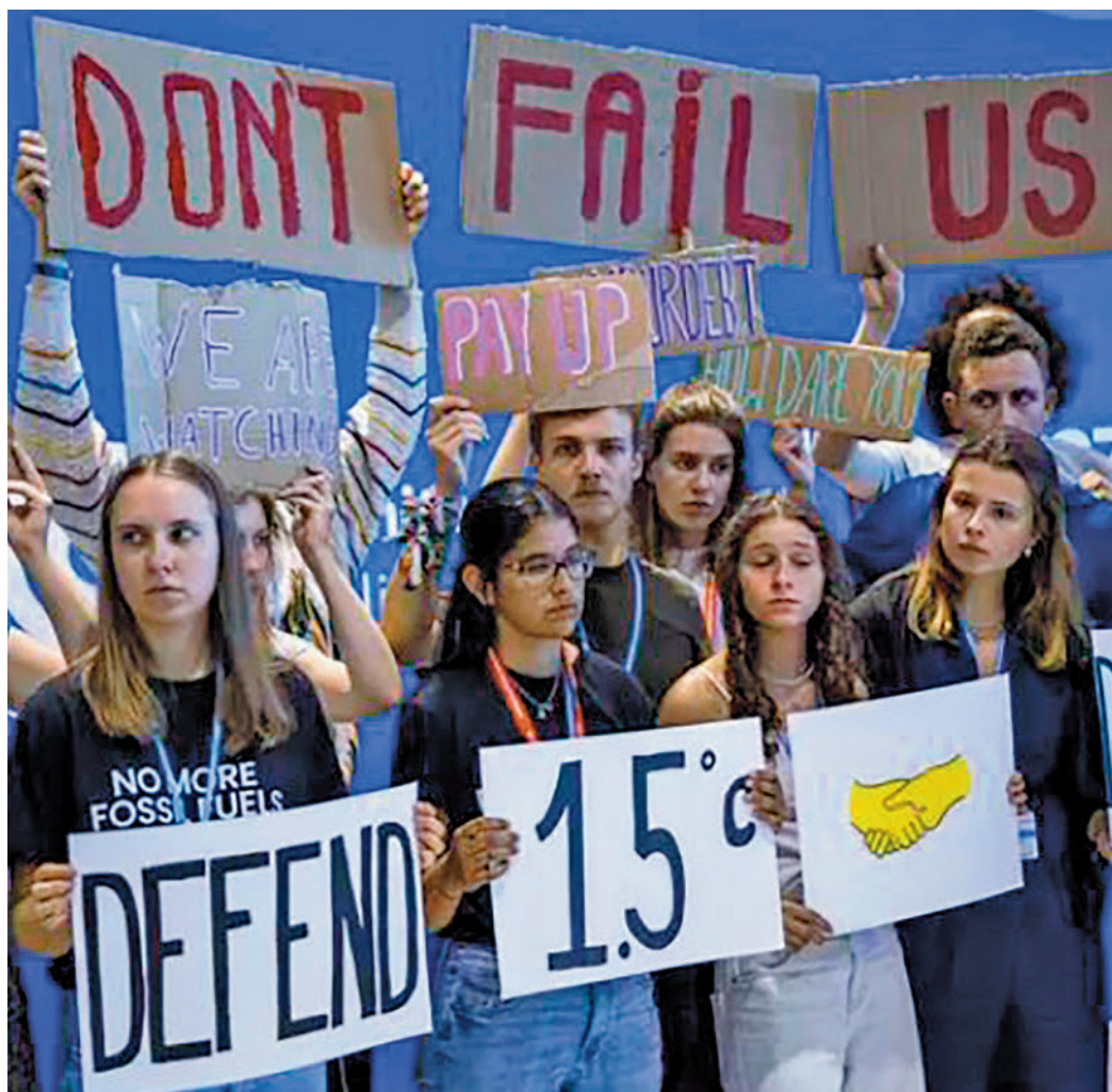
Activistas durante la COP27

Los países han acordado que aquellas naciones que más emisiones emiten también puedan contribuir al fondo, como es el caso de China e India. Ese fue, precisamente, uno de los aspectos que estu-