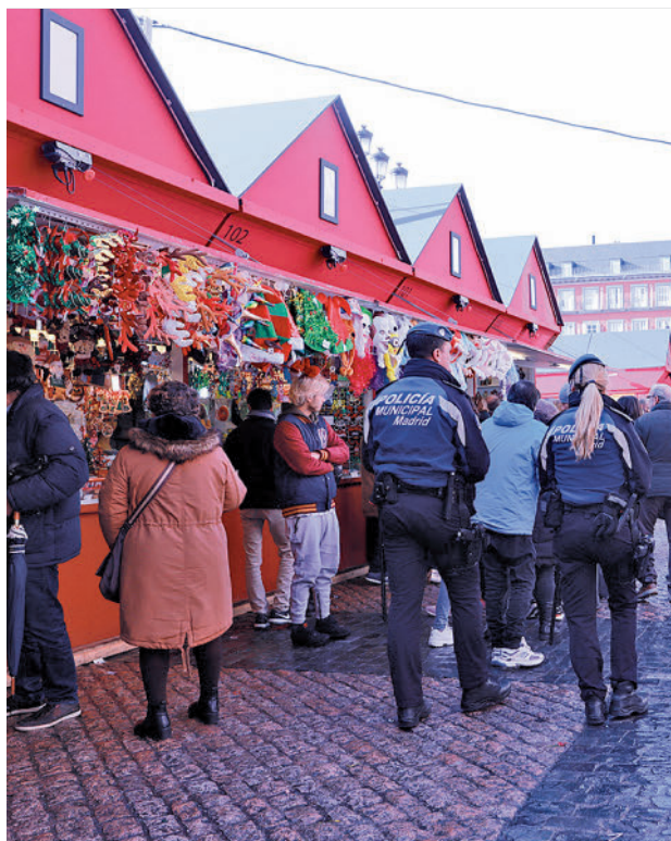
Agentes de la Policía Municipal patrullan a pie la Plaza Mayor

Desde Cibeles prevén que los días con más personas en las calles de la ciudad serán este viernes, día 25 de noviembre (Black Friday), y el día siguiente (sábado 26), el fin de semana del 2 de diciembre y todo el puente de la Constitución, los siguientes fines de semana (incluyendo el 23 de diciembre), las fechas festivas navideñas