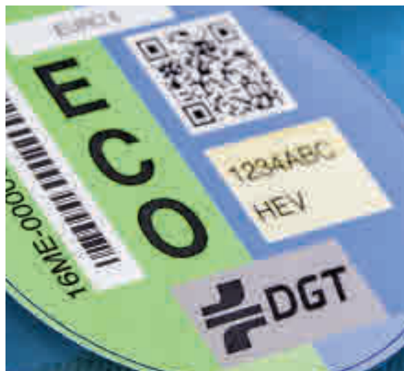
Distintivo ECO de la DGT

Así, cualquier vehículo que funcione con gas licuado o comprimido disfruta del distintivo ECO de la DGT. La organización ha recordado que los vehículos de gas liberan grandes cantidades de partículas contaminantes, contribuyendo de manera similar que los vehículos diésel y gasolina a la crisis climática.