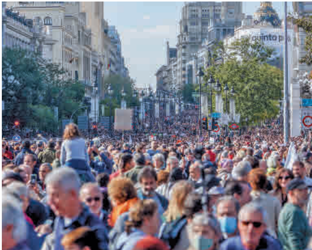
Una manifestación recorrió las calles de Madrid el pasado domingo

SANIDAD HA REALIZADO UNA NUEVA PROPUESTA AL SINDICATO