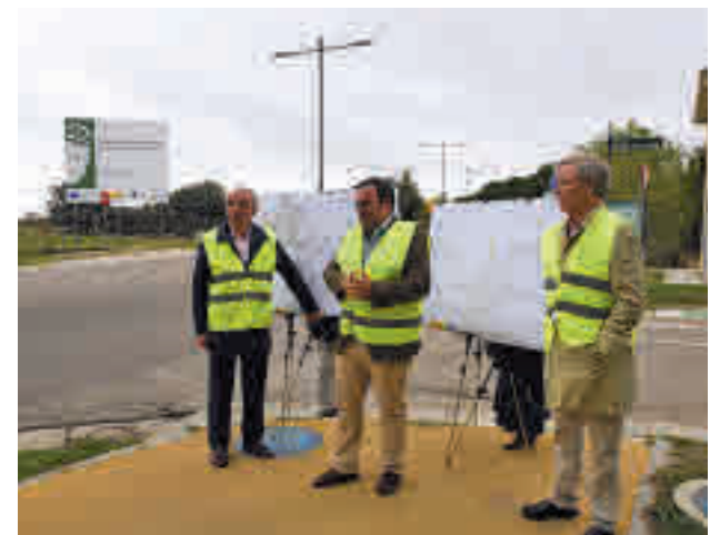
Visita del alcalde a las obras

La ampliación del carril bici está financiada por la Unión Europea-Next GenerationEU. Boadilla optó a esta financiación con un proyecto destinado a la construcción de este carril de coexistencia.