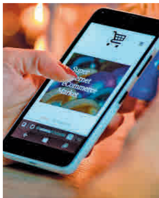
Muchas de las compras se hacen online

Desde Ironhack, la escuela de formación tecnológica, advierten