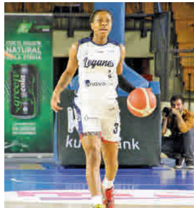
Meritorio triunfo del Leganés en Vitoria FEB

Por su parte, el Movistar Estudiantes afronta una complicada salida a la cancha del Spar Girona (viernes 18, 20 horas). El rival de las madrileñas es tercero pero cuenta con un partido menos que el dúo de líderes. A la entidad del adversario se suma el escaso descanso tras el partido de este miércoles en Eurocup.