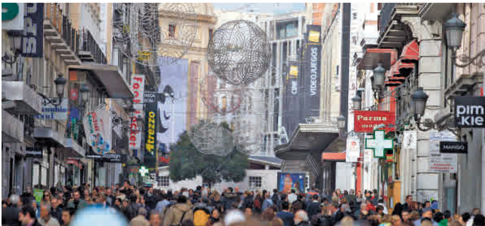
El Black Friday se ha convertido en uno de los picos de consumo del año