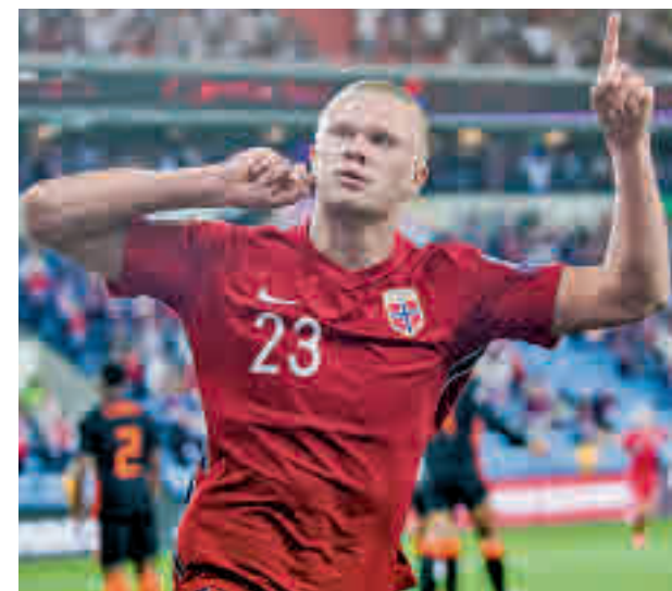
La Noruega de Haaland no se pudo clasificar

Diogo Jota, Reece James o Giovanni Lo Celso son otras ausencias ilustres, a las que podría sumarse Sadio Mané.