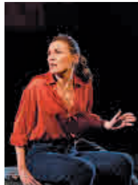
'La infamia' llega a Coslada

» Teatro Tomás y Valiente. Domingo 20, 19 horas. Precio: 9,6 euros.