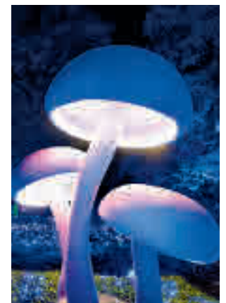
Cuarta edición de esta cita

El espectáculo ofrece una experiencia onírica fascinante que promete sorprender a los visitantes hasta el 15 de enero de 2023, invitándoles a un viaje al mismo corazón de la naturaleza a través de 20 instalaciones lumínicas en el exterior del jardín, más la ex-