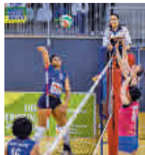
Apuros para las madrileñas

Después de los partidos de la selección, la División de Honor masculina regresa con el Pozuelo Rugby Unión recibiendo al colista (domingo, 12:30 horas). Descanso para el Complutense Cisneros.