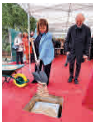
El acto oficial

Este martes 15 de noviembre tuvo lugar el acto simbólico de colocación de la pri-