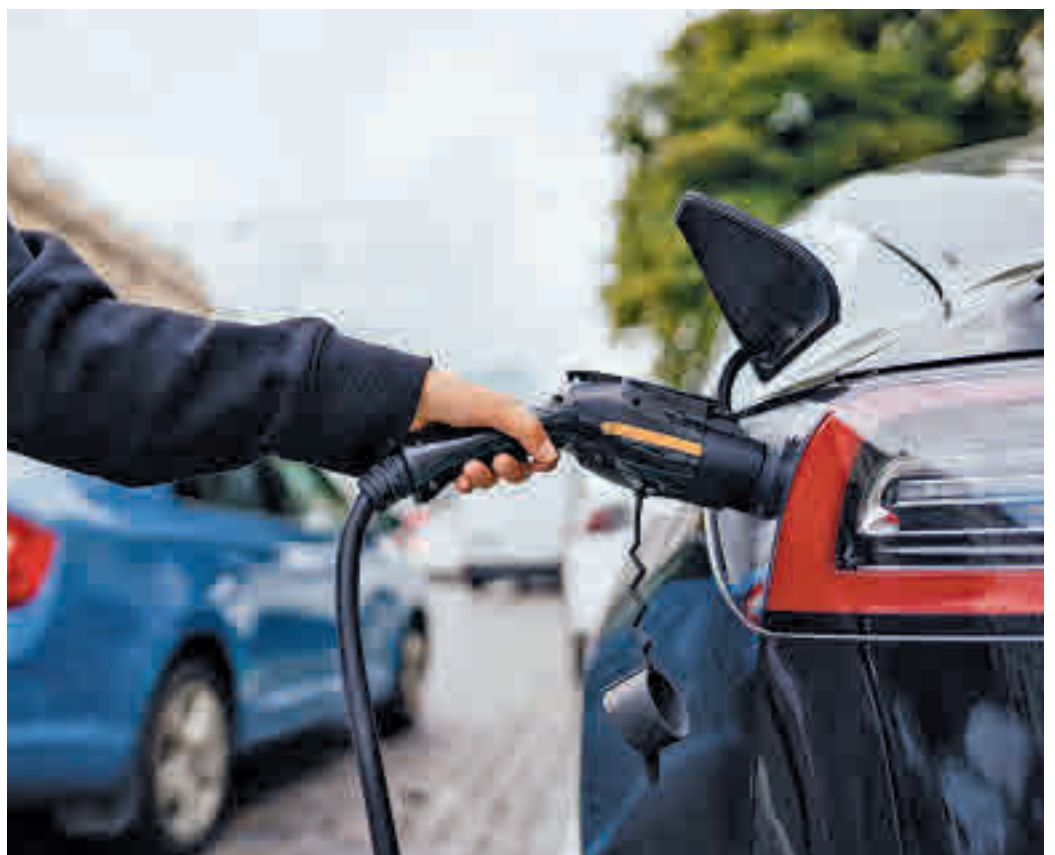
La mayoría de los propietarios de vehículo eléctrico recargan el coche en su domicilio