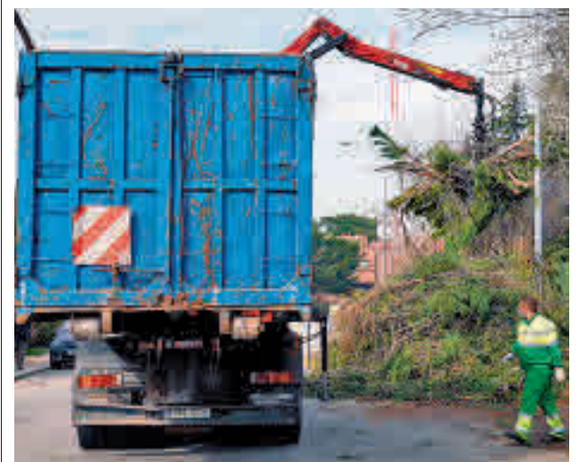
Un camión municipal recoge varias ramas

gentedigital.es La actualidad de los municipios del Noroeste, en nuestra web