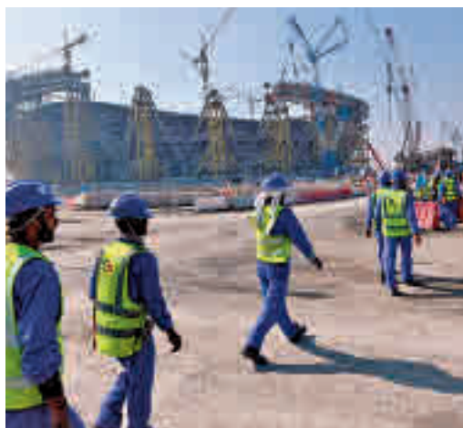
Trabajadores en los estadios

EL PERIÓDICO GENTE NO SE RESPONSABILIZA NI SE IDENTIFICA CON LAS OPINIONES QUE SUS LECTORES Y COLABORADORES EXPONGAN EN SUS CARTAS Y ARTÍCULOS