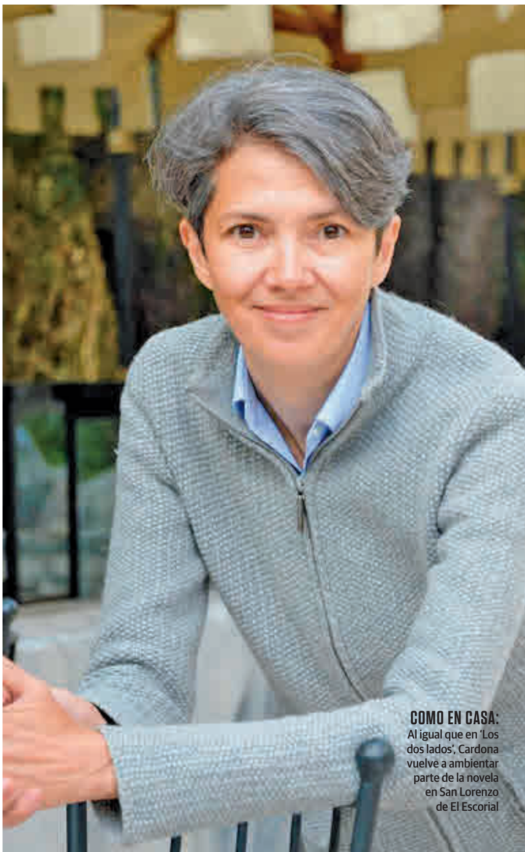
COMO EN CASA: Al igual que en ‘Los dos lados’, Cardona vuelve a ambientar parte de la novela en San Lorenzo de El Escorial

En definitiva, ‘Un bien relativo’ confirma a Teresa Cardona como una de las autoras de referencia de la novela policíaca, una valoración alimentada, entre otras cosas, por su filosofía: “Me gusta invitar al lector a reflexionar, a mirar las cosas desde diferentes prismas, a no ser demasiado rápido al juzgar. Eso nos lleva a una tolerancia que es muy necesaria”, finaliza.