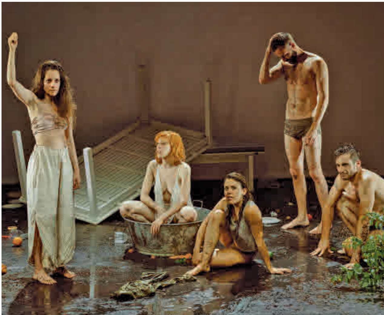
Representación de 'Tribu'

POR F. QUIRÓS SORIANO (@FranciscoQuiros)