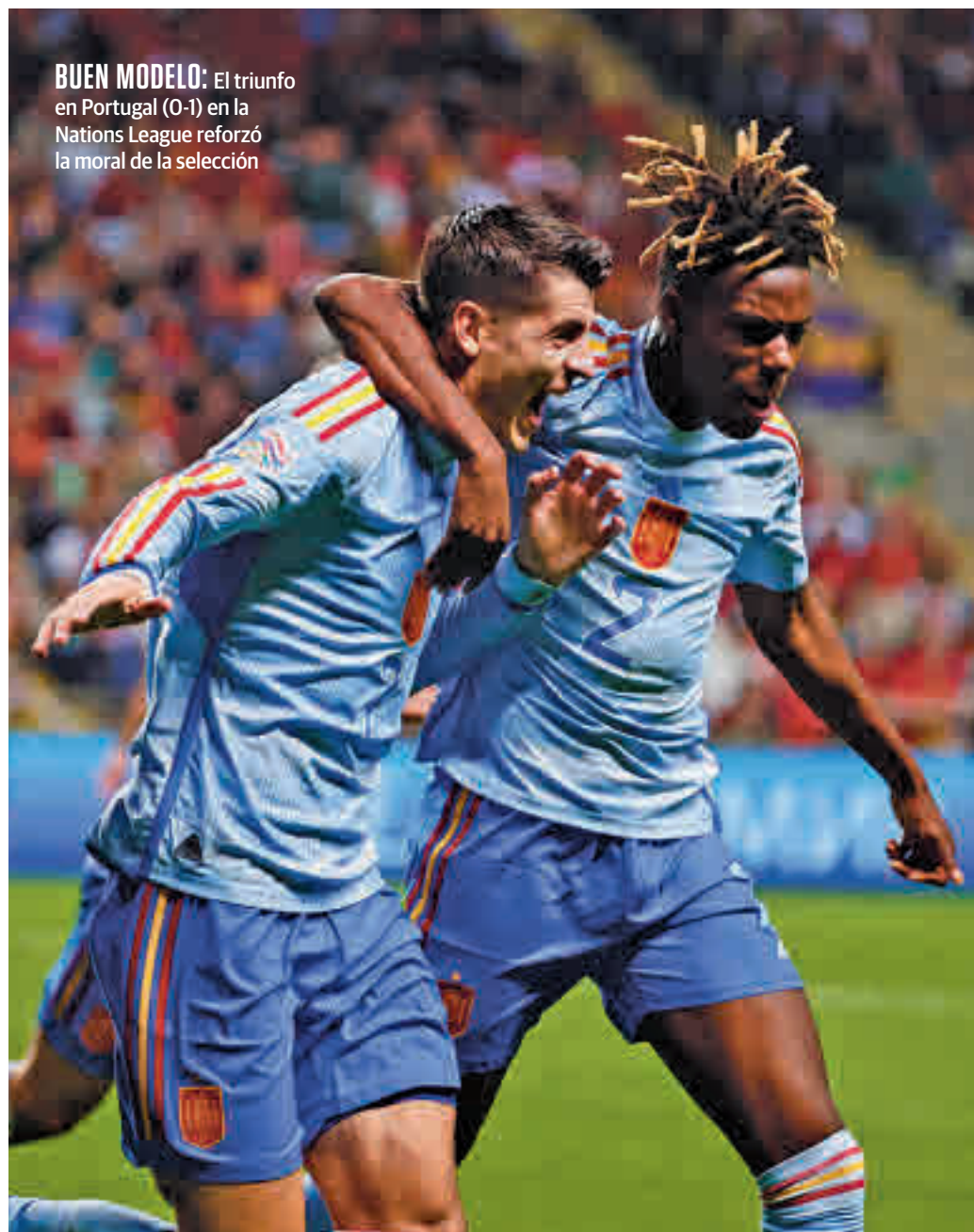
BUEN MODELO: El triunfo en Portugal (0-1) en la Nations League reforzó la moral de la selección

¿Y España? Por ranking y resultados en citas como la Eurocopa, la 'Roja' está llamada a colarse en las rondas finales gracias a un juego coral en el que no sobresalen las individualidades. Eso sí, más allá del inolvidable recuerdo de Sudáfrica 2010, la historia