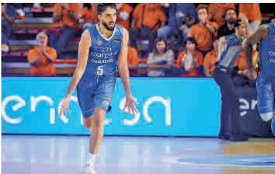
El 'Fuenla' ha ganado tres de sus últimos cuatro partidos