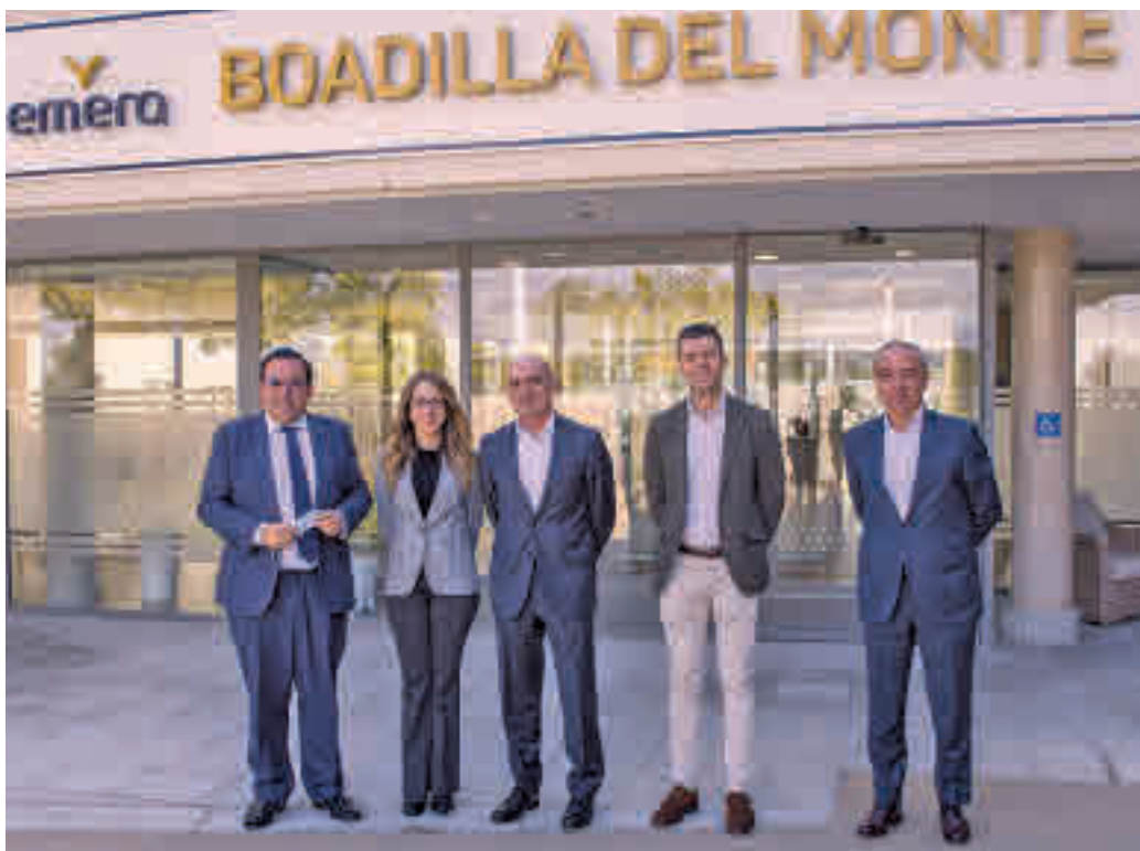
Foto de familia de la visita institucional