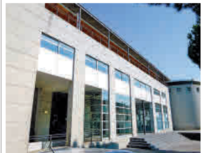
Ayuntamiento de Parla

La cárcel de Valdemoro ha aislado al preso conocido como 'La Bestia de Parla' tras protagonizar diez agresiones en solo una semana.