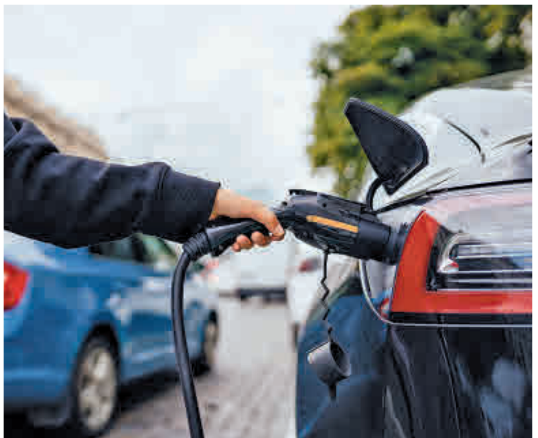
La mayoría de los propietarios de vehículo eléctrico recargan el coche en su domicilio