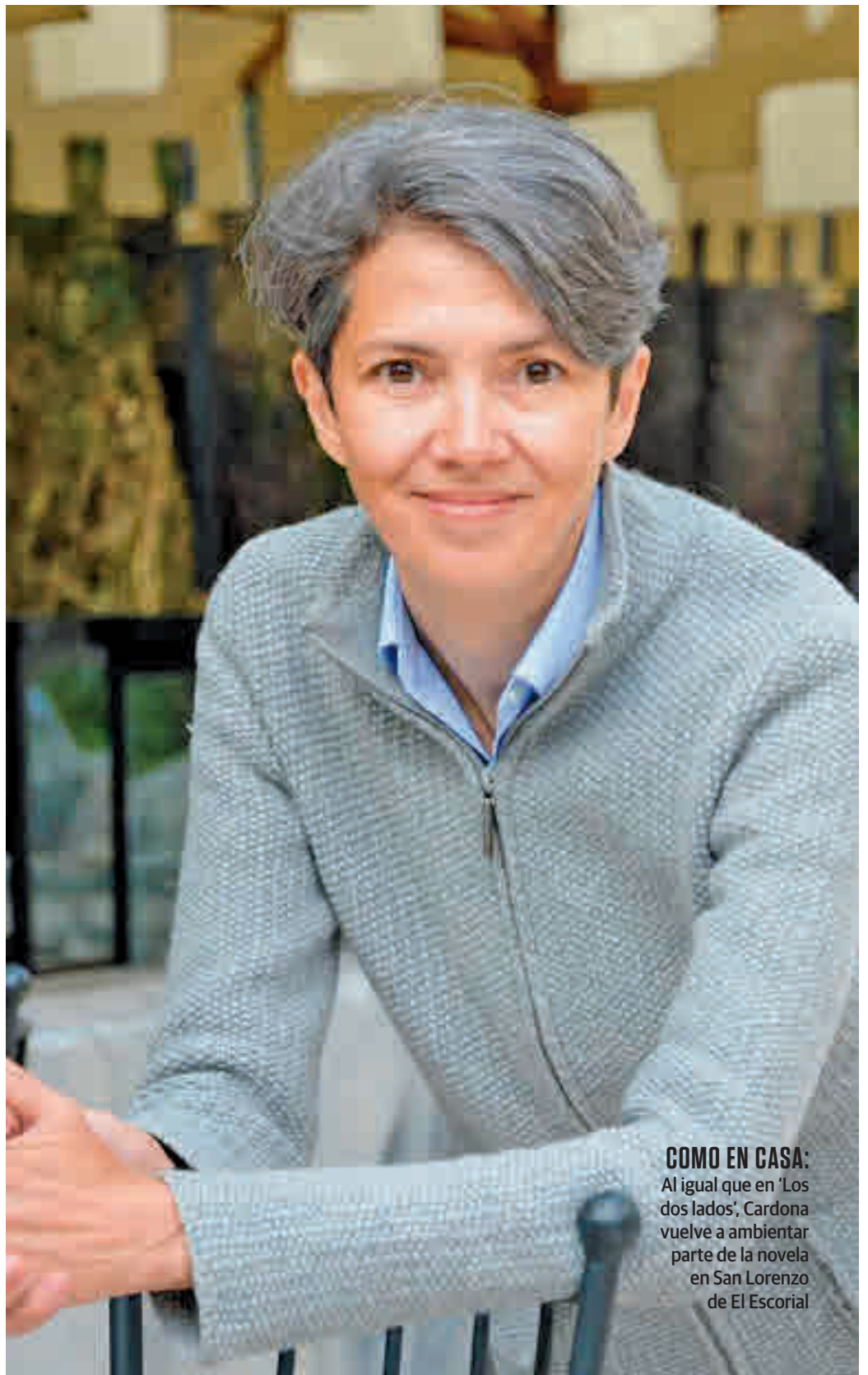
COMO EN CASA: Al igual que en ‘Los dos lados’, Cardona vuelve a ambientar parte de la novela en San Lorenzo de El Escorial

En definitiva, ‘Un bien relativo’ confirma a Teresa Cardona como una de las autoras de referencia de la novela policíaca, una valoración alimentada, entre otras cosas, por su filosofía: “Me gusta invitar al lector a reflexionar, a mirar las cosas desde diferentes prismas, a no ser demasiado rápido al juzgar. Eso nos lleva a una tolerancia que es muy necesaria”, finaliza.