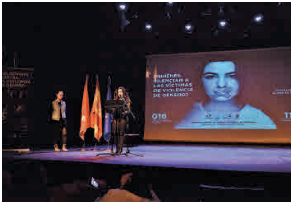
Acto del 25-N en Valdemoro del año pasado

Una de las más novedosas es el curso de defensa personal dirigido a la población femenina mayor de 16 años, cuyo objetivo es mostrar la forma de afrontar un ataque y librarse de él del mejor modo posible. Tiene una duración de 10 horas repartidas en cuatro sesiones y las asistentes aprenderán a prever y repeler una agresión, así como a poner en práctica recursos y técnicas de autoprotección. Se impartirá los domingos 20 y 27 de noviembre y 4 y 11 de diciembre en el Pa-