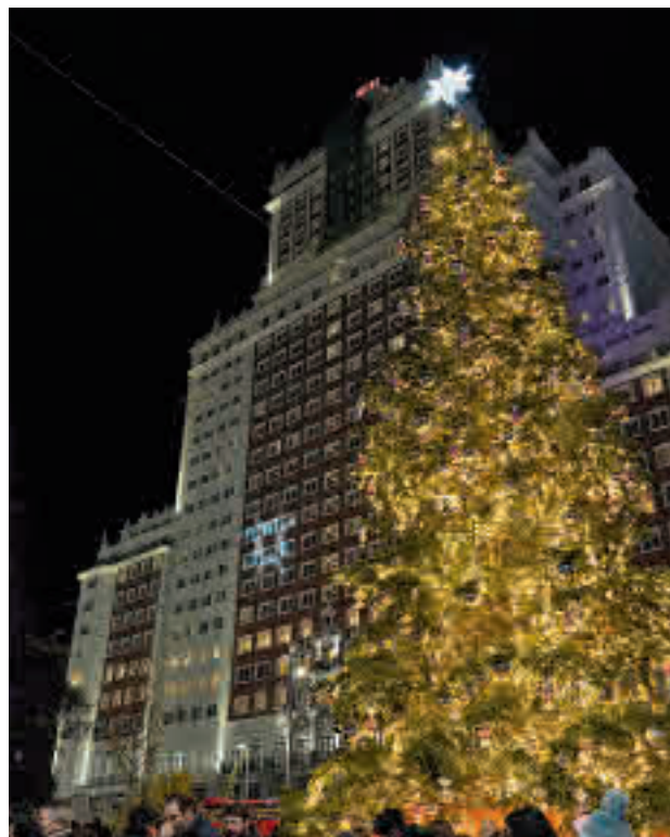
El gran abeto natural instalado en la Plaza de España

Además, los días 25, 26 y 27 de noviembre, será gratis viajar en los autobuses de la EMT para fomentar la movi-