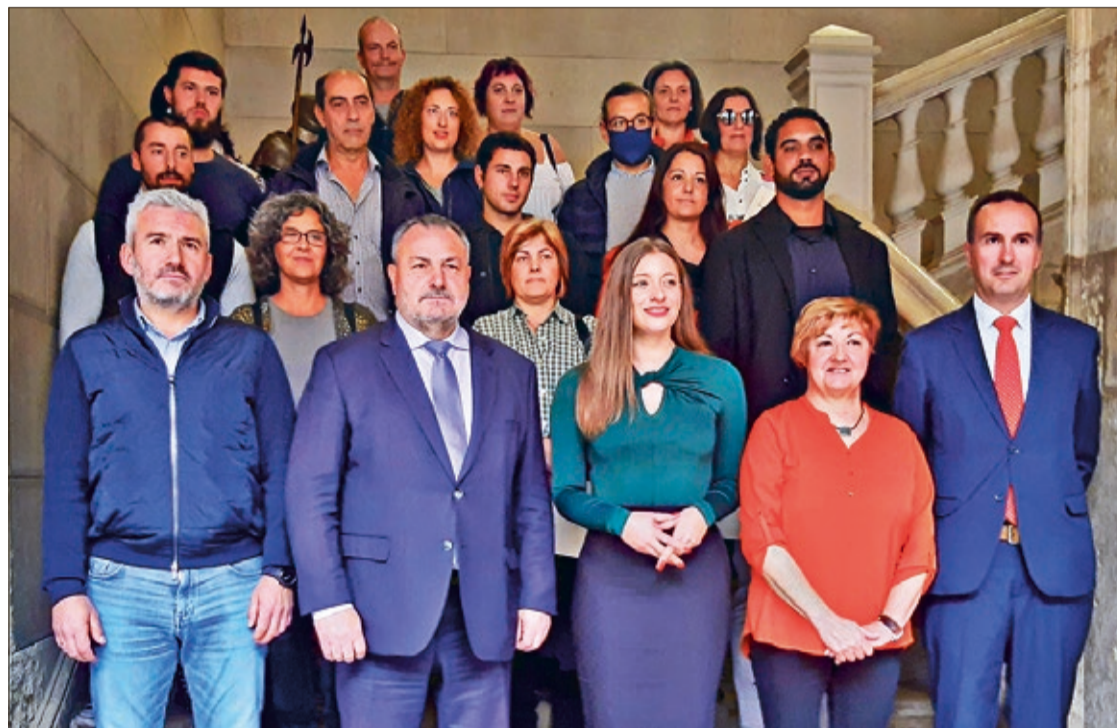
Foto de familia en la escalinata del Palacio de los Guzmanes tras la entrega de diplomas y acreditaciones de la Escuela Taller.

Esta acción formativa estuvo dividida en dos especialidades: Trabajos Forestales y Apicultura; y Auxiliar de Viveros y Jardines. Los alumnos, que han recibido la formación de dos monitores de trabajos forestales y otros dos encargados