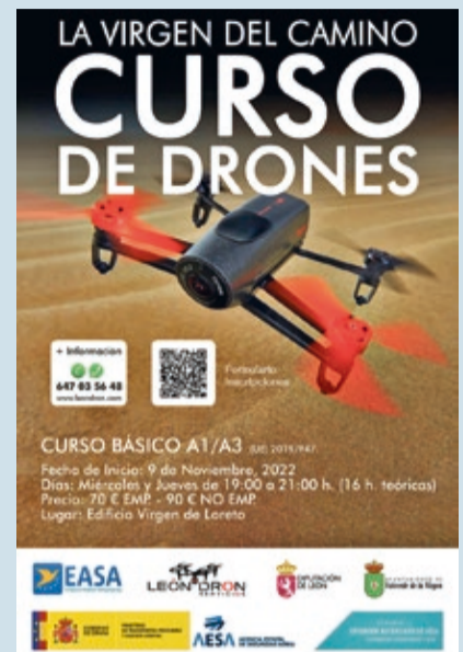
Cartel del curso de piloto de drones A1/A3.

La Concejalía de Juventud del Ayuntamiento de Valverde de la Virgen organiza durante los meses de noviembre y diciembre un nuevo Curso de Piloto de Drones en nivel básico (A1/A3) en La Virgen del Camino. El curso, que tendrá una duración de 16 horas teóricas, se realizará en el edificio de Virgen del Loreto los miércoles y jueves de 19:00 a 21:00 horas, con fecha de inicio el 9 de noviembre. La cuota para empadronados será de 70€; no empadronados, 90€. Las inscripciones, al teléfono 647035648.