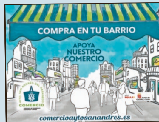
Cartel de la campaña de consumo local.

CONSUMO | LA CAMPAÑA TENDRÁ UNA DURACIÓN DE TRES MESES