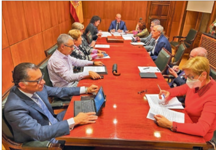
Junta de Gobierno Local del Ayuntamiento de León del 28 de noviembre.

En la sesión también se adjudicó el contrato de obras de mejora de eficiencia energética y accesibilidad en varios edificios del Coto Escolar y la adecuación de su Aula de Pesca por 441.655,89 euros; la memoria valorada de la adecuación de los juegos in-