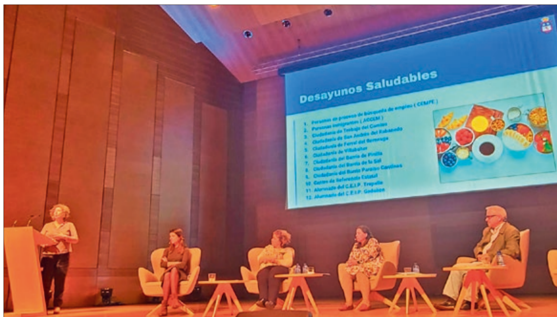
El Ayuntamiento de San Andrés presentó su 'Estrategia de Salud' en la jornada sobre salud comunitaria, en Valladolid.