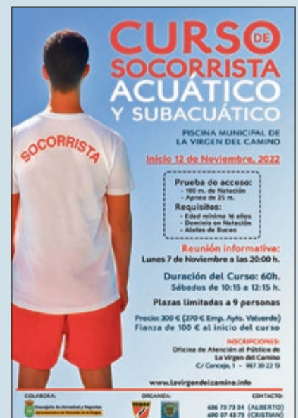
Cartel del curso de socorrista.

El Ayuntamiento de Valverde de la Virgen, junto con la Federación de Castilla y León de Actividades Subacuáticas, organiza a partir del 12 de noviembre un Curso de Socorrista Acuático y Subacuático en la Piscina Climatizada de La Virgen. Para realizar este curso será necesario tener un mínimo de 16 años, un buen dominio de la natación y poseer aletas de buceo. El precio del curso será de 270€ para los empadronados en Valverde y 300€ para el resto de interesados. Inscripciones, hasta el 7 de noviembre (Tlf. 987 30 22 13).