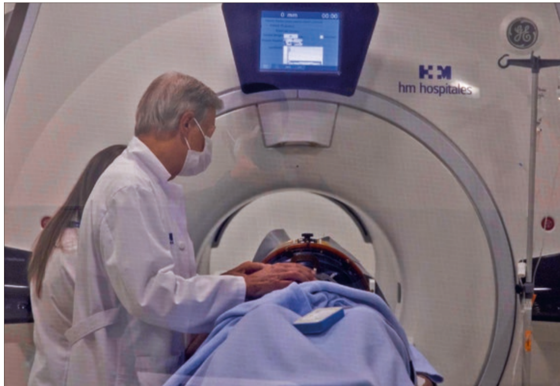
Intervención con HIFU del Centro Integral de Neurociencia AC HM CINAC Madrid del que podrán beneficiarse los leoneses.

El HIFU es un tratamiento no invasivo y con menos efectos secundarios, posicionado como la mejor opción para pacientes que, por edad, comorbilidades u otros motivos no son candidatos a la cirugía. Es un procedimiento seguro y que reporta un beneficio inmediato y apreciable desde el mismo momento de su aplicación. “Esta terapia actúa como una especie de lupa que capta el calor de los ultrasonidos, concentrándolo en los núcleos cerebrales profundos, que es donde se