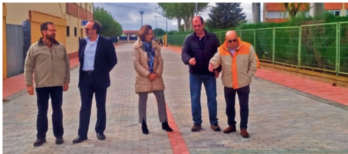
La alcaldesa de Santa María, Alicia Gallego, y ediles del equipo de gobierno supervisan una de las obras de mejora del municipio.

Aprovechando la realización de estas obras se ha valorado en algunas la inclusión de pasos de peatones accesibles o reposiciones de los sistemas de alumbrado o de saneamiento y abastecimiento en aquellos en que se hace necesario, para evitar roturas en las que indudablemente generan un perjuicio evidente al ciudadano. "Desde el Ayuntamiento queremos pedir