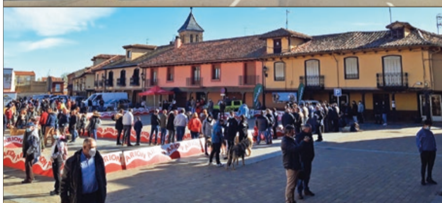
El Campeonato de Mastín (foto inferior) del 6 de noviembre es la antesala de la Feria de San Martín (arriba).

Dinamia Teatro con su espectáculo 'Un alto en el Camino', comedia para todos los públicos que remite a la defensa de los valores del Camino de Santiago.