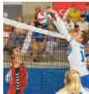
Regreso al Luis Buñuel

Con tres triunfos en otros tantos partidos, el Alcobendas Rugby encabeza el Grupo C de la División de Honor B. Este domingo (12:30 horas) jugará en Las Terrazas con el CD Arquitectura.