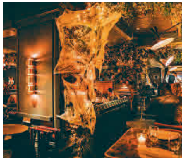
Decoración interior del restaurante

BIGOS: En Polonia sigue siendo tradición que las familias se sienten alrededor de la mesa el 1 de noviembre para celebrar recordar a sus difuntos. El plato central, Bigos, es un guiso de col fermentada con setas y carne de cualquier tipo.