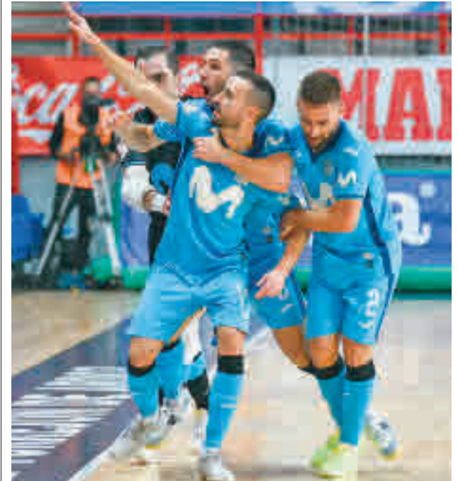
Segundo triunfo en el Jorge Garbajosa HELEN BOTO / INTER FS

Con tantas aperturas clasificatorias, el Inter tratará de afianzarse en la zona de 'play-off', un objetivo a corto plazo que pasa por sacar los tres puntos en su visita de este sábado 29 (17:30 horas) de la pista del Quesos Hidalgo Manzanares, un rival que viene de perder sus dos últimos partidos ante Cartagena y Antequera por el mismo resultado: 5-3.