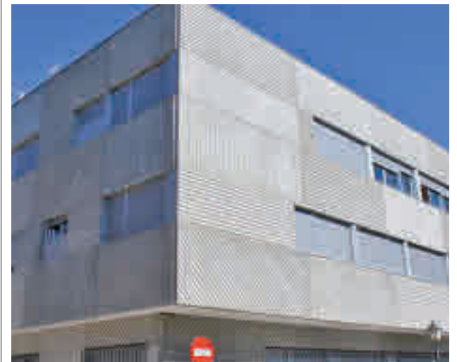
Las viviendas construidas en la calle de Tubo

La inscripción puede realizarse online en la web municipal.