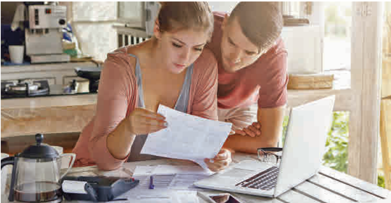
Las facturas energéticas se han convertido en un quebradero de cabeza para las familias