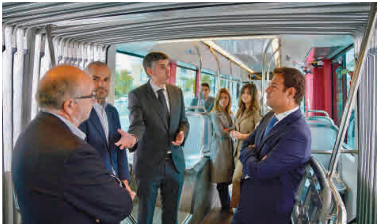
Presentación del nuevo Autobús de Uso Prioritario en Las Rozas

El vehículo fue presentado hace unos días por la presidenta de la Comunidad de Madrid, Isabel Díaz Ayuso, como parte de la estrategia de movilidad para la región. Se trata de un autobús con capacidad para unas 150 personas aproximadamente, totalmente eléctrico y con autonomía suficiente para completar una jornada de servicio. Además, contará con preferencia en las intersecciones.