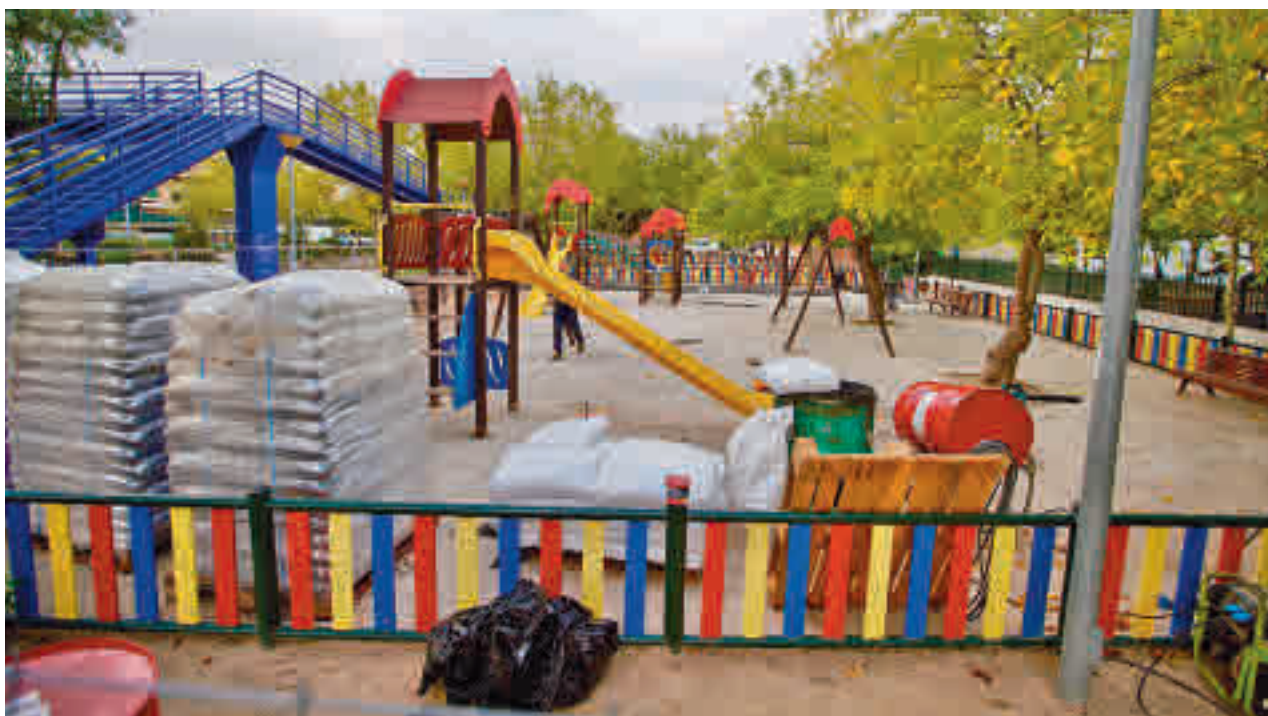
Las obras que se está realizando en la zona verde de 4 Elementos, en el barrio de Yucatán